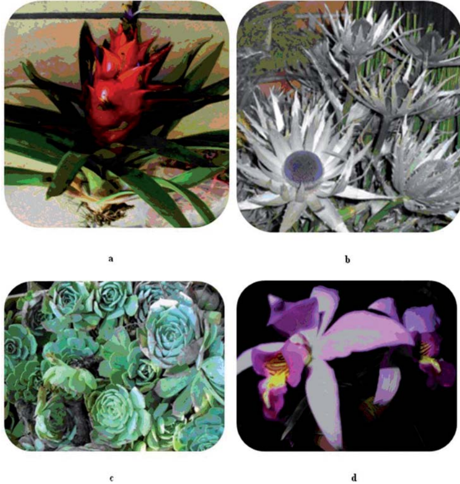
Fig. 3. Especies representativas de los géneros con mayor número de especies comercializadas. a) Tillandsia imperialis E. Morren ex Mez, b) Eyngium proteiflorum F. Delaroché, c) Echeveria secunda Booth ex Lindl. y d) Laelia anceps subsp. anceps .