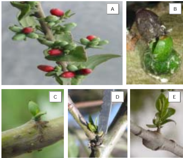
FIGURA 1. A. Planta de C. loniceroides con abundantes semillas. B. Germinación 21 días después de la inoculación (ddi). C. Aparición de las primeras hojas verdaderas (73 ddi). D. Con ocho hojas verdaderas de 1 cm de longitud (161 ddi) y E. Con 14 hojas verdaderas y 3.5 cm de longitud (185 ddi). (Fotografía B. Equihua-Martínez, A.).

Cabe mencionar que previo a esta actividad, se llevaron a cabo ensayos de poda haciendo el corte a diferentes longitudes a partir del punto de inserción de la planta, y en todos los casos no hubo rebrote. Los resultados obtenidos con las podas son principalmente mejorar la estética del árbol y del lugar, así como evitar el incremento de inóculo o semilla que pudiera ser dispersado por las aves a áreas adyacentes. Sin embargo, en muchos de los casos, algunas ramas ya estaban parasitadas; al no poder observar la planta del muérdago en sus etapas tempranas, dichas ramas no se podaron y la planta ha continuado su desarrollo. Considerando que las podas se tendrían que realizar de manera continua, dos estrategias parecen ser las que tendrían mayor éxito en un futuro, en especial para las áreas urbanas: el uso de clones o materiales resistentes y el control biológico, áreas que desafortunadamente a la fecha no han llamado la atención de los investigadores.