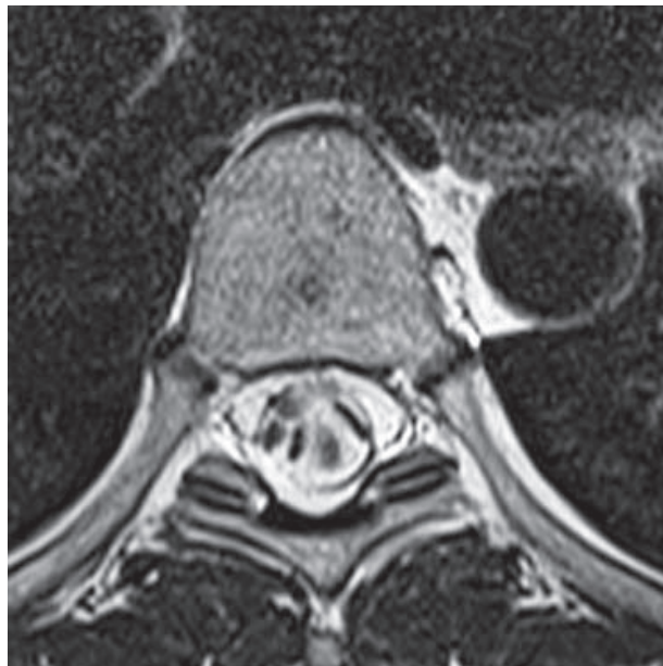
Figura 2. Corte axial de resonancia magnética que demuestra el desplazamiento ventrolateral derecho de la médula espinal. Las imágenes hipointensas en la parte dorsal del canal medular corresponden a artificio por flujo turbulento del líquido cefalorraquídeo.