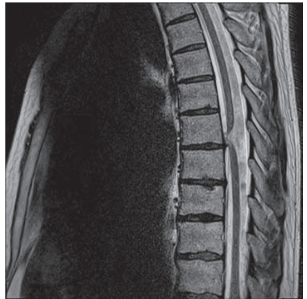
Figura 1. Corte sagital de resonancia magnética que demuestra desplazamiento ventral de la médula espinal a nivel de T6-T7. En las imágenes ponderadas a T1 posterior a la administración de gadolinio se aprecia reforzamiento de la dura, lo que permite identificar el defecto dural.

Al paciente se le practicó laminectomía T6-T7 con duroplastia anterior, confirmando el diagnóstico de herniación medular transdural idiopática. Posterior a la cirugía, el paciente presentó remisión total de la sintomatología. Realizamos control imagenológico posquirúrgico donde se observó cordón medular de localización central en el canal medular y movimiento normal del líquido cefalorraquídeo en la parte ventral y dorsal del canal medular (figura 3).