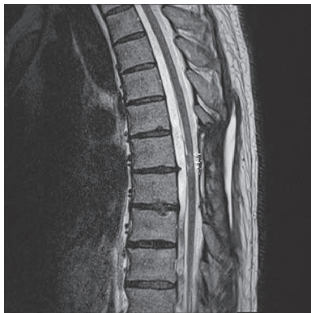
Figura 3. Corte sagital de resonancia magnética que demuestra cambios posquirúrgicos en las estructuras del arco posterior a nivel de T6-T7. No se observa desplazamiento ventral de la médula espinal. Las imágenes hipointensas en el espacio epidural ventral corresponden a artificio por turbulencia de flujo de líquido cefalorraquídeo.