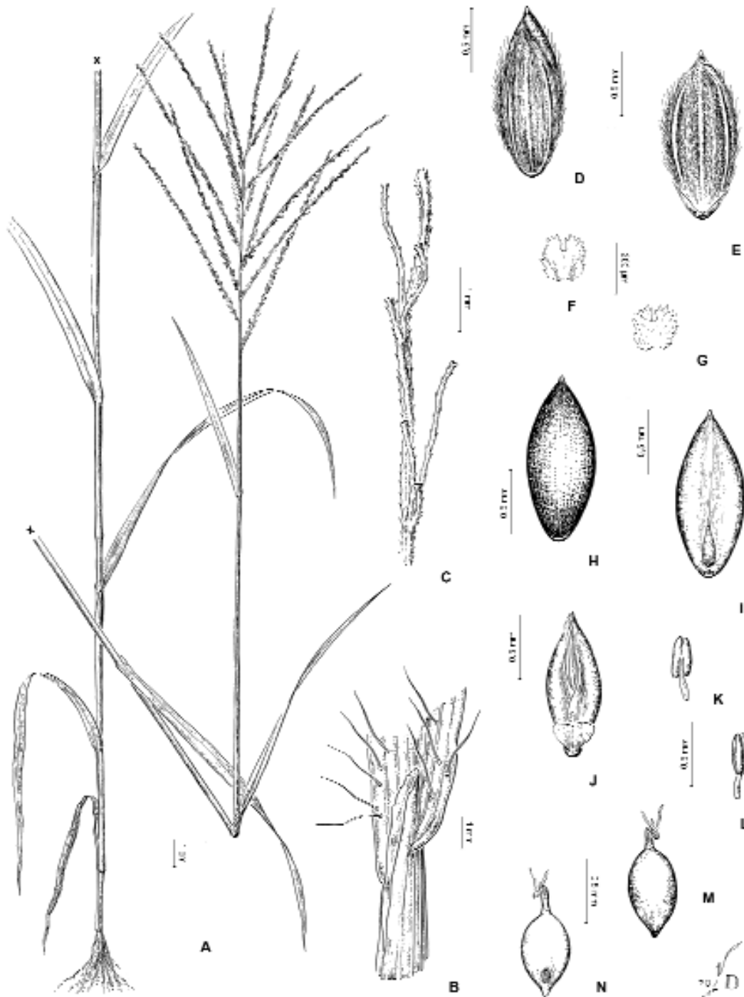
Fig. 3. Digitaria multiflora . A , hábito. B , lígula. C , fragmento del raquis con pedicelos desprovistos de espiguillas. D , espiguilla vista desde la gluma superior. E , espiguilla vista desde la gluma y lemma inferiores. F , pálea inferior, vista ventral. G , pálea inferior, vista dorsal. H , antecio superior, vista dorsal. I , antecio superior, vista ventral. J , pálea y lodículas de la flor superior. K-L , estambre. M , cariosopsis, vista escutelar. N , cariosopsis, vista hilar. De C. L. Lundell 6694 (US).