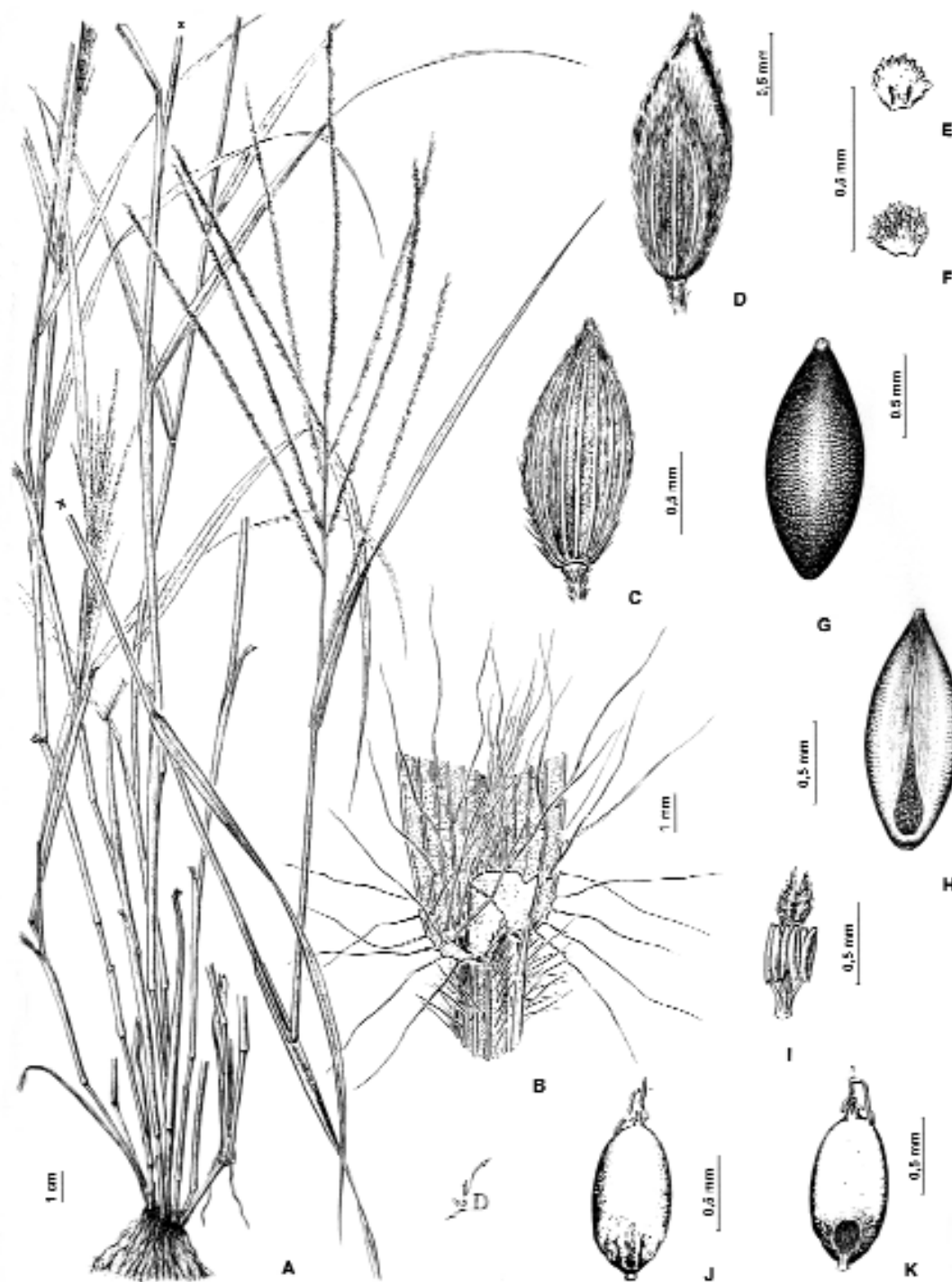
Fig. 1. Digitaria cayoensis . A , hábito. B , lígula. C , espiguilla vista desde la gluma y lemma inferiores. D , espiguilla vista desde la gluma superior. E , pálea inferior, vista ventral. F , pálea inferior, vista dorsal. G , antecio superior, vista dorsal. H , antecio superior, vista ventral. I , androceo y gineceo de la flor superior. J , carriopsis, vista escutelar. K , carriopsis, vista hilar. De C. L. Lundell 6670 (US).