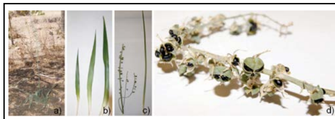
Figura 2. Hemiphylacus novogalicianus . a) Planta en su hábitat, b) Hojas, c) Inflorescencia y d) Flor y fruto. Fotografías tomadas en la zona de recolección y durante el procesamiento del material vegetal.