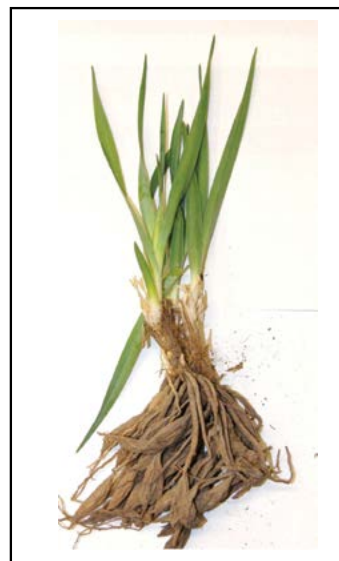
Figura 4. Hojas y bulbos de Hemiphylacus novogalicianus recolectada en San Pedro Piedra Gorda, Cd. Cuauhtémoc, Zacatecas.

De igual manera, si la actividad biológica de H. novogalicianus está conferida a compuestos tipo alcaloide o alguno de los metabolitos secundarios descritos para otros miembros de la subfamilia Hyacinthaceae , resulta necesario el análisis de extractos de mayor polaridad como el acetónico; ya que éste, debido a la capacidad de extracción del disolvente, puede contener compuestos de tipo flavonoide, terpenos y alcaloides. También se debe examinar el extracto metanólico donde pueden