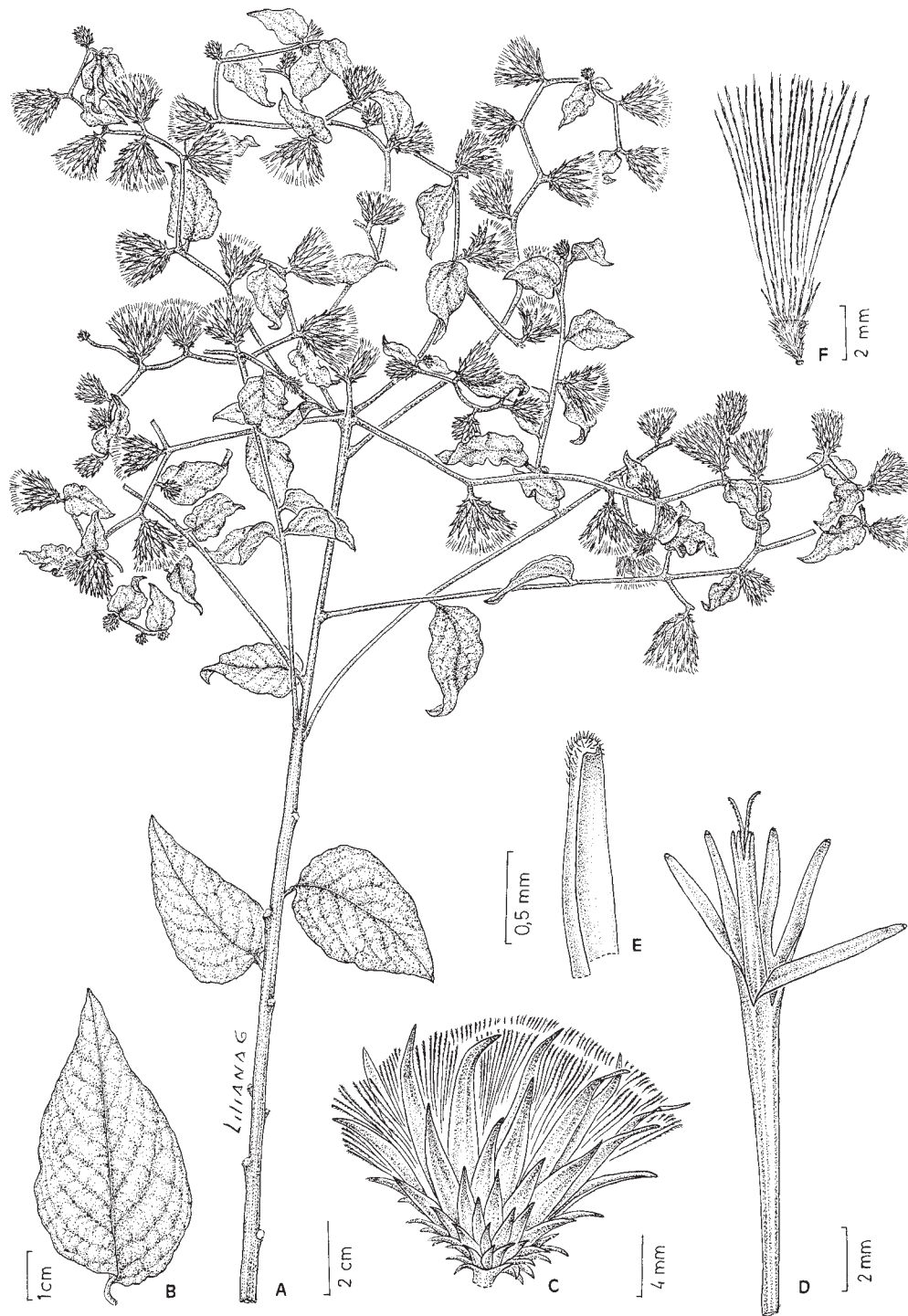
Fig. 1. Mattfeldanthus andrade-limae . A: rama florífera. B: hoja. C: capítulo. D: corola, con anteras y estilo. E: ápice del lóbulo de la corola. F: aquenio inmaduro con papus (A, Hatschbach & al. 65167, CTES. B-E, Andrade Lima 55-2119 isotypus CTES).