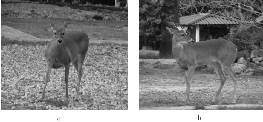
Figura 1. a. Hembra O. virginianus ; b. Macho O. virginianus Puerto Gaitán, Meta.