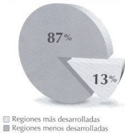
Gráfica 1. Proporción de la población mundial correspondiente a las regiones más desarrolladas y menos desarrolladas