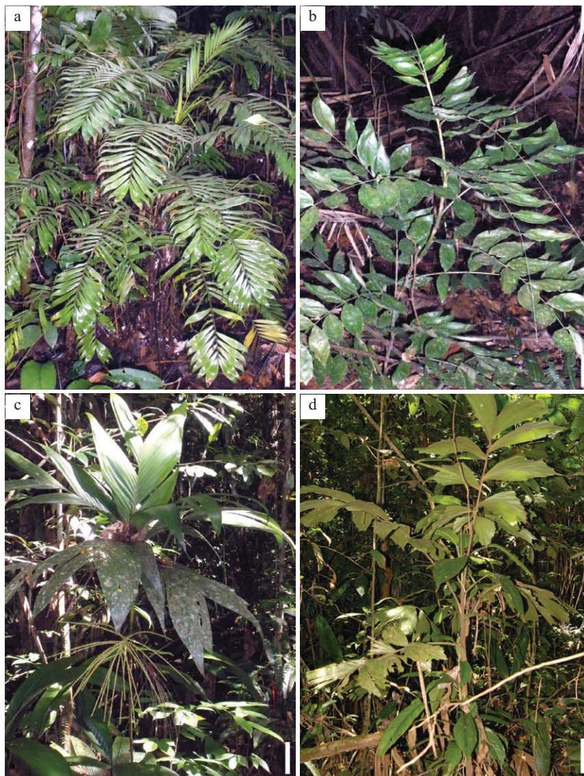
Fig. 2. Palmas del sotobosque de la Reserva Nacional Allpahuayo-Mishana. a. Bactris hirta var. pectinata . Escala = 20 cm. b. Desmoncus polyacanthos . Escala = 10 cm. c. Hyospathe elegans . Escala = 15 cm. d. Iriartella stenocarpa . Escala = 10 cm.