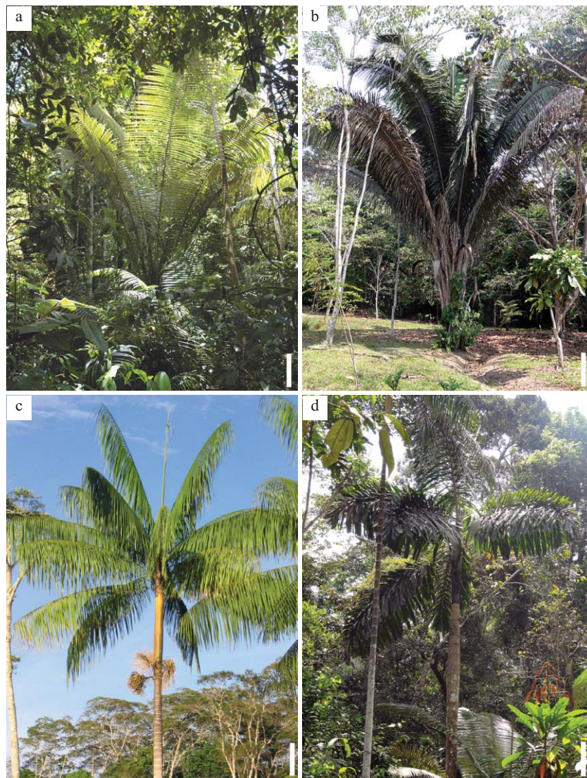
Fig. 4. Palmas emergentes de la Reserva Nacional Allpahuayo-Mishana. a. Astrocaryum macrocalyx . Escala = 0,6 m. b. Attalea salazarii . Escala = 0,8 m. c. Euterpe precatoria var. precatoria . Escala = 0,6 m. d. Iriartea deltoidea . Escala = 0,6 m.