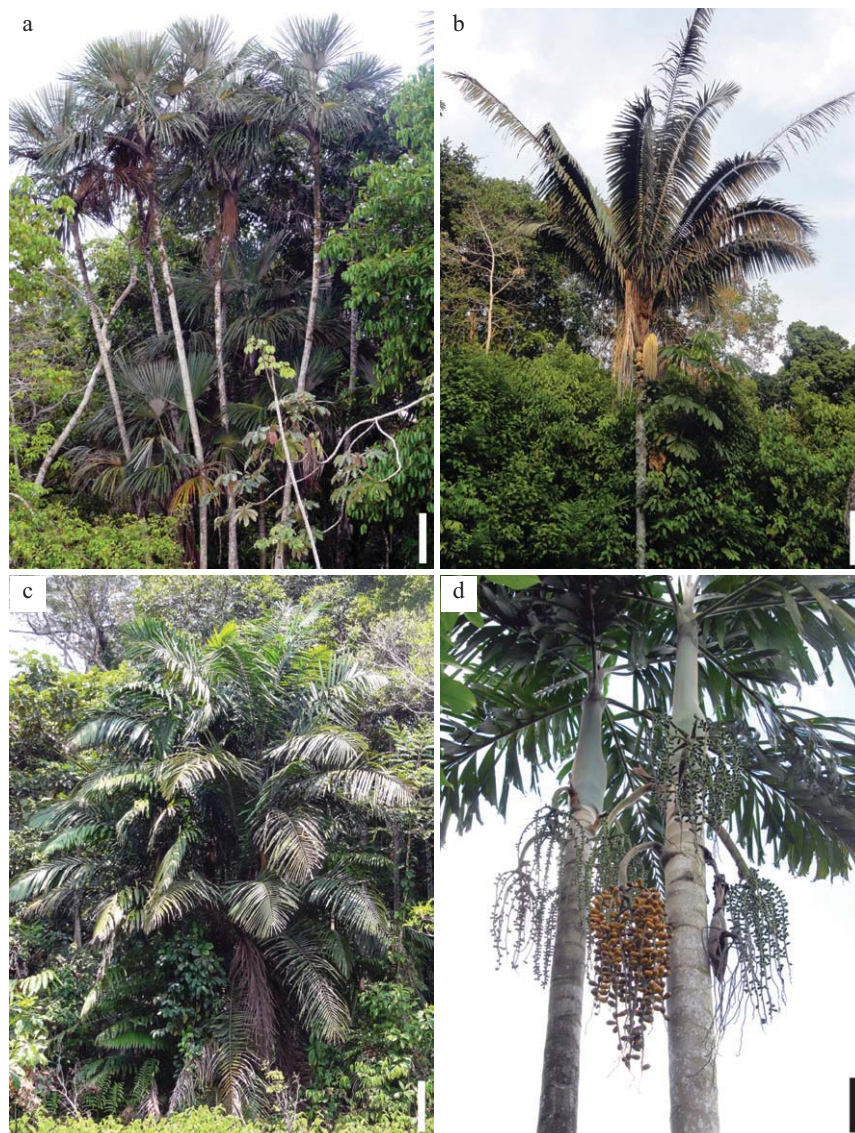
Fig. 5. Palmas emergentes de la Reserva Nacional Allpahuayo-Mishana. a. Mauritiella armata . Escala = 0,7 m. b. Oenocarpus bataua . Escala = 1,5 m. c. Oenocarpus mapora . Escala = 0,8 m. d. Socratea exorrhiza . Escala = 30 cm.