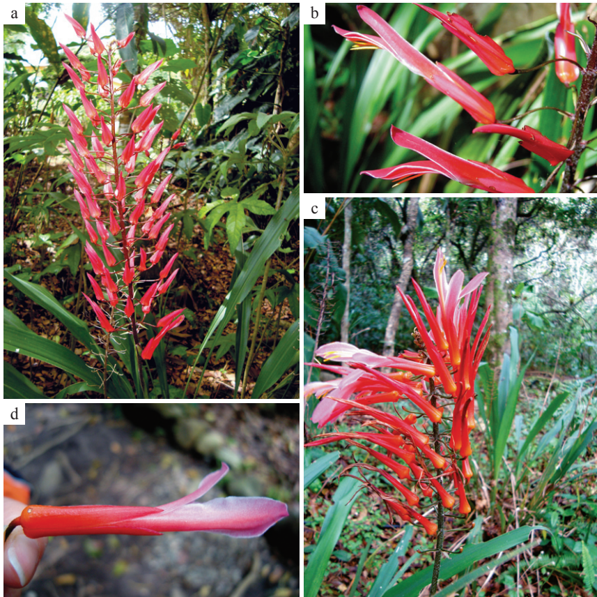
Fig. 3. Pitcairnia nubigena . a. Planta. b. Detalle de las flores y sépalos quillados. P. meridensis . c. Planta. d. Detalle de la flor con sépalos sin quilla. La presencia de la quilla es un caracter distintivo entre ambas especies.

Planta terrestre, tipo macolla, caulescente. Hojas con láminas verdes de coloración uniforme, glabras o escasamente escamosas, 50-55 cm de largo, 3-3,3 cm de ancho; vainas foliares verdes hasta marrones, envés totalmente tomentoso, 10-21 cm de largo, 1,7-2,3 cm de ancho. Pedúnculo erecto 0,8-1,5 cm de largo; láminas de las brácteas del pedúnculo presentes en la zona media y base, verdes, iguales a las láminas foliares; vainas 8-12 cm de largo, 2-3 cm de ancho. Inflorescencia terminal, simple, tipo racimo; brácteas florales color café hasta levemente purpúreas, haz escasamente tomentoso, envés abundantemente tomentoso, 0,8-1,1 cm de largo, 0,2-0,3 cm de ancho. Flores polísticas, largo-pediceladas. Sépalos rojos, aquillados. Pétalos rojizos, con 2 apéndices pequeños iguales de ápices