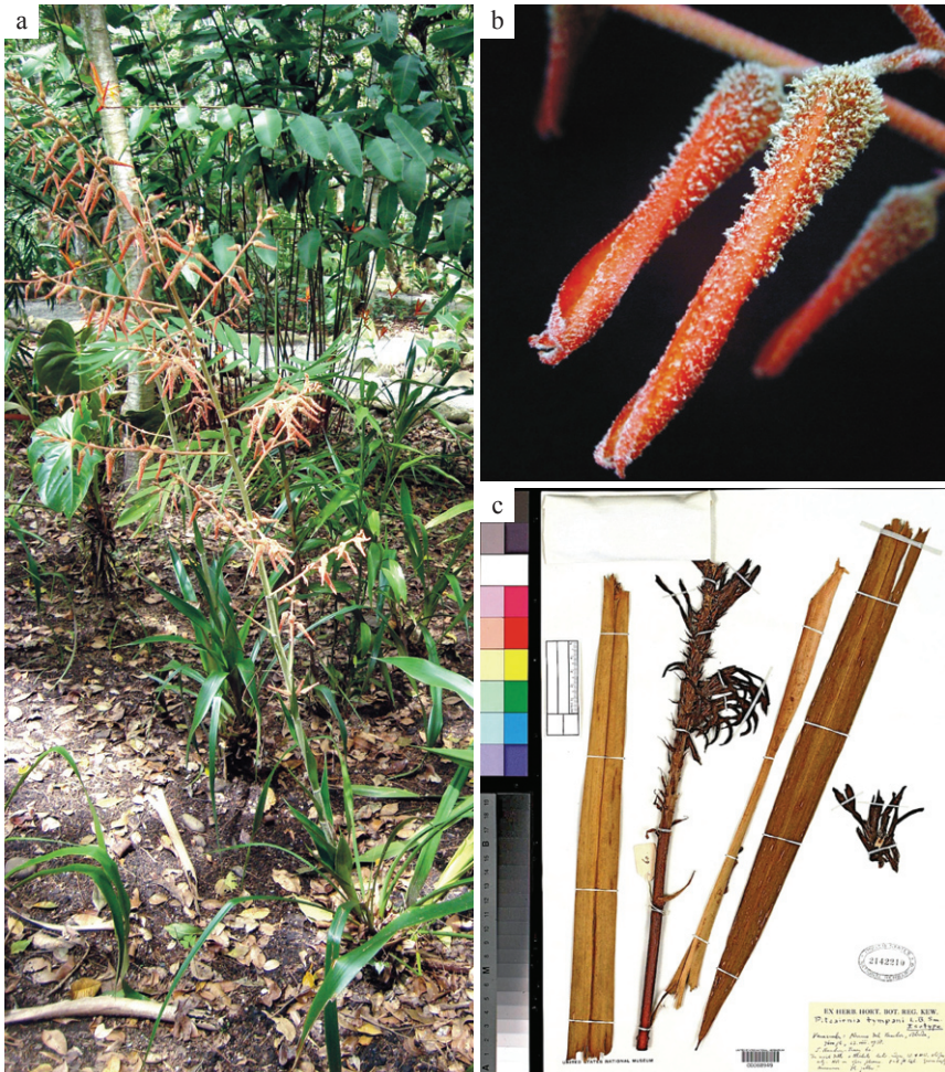
Fig. 4. Pitcairnia tuberculata . a. Planta en cultivo en el JBM. b. Detalle de la flor con sépalos tuberculados. P. typani . c. Ejemplar Tipo (imagen tomada de la base digital del herbario US).

Época de floración: mayo, septiembre-octubre.