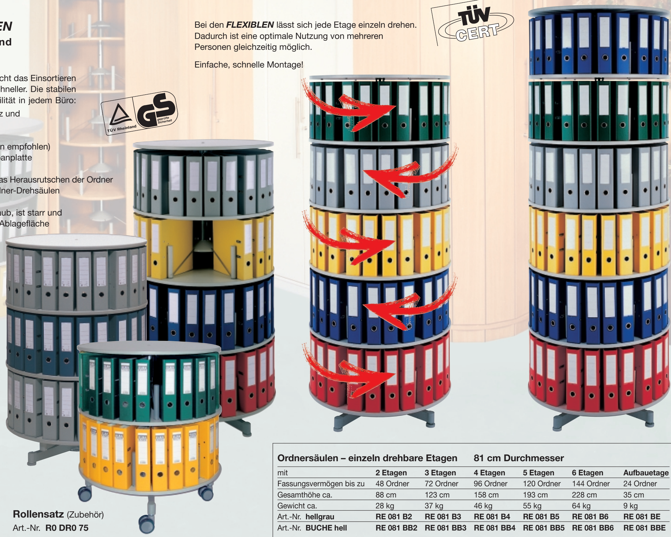
Rollensatz (Zubehör) Art.-Nr. R0 DR0 75