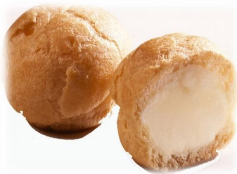
Petits choux crème fraîche +/-160 pc