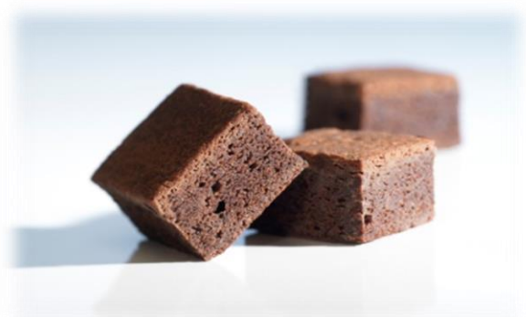
Mini brownies 96 pc