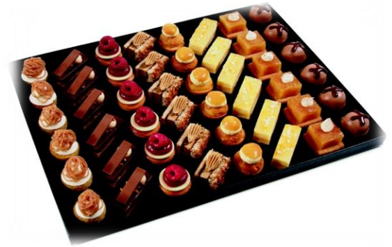
Petits fours haute couture 48 pc