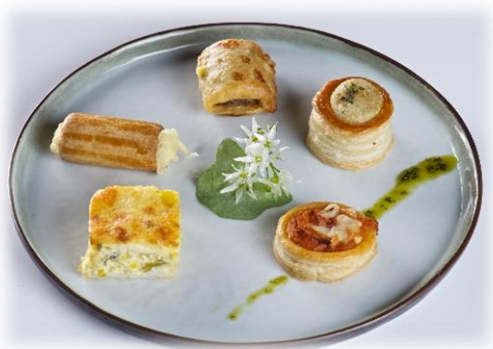
Apéro Two-Bites Oresto - 70 pc