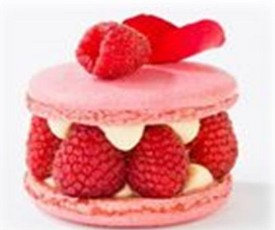
Ispahan 15 pc