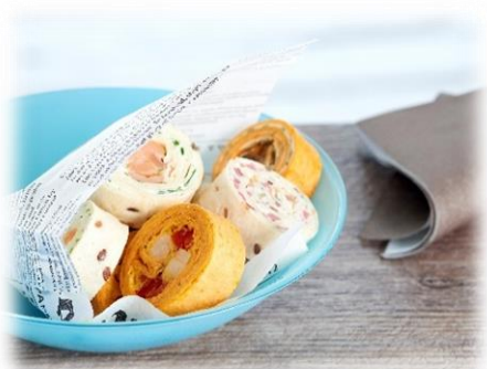
Mini-wrap "Tout en couleur" - 48 pc