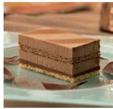
Longueur croquant chocolat 700 gr