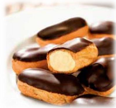
Mini éclairs chocolat 168 pc