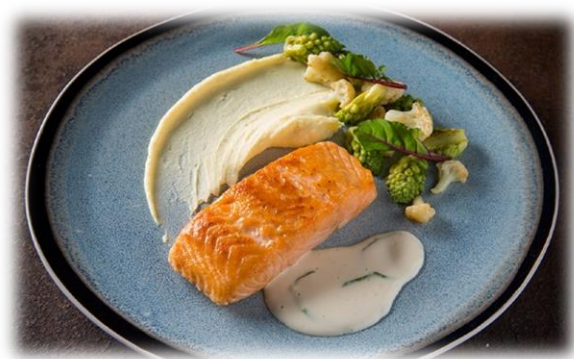
Filet de saumon 175 gr