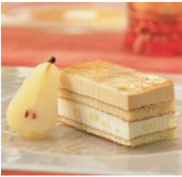
Longueur poire-caramel 700 gr