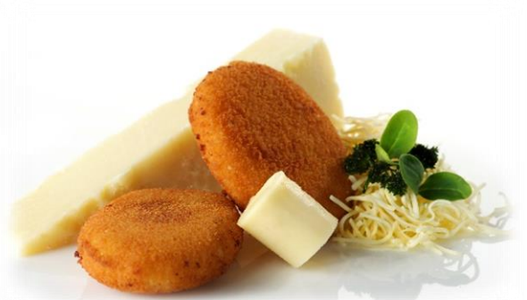
Croquettes aux 4 fromages 25x80gr