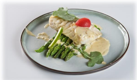
Coeurs de cabillaud 175 gr