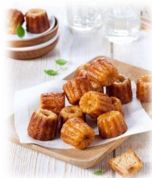
Mini cannelés salé Boncolac - 60 pc