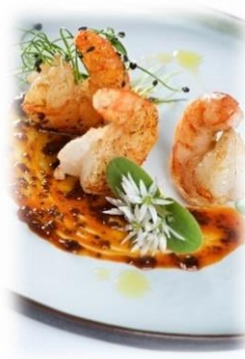
Scampis - 1 kg