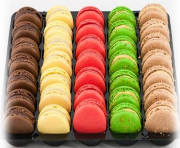
Assortiment de macarons 70x20gr