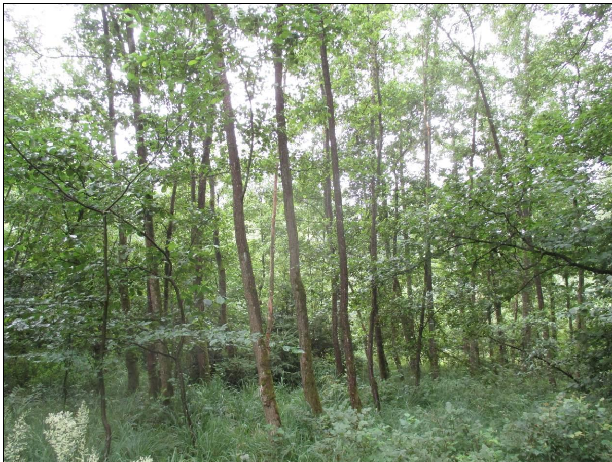
Abb. 3: Abschnitt des LRT 91E0* an einer bodennassen Stelle

Die Weichholzauwälder mit Erle, Esche und Weide nehmen eine Gesamtfläche von 1,00 ha (fast 6 % der Waldfläche bzw. knapp 37 % der Wald-Lebensraumtypenfläche im Gebiet) ein.