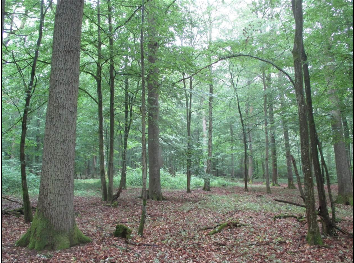
Abb. 2: Labkraut-Eichen-Hainbuchenwald im Urlesbachtal

Der Labkraut-Eichen-Hainbuchenwald nimmt eine Gesamtfläche von 1,72 ha (gut 10 % der Waldfläche bzw. gut 63 % der Wald-Lebensraumtypenfläche im Gebiet) ein.