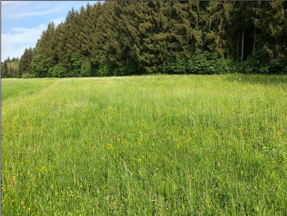
Magere Flachlandmähwiese an flach südexponiertem Hang