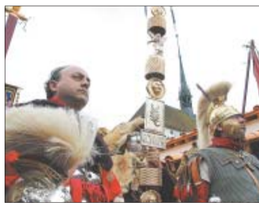
Bild von der Einweihung der Contubernia, den originalgetreu rekonstruierten Mannschaftsunterkünften. Im Legionärspfad-Herzstück können Schulklassen und Familien übernachten, da in die Rolle römischer Legionäre schlüpfen und das ehemalige Vindonissa auf Rundgängen hautnah entdecken (www.legionaerspfad.ch).

Um bestehende Synergien besser nutzen zu können und den Wirkungsgrad zu erhöhen, wird der Legionärspfad nach Abschluss der Startphase nun nicht mehr als eigenständiges Pilotprojekt geführt, sondern dem Museum Aargau angegliedert (es führt die Schlösser Lenzburg, Hallwyl und Habsburg sowie ab Januar 2011 auch das Schloss Wildegg; ebenso gehört das unmittelbar neben dem Legionärspfad gelegene ehemalige Kloster Königsfelden dazu). Geschichte am originalen Schauplatz vermitteln: Dies zählt zu den Kernkompetenzen des Museums Aargau. Was sich sich mit der Strategie des Legionärspfads deckt, der das Leben der Legionäre vor 2'000 Jahren im ehemaligen Vindonissa anschaulich präsentiert. Sämtliche übergeordnete Museumsdienste werden nun zentral geführt. Für den Legionärspfad bedeutet die Integration ins Museum Aargau, dass von den Mitarbeitenden die drei Arbeitsplätze in Marketing, Vermittlung und Kundendienst von Windisch nach anderen Standorten des Museums Aargau verlegt werden. Die Leitung des Legionärspfads übernimmt neu Thomas Pauli-Gabi, Direktor des Museums Aargau und Initiant des Legionärspfads.