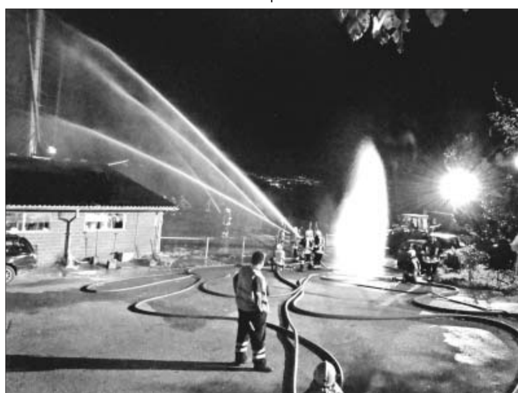
Sinnvolle Ernstfallübung bei der Siedlung Bläuer in der Chalchderen bei Linn.

Feuer bei Bläuer – Stützpunkt bitte kommen!