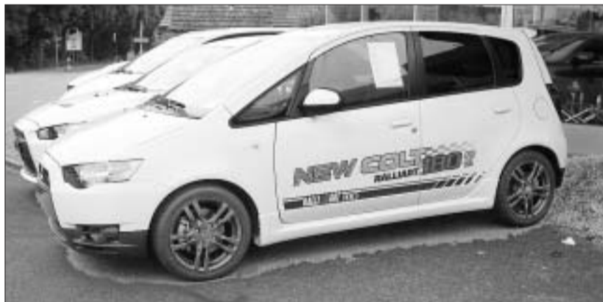
Links der Mitsubishi Lancer Ralliart, rechts der Colt Ralliart. Beide haben die typische Jet-Frontpartie und überzeugen mit kraftvollen Design-Linien.