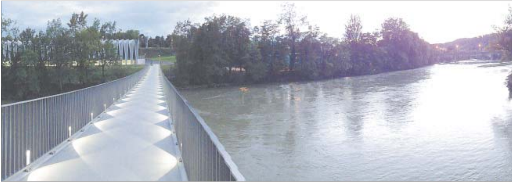
Beeindruckendes Brugger Brückenpanorama: Im Bild der nachts schön beleuchtete Aaresteg, der sich filigran über die Aare zu den neuen Mülimatt-Sporthallen schwingt, rechts die 1980 eröffnete Casino-Brücke und ganz hinten die namensgebende, auf die Römerzeit zurückgehende Aarequerung.