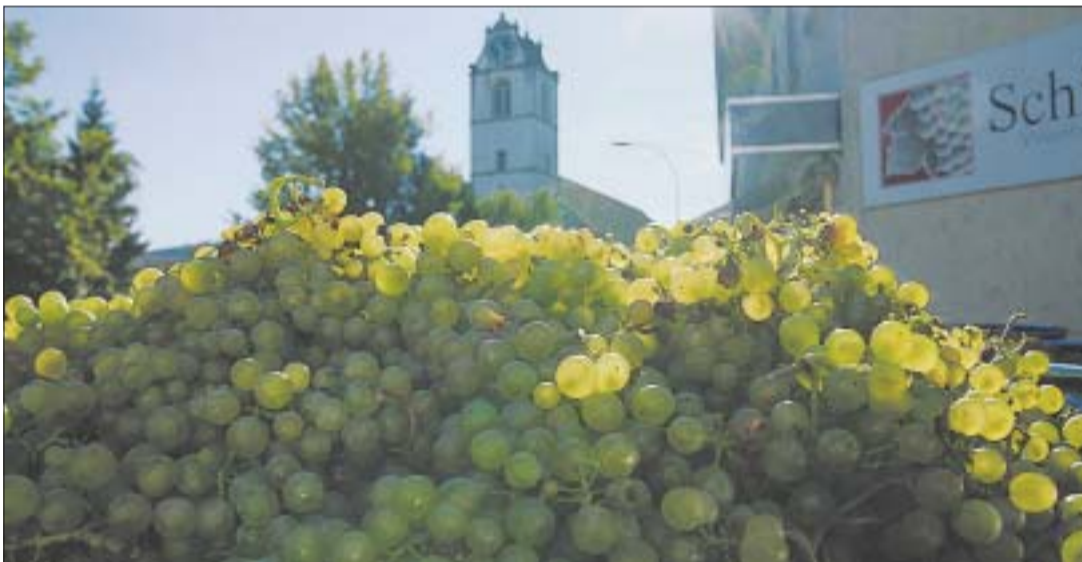
Letzte Woche und auch gestern wurden weisse Trauben in der Weinbaugenossenschaft Schinznach (WGS) entgegengenommen. Bereits seit dem Betttag ist das Tal mit weissem Sauser versorgt, jetzt haben ihn alle, die wollen, bekommen.