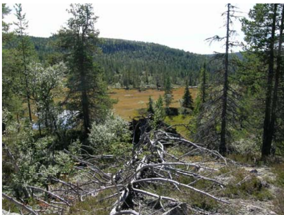
Fra Storsteinfjell.

Beliggenheten til de 10 områdene går fram av oversiktskartet. Det er et område i Aust-Agder fylke, 4 områder i Telemark fylke, 2 i Østfold fylke og 3 i Akershus fylke.