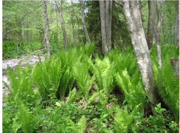
Fra Kjaglidalen.

De nye verneområdene sikrer arealer med betydelige verneverdier og bidrar til å oppfylle viktige mangler som "Evalueringen av skogvernet i Norge" påpeker. Mange av områdene har spesiell betydning for bevaringen av biologisk mangfold med et stort artsmangfold som også inkluderer mange truede og sårbare arter.