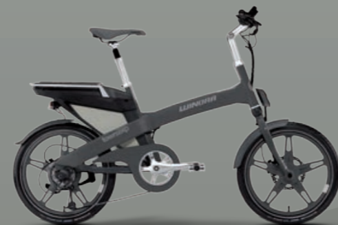
Farbvariante anthrazit matt

Rahmen/Frame Hochstabiler Monotube Aluminium 6061 Rahmen Antrieb/Motor TranzX MR05 HR-Nabenmotor/Rear Motor 36 Volt, 250 Watt Akku/Battery Lithium-Ionen, 36 Volt, 468 Wh Display LCD Multifunktionsdisplay DP-12 mit Bedienelement & Schiebehilfe/LCD Multifunctional display with operation unit & push-assistance Gabel/Fork JD-JF 6, Federweg/Travel: 35 mm Schaltung/Drivetrain Shimano Deore M591 9-Gang/Speed Bremsen/Brakes Tektro HDC300, hydraulische Scheibenbremse/Hydraulic disc brakes Farbe/Color lightgrey oder/ or anthrazit matt oder/or grey Rahmenhöhen/Size Uni 20" 44 cm