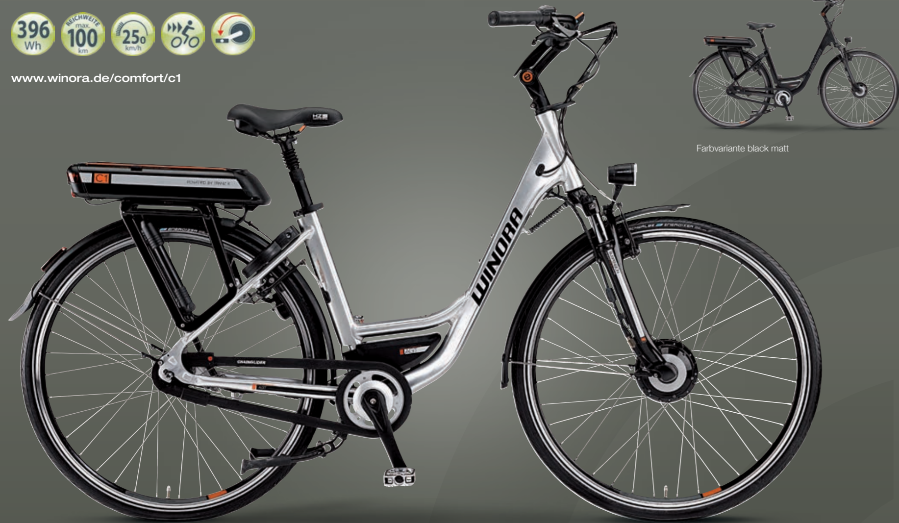
Farbvariante black matt