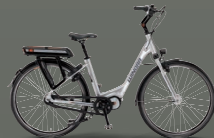
Farbvariante scotchbrite matt