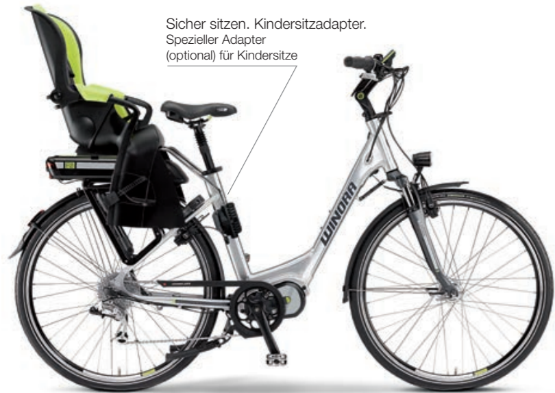
Sicher sitzen. Kindersitzadapter. Spezieller Adapter (optional) für Kindersitze