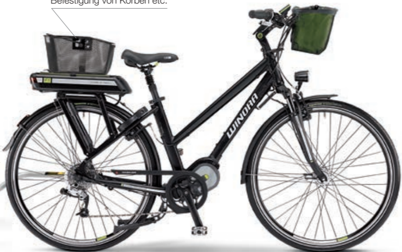
Einfach anklicken. Klicksystem für Körbe. Universeller Adapter zur sicheren und schnellen Befestigung von Körben etc.