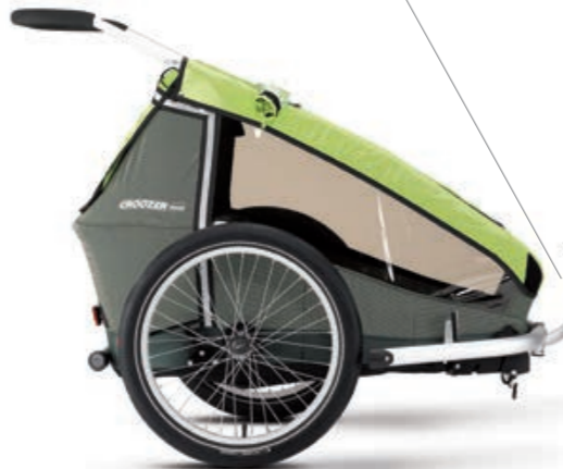
Sicher ist sicher. Fahrradkupplungsvorbereitung. Eine fest am Rahmen verschweißte Öse für die bewährte Weber-Fahrradkupplung