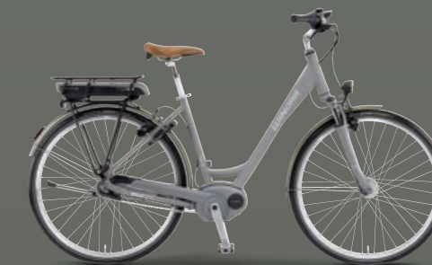
Farbvariante sand matt