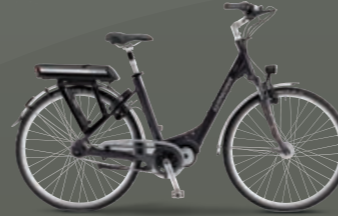
Farbvariante purple matt