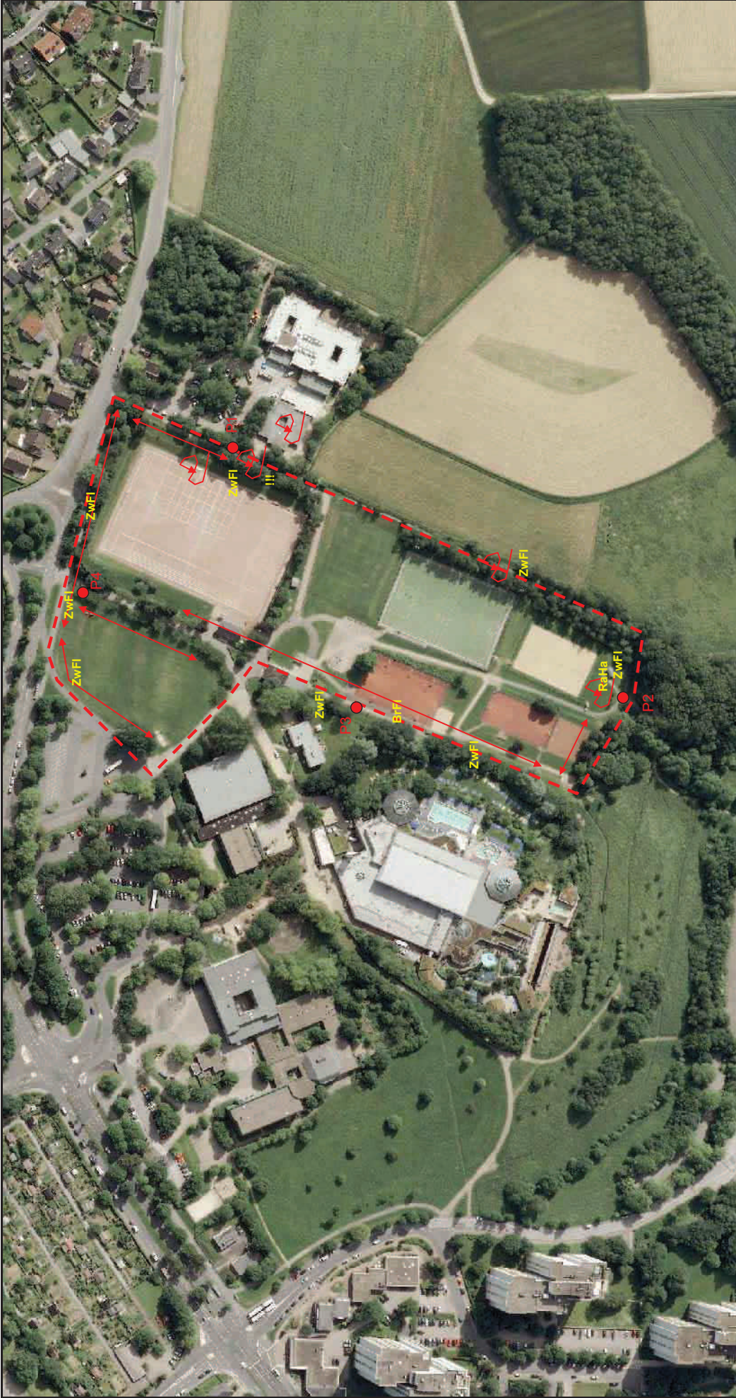
Luftbild : Beobachtungspositionen Fiedermausdetektorkartierung.