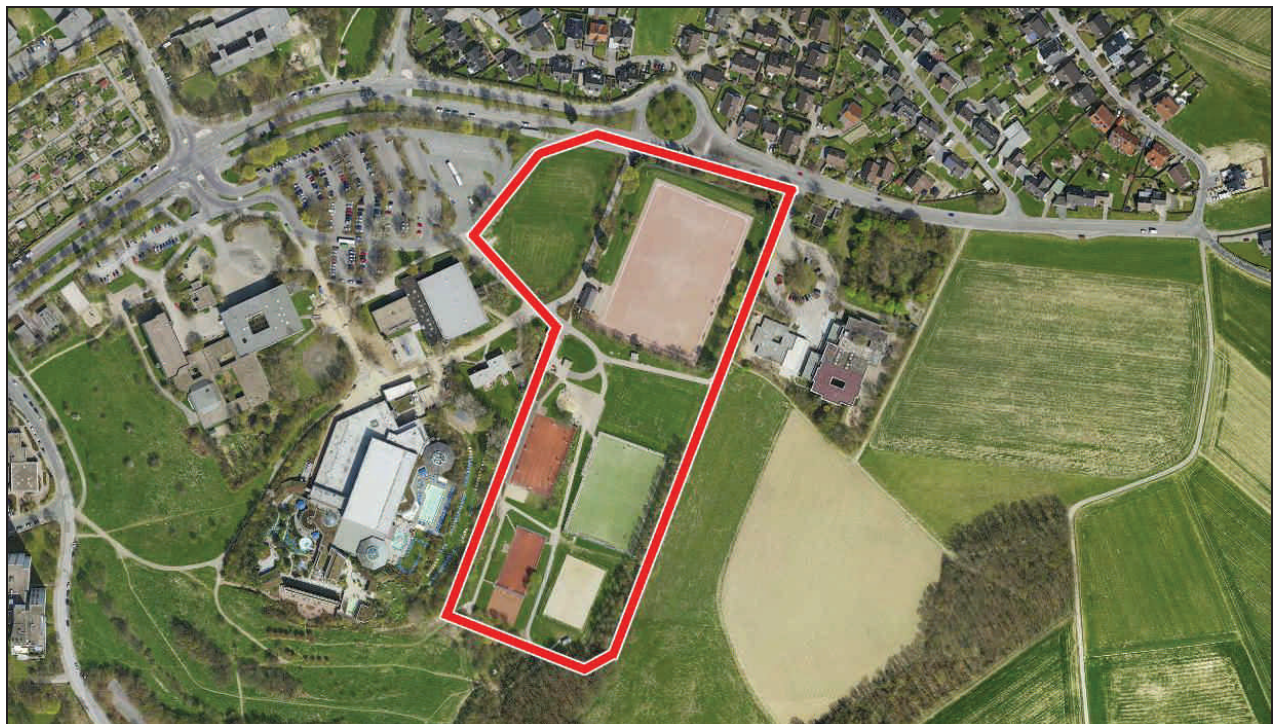
Abb. 2: Luftbild - Sportanlage Hackenberg mit Darstellung des Untersuchungsbereiches