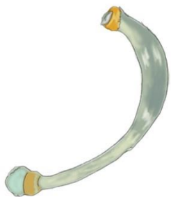
Chaetodermomorpha Pelseneer, 1906