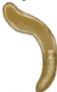
Solenogastres Pelseneer, 1878