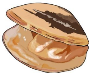
Bivalve Linnaeus, 1758