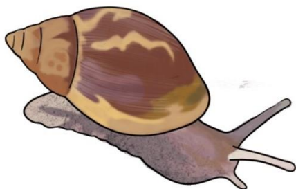
Monoplacophora Cuvier, 1795