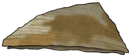
Monoplacophora Obhner, 1940