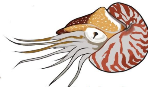
Cephalopoda Cuvier, 1797