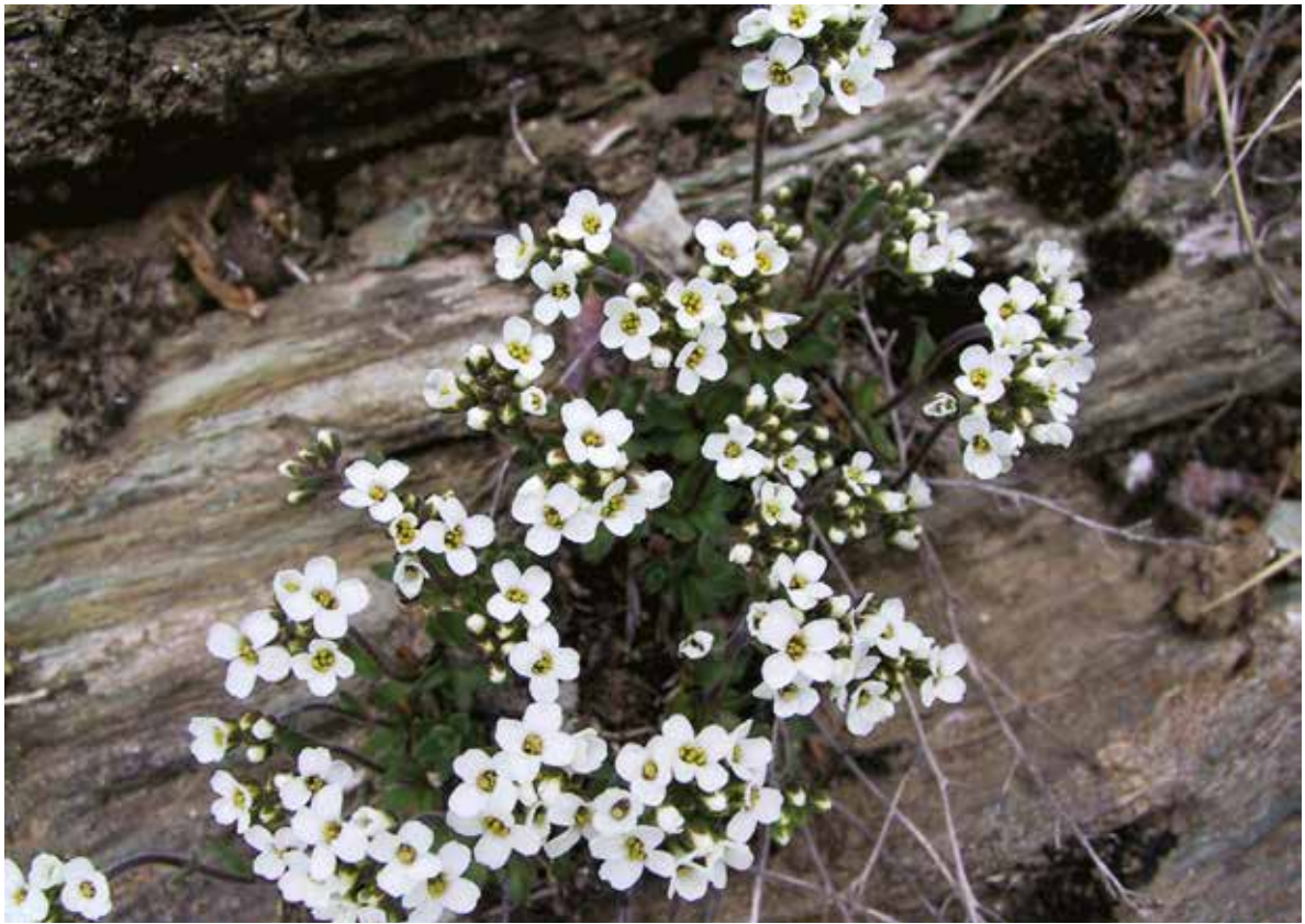
Слика 7. Draba dörfleri Wettst. ssp. longirostris , форма III. Дураки Figure 7. Draba dörfleri Wettst. ssp. longirostris , Photo: Š. Duraki

Polystichum aculeatum (L.) Roth ex Mert., Polystichum lonchitis (L.) Roth, Polystichum setiferum (Forssk.) Moore ex Woyt.