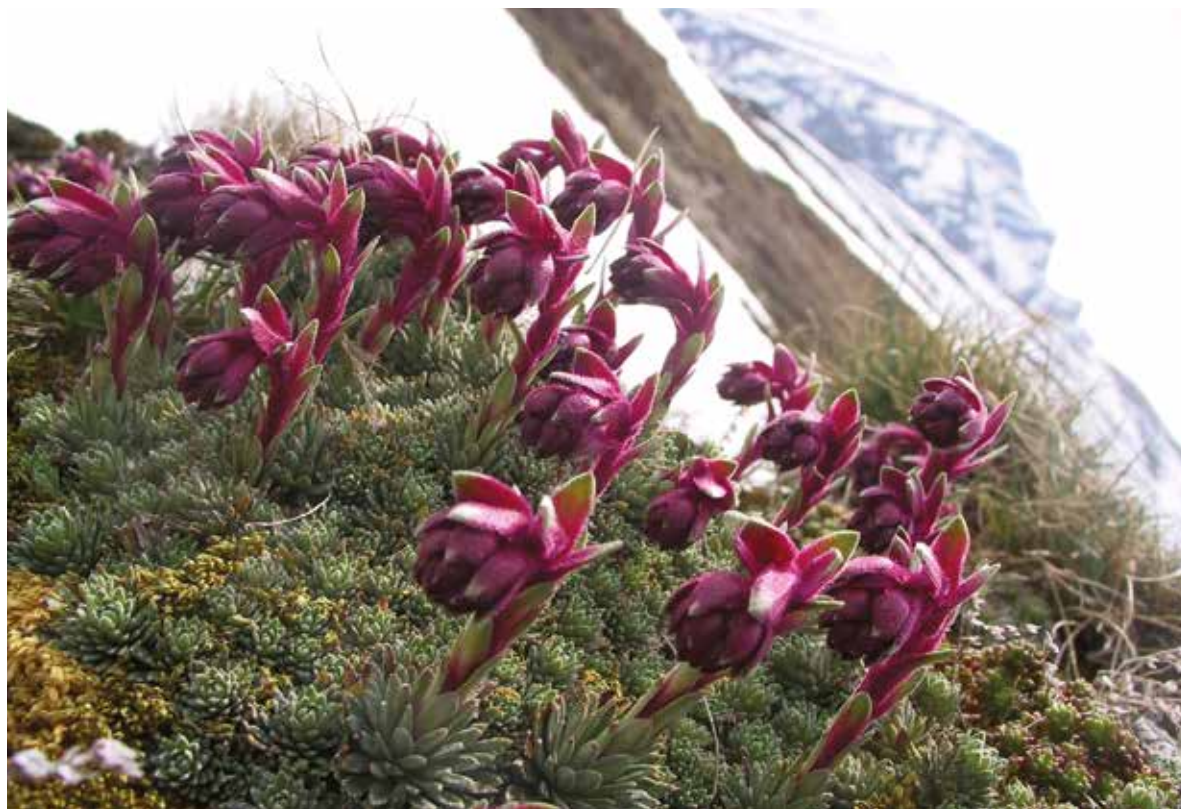
Слика 11. Saxifraga sempervivum C. Koch, фото: Ш. Дураки Figure 11. Saxifraga sempervivum C. Koch, Photo: Š. Duraki

pedemontana All. subsp. cymosa (W. K.) Engl., Saxifraga rotundifolia L. subsp. chrysosplenifolia (Boiss.) D. A. Webb., Saxifraga rotundifolia L. subsp. rotundifolia , Saxifraga scardica Griseb., Saxifraga sempervivum C. Koch (Сл. 11), Saxifraga taygetea Boiss., Heldr Saxifraga tridactylites L.