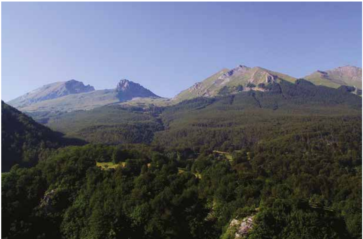
Слика 1. Кобилица Figure 1. Kobilica

Прва истраживања Кобилице која датирају од средине XIX века, указивала су да се ради о флористички интересантном делу Шар планине. И поред тога, гребен Кобилице остао је најмање ис-