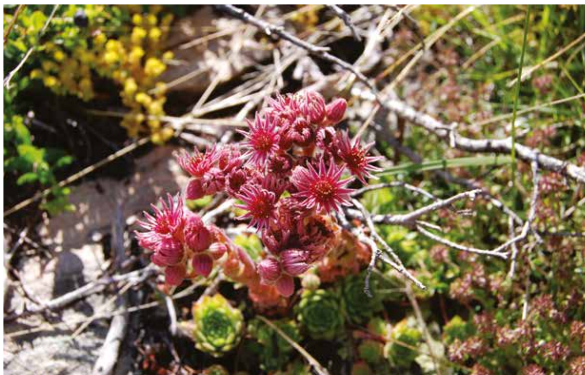
Слика 6. Sempervivum kosaninii Praeger, фото: Шемуја Дураки Figure 6. Sempervivum kosaninii Praeger, Photo: Šemija Duraki

saxatile (L.) Desv. subsp. orientalis (Ard.) Rech., Alysum scardicum Wetts., Arabis alpina L. subsp. alpina , Arabis collina Ten., Arabis glabra L., Arabis hirsuta (L.) Scop., Arabis procurrens Wald., Kit., Arabis sudetica Tausch. subsp. constricta (Griseb.) Nyman, Arabis turrita L., Aubrieta scardica (Wettst.) Gustav., Aurinia petraea (Ard.) Schur., Barbarea balcana Pančić, Barbarea bracteosa Guss., Barbarea stricta Andrž., Barbarea vulgaris R. Br., Berteroa incana (L.) DC., Capsella bursa-pastoris L. (Med.), Cardamine amara L. subsp. balkanica , Cardamine bulbifera (L.) Crantz, Cardamine enneaphyllos (L.) Crantz, Cardamine flexuosa With., Cardamine glauca Sprengel subsp. glauca , Cardamine graeca L., Cardamine hirsuta L., Cardamine impatiens L., Cardamine pratensis L. subsp. pratensis , Cardamine raphanifolia Pourret subsp. acris (Griseb.), Draba korabensis Knem., Deg var. hrubyi Rohl., Draba dörfleri Wettst. subsp. longirostris (Сл. 7), Draba kuemmerlei (Kumm., Jav.) V. Stevanović, D. Lakušić, Draba lasiocarpa Roch., Draba muralis L. Draba scardica Griseb. var. scardica Griseb., Draba siliquosa Bieb subsp. carinthiaca Hoppe, Erophila verna (L.) Chevall., Erophila verna (L.) Chevall subsp. praecox Stev., Erysimum cuspidatum (M.Bieb.) Reich, Kernera saxatilis (L.) Reichenb., Malcolmia serbica Ten., Ptilotrichum rupestre (Sweet) Boiss. subsp. scardicum , Roripa islandica (Oeder) Schinz, Sisymbrium orientale L., Sisymbrium