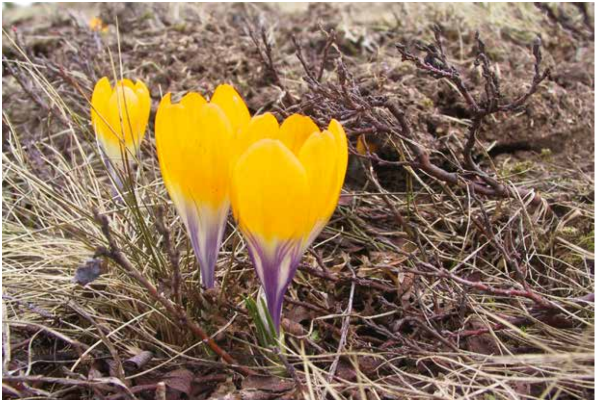
Слика 4. Crocus scardicus Кошанин, фото: Ш. Дураки Figure 4. Crocus scardicus Košanin, Photo: Š. Duraki

О значају и богатству флоре Кобилице говоре и подаци о угроженим врстама, односно о оним које имају национални и међународни значај. Тако је на овом подручју 178 врста биљака заштићено према Правилнику о проглашењу и заштити строго заштићених и заштићених дивљих врста биљака, животиња и гљива („Службени гласник РС“, бр. 5/2010, 47/2011, 32/2016 и 98/2016). Међу њима се налазе и међународно значајне врсте биљака на чију заштиту се примењују и одредбе европског законодавства. На „Прелиминарној листи угрожених таксона флоре Србије“ налази се 120 врста са овог подручја, а у првом тому „Црвене књиге флоре Србије 1“ (Стевановић, 1999) налазе се четири, у категорији крајње угрожених таксона ( Silene nicolicii (Seliger, T.Wraber) Stevanović, Niketić, Silene pusilla Walds., Kit subsp. candavica (Neum.)