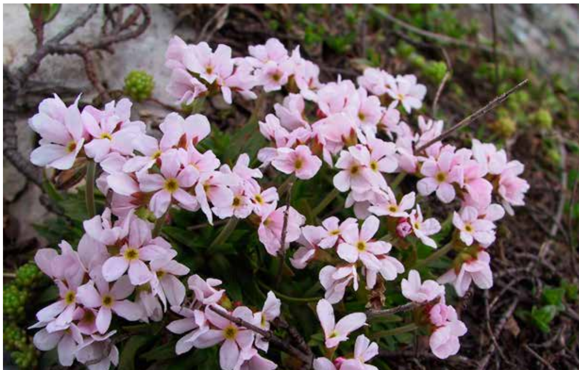
Слика 8. Androsace hedreantha Griseb, фото: Ш. Дураки Figure 8. Androsace hedreantha Griseb, Photo: Š. Duraki

(L.) R., Gymnadenia odoratissima (L.) L.C.M. Rich., Nigritella nigra (L.) Rchb., Orchis coriophora L., Orchis morio L. var. picta (Loiss.) A. et G., Orchis morio L., Orchis purpurea L., Pseudorchis friwaldii (Hampe ex Griseb) P. F. Hunt.