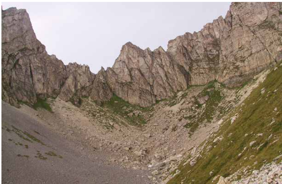
Слика 2. Кобилички цирк, фото: Ш. Дураки Figure 2. Cirque of Kobilica, Photo: Š. Duraki

траживан део шарпланинског масива, вероватно због своје неприступачности и суровости.