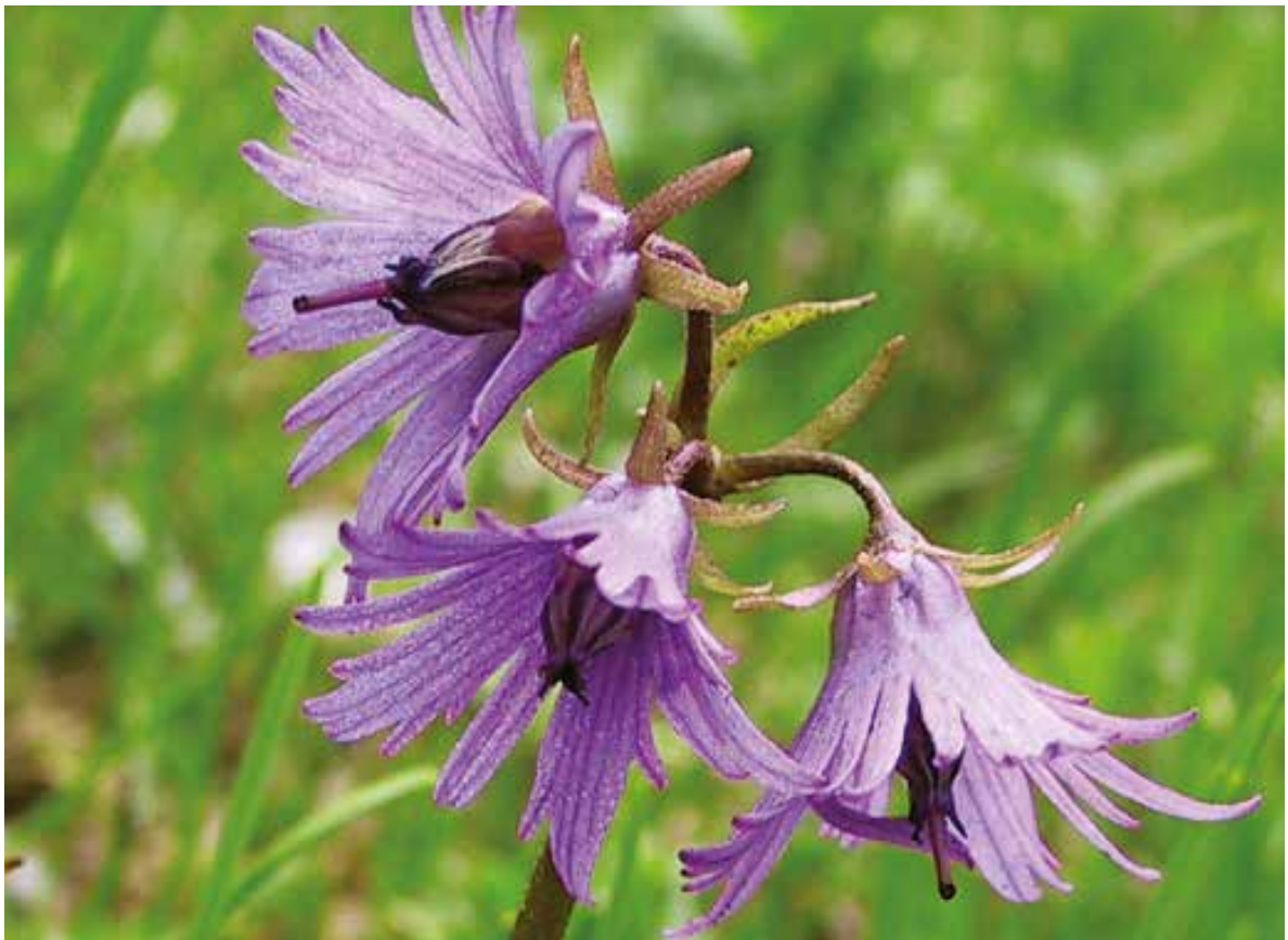
Слика 9. Soldanella pindicola Hausskn., фото: Ш. Дураку Figure 9. Soldanella pindicola Hausskn., Photo: Š. Duraki

fam. Rosaceae: Alchemilla bulgarica Rothm., Alchemilla colorata Buser var. ilyrica , Alchemilla flabellata Buser, Alchemilla heterophylla Rothm., Alchemilla heterotricha Rothm., Alchemilla monticola Opiz, Alchemilla nicans (Buser) Hay., Alchemilla plicatula Gand., Alchemilla pirinica Pawl., Alchemilla serbica Gand. (Fritsch) Pawl., Alchemilla straminea Buser, Aremonia agrimonioides (L.) Neck., Crategus monog-