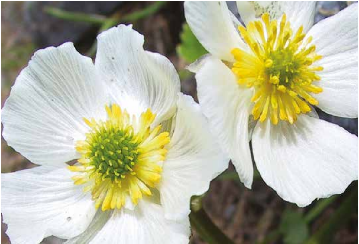
Слика 10. Ranunculus crenatus Waldst. et Kit, фото: Ш. Дураки Figure 10. Ranunculus crenatus Waldst. et Kit, Photo: Š. Duraki

yna Jacq., Cotoneaster integerrimus Medik., Cotoneaster tomentosa (Aiton) Lindl., Dryas octopetala L., Geum coccineum Sibth., Sm, Geum molle Vis., Pančić, Geum montanum L., Geum rivale L., Geum urbanum L., Fragaria vesca L., Malus sylvestris (L.) Mill., Potentilla argentea L. var. dissecta Wallr., Potentilla aurea L. subsp. aurea , Potentilla australis Krašan, Potentilla crantzii (Crantz) Beck, Potentilla detommasii Ten., Potentilla döerfleri Wettst., Potentilla erecta (L.) Raeusch., Potentilla inclinata Vill, Potentilla montenegrina Pant., Potentilla recta L. Potentilla speciosa Willd., Potentilla ternata K. Koch, Potentilla tommasiniana F.W. Schultz, Prunus mahaleb L., Prunus spinosa L., Rosa agrestis Savi, Rosa canina L. f. intercedens Heinr. Braun, Rosa gallica L, Rosa micrantha Borrer ex Sm, Rosa pendulina L, Rubus candicans Weihe ex Rchb., Rubus idaeus L., Rubus saxatilis L., Sanguisorba minor Scop. subsp. balearica (Bourgeau ex Nyman) Munoz Garmendia, C. Navarro, Sorbus aucuparia L.