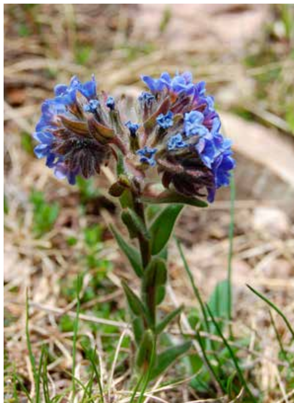
Слика 5. Alkanna scardica Gris, фото: Ш. Дураку Figure 5. Alkanna scardica Gris, Photo: Š. Duraki

fam. Caryophyllaceae: Arenaria biflora L., Arenaria rotundifolia M. B. var. pauciflora , Arenaria serpyllifolia L. var. alpina , Cerastium alpinum L., Cerastium alpinum L. var. glandulosum Hartman, Cerastium brachypetalum Desp. ex Pers., Cerastium cerastioides (L.) Britton, Cerastium decalvans Schlosser, Vuk., Cerastium eriophorum Kit., Cerastium fontanum Baumg. subsp. fontanum , Dianthus armeria L. subsp. armeriastrum (Wolfn.) Velen, Dianthus carthusianorum L., Dianthus cruentus Griseb. subsp. cruentus , Dianthus deltooides L., Dianthus integer Vis. subsp.