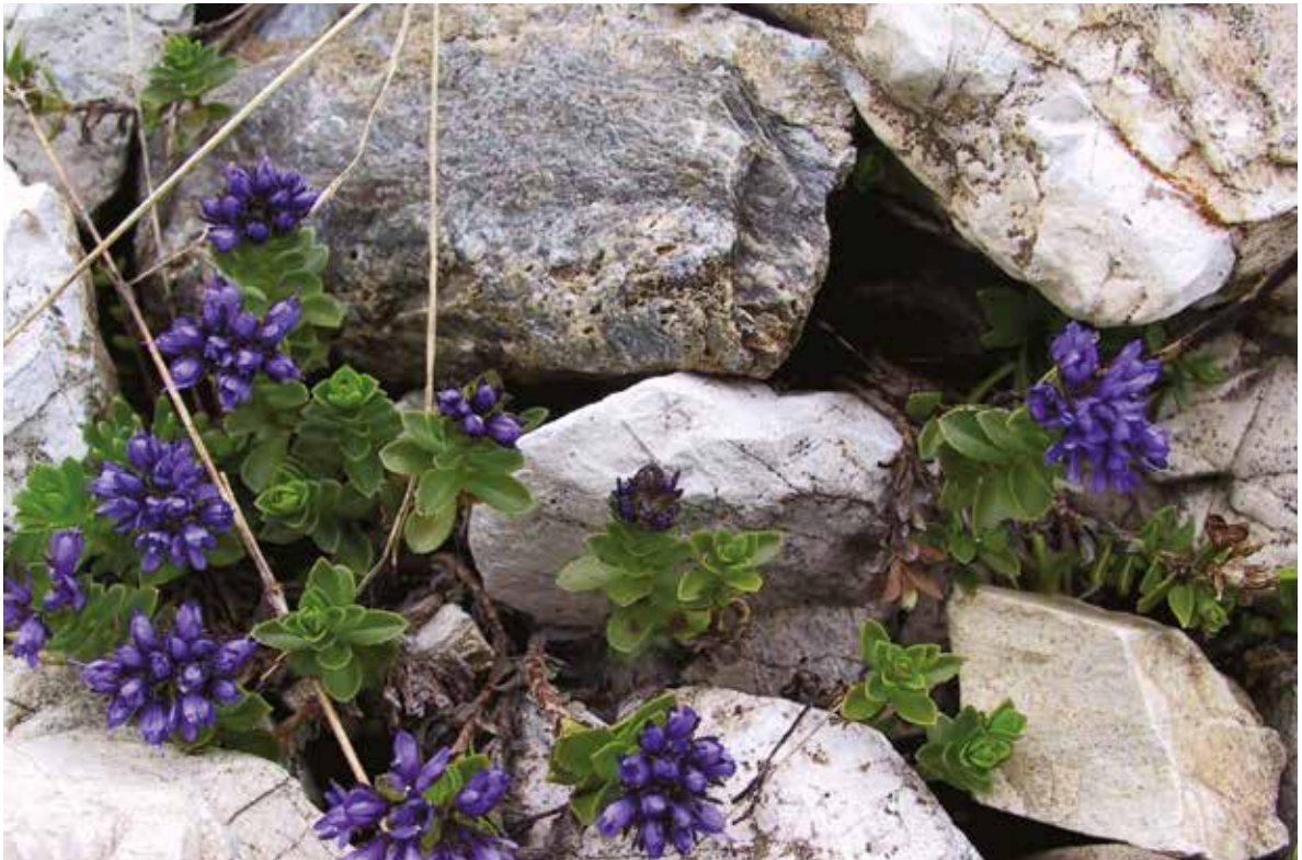
Слика 12. Veronica thessalica Bentham in DC., фото: Ш. Дураки Figure 12. Veronica thessalica Bentham in DC., Photo: S. Duraki

fam. Simarubaceae: Ailanthus altissima (Mill.) Swingle.