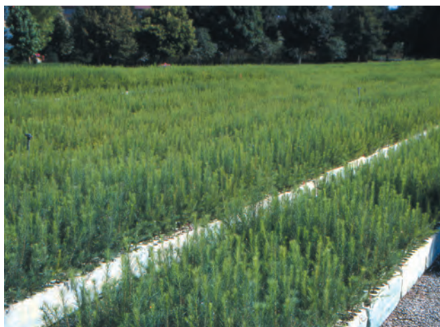
LARIX eurolepis élevés en GODET ROBIN ANTI-CHIGNON® R400. Âge 2+1. Un carré de culture sur notre site de Saint Laurent du Cros (05500). 1050m d'altitude.