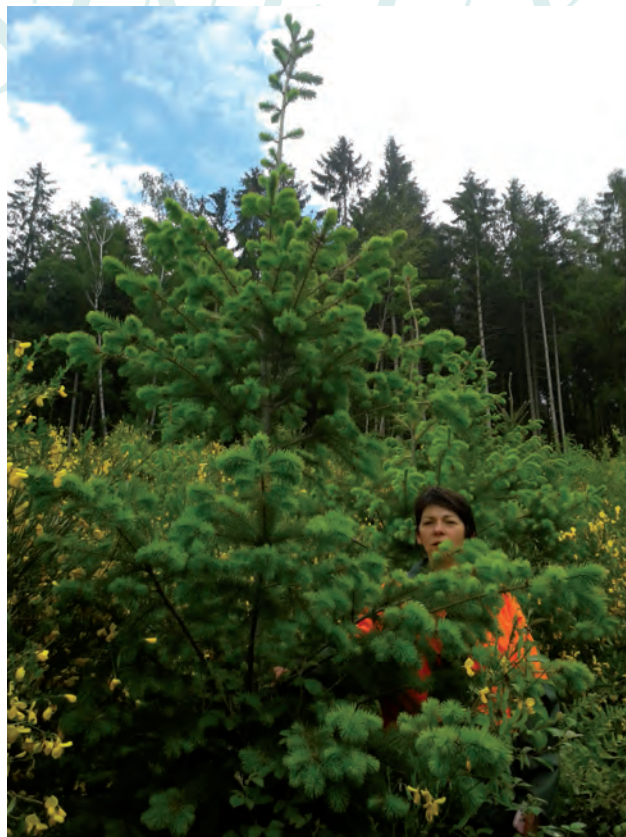
Photos mai 2014 cinq ans après plantation. Ils font en moyenne plus de 3m... ! Avec 1 seul dégagement ...