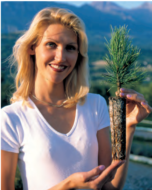
PINUS cembra élevé en GODET ROBIN ANTI-CHIGNON® R350/400.