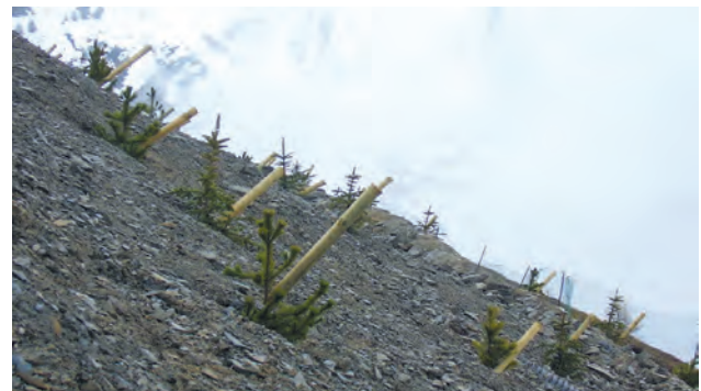
Plantation de végétaux suite au recalibrage d'une piste de ski pour la station de Valloire. Ce site présente une forte exigence paysagère du fait de l'accueil de touristes été comme hiver. L'environnement y est hostile de par la nature du sol mais aussi l'altitude. Il est important pour l'ONF d'avoir des végétaux adaptés à l'altitude de part le choix des essences PICEA pungens et PINUS cembra, mais aussi par l'acclimatation des végétaux. Sur ce site ont été plantés des végétaux en conteneur, cultivés aux Pépinières ROBIN sur le Site de Saint Laurent du Cros (05500), c'est à 1050m d'altitude. Le taux de reprise est proche de 100%. ONF Valloire – M. LOPEZ.