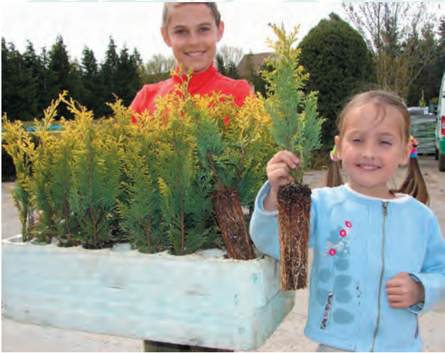
CHAMAECYPARIS lawsoniana « Stardust » 0+1+1 en GODET ROBIN ANTI-CHIGNON® R400cm³