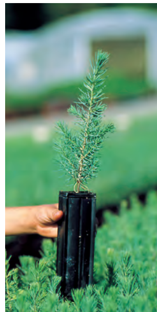
CEDRUS atlantica 1+0 élevé en GODET ROBIN ANTI-CHIGNON® R430.