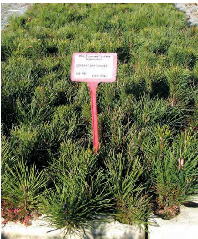
PINUS uncinata mycorhizés avec Laccaria bicolor HAUTE PERFORMANCE®. Age 2+0. Contrat de culture pour l'ONF de Tarbes (65).