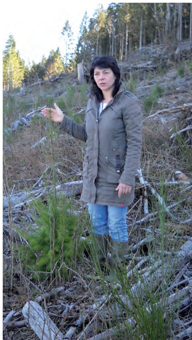
Photo mars 2011, deux ans après plantation.