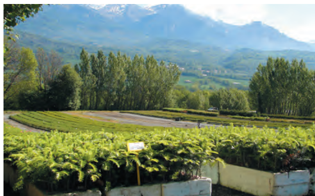
ABIES alba élevés en GODET ROBIN ANTI-CHIGNON® R400. Âge 3+1. Un carré de culture sur notre site de Saint Laurent du Cros (05500). Altitude 1050m.