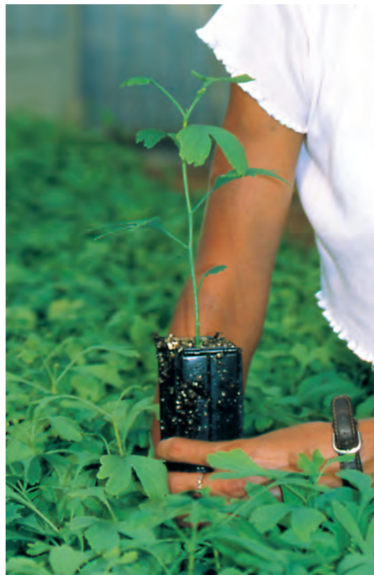
GINKGO biloba âgé de trois mois en GODET ROBIN ANTI-CHIGNON® R430.