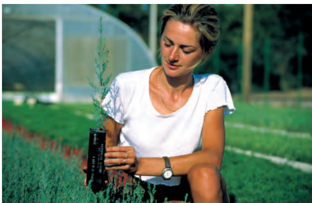
CUPRESSUS sempervirens 1+0 élevé en godet ROBIN ANTI-CHIGNON® R430.