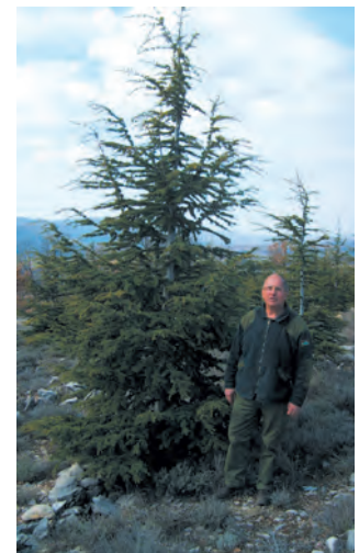
CEDRUS atlantica élevés en GODET ROBIN ANTI-CHIGNON® R430. Photo 12 ans après plantation. Hauteur des arbres 5 à 7 m. Chantier ONF Forcalquier (04). M. Brocheny.