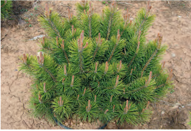
PINUS mugo mughus élevé en GODET ROBIN ANTI-CHIGNON® R400®. Hauteur 12/+ cm à la plantation. Photo 5 ans après plantation : Hauteur 60 cm.