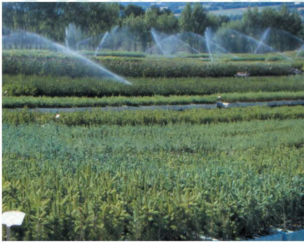
PICEA excelsa élevés en GODET ROBIN ANTI-CHIGNON® R400, âge 3+1. Un carré de culture sur notre site de Saint Laurent du Cros. 1050m d'altitude.