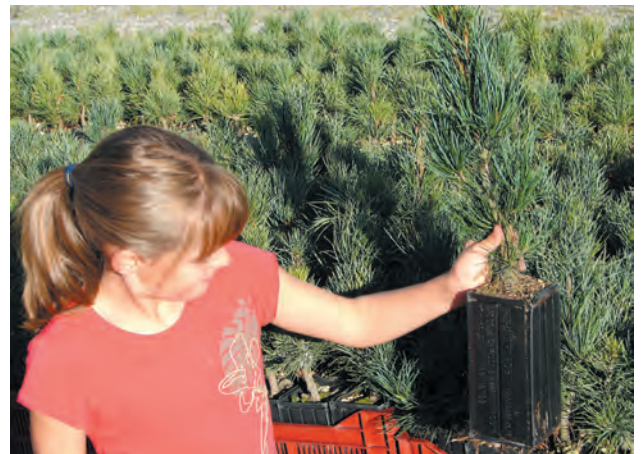
PINUS cembra élevés en GODET ROBIN ANTI-CHIGNON® R1,5Litres. Âge 3+2+1