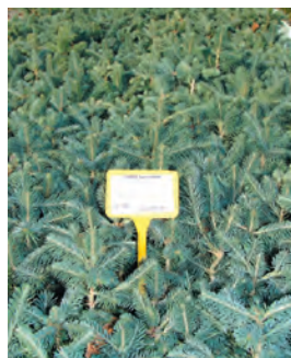
ABIES lasiocarpa élevé en GODET ROBIN ANTI-CHIGNON® R400. Âge 2+1.

A la plantation, la protection apportée par l'ambiance forestière ne paraît pas absolument indispensable pour cette espèce qui est intéressante pour les reboisements en altitude: subalpin et montagnard supérieur. Chaleur et sécheresse lui sont très défavorables, mais l'Abies lasiocarpa n'est pas sensible aux gelées tardives. Intéressant pour la production de sapin de Noël.