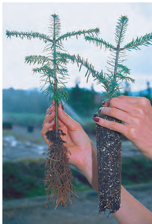
ABIES alba 3+1 élevé en GODET ROBIN ANTI-CHIGNON® R350, à gauche motte défaits pour montrer le chevelu racinaire.