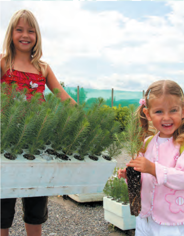
PINUS Pinaster 1+0 élevé en GODET ROBIN ANTI-CHIGNON ® R300 cm 3 . 53 Plants par caisse très facile à manipuler.