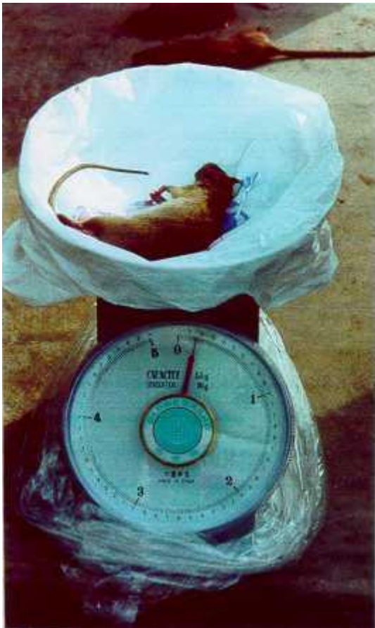
Pesaje de roedores