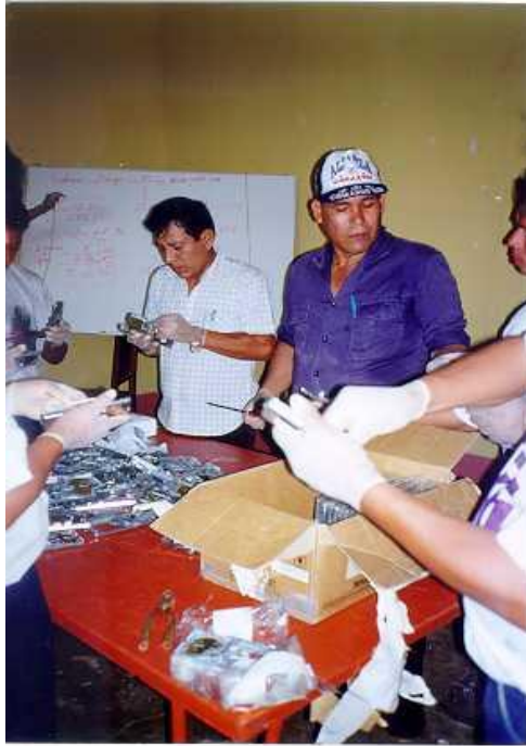
Preparación de trampas