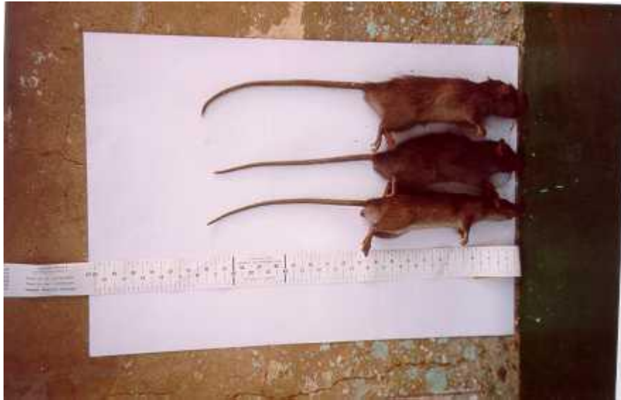
Medición de roedores capturados