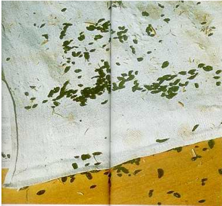
Heces de roedores