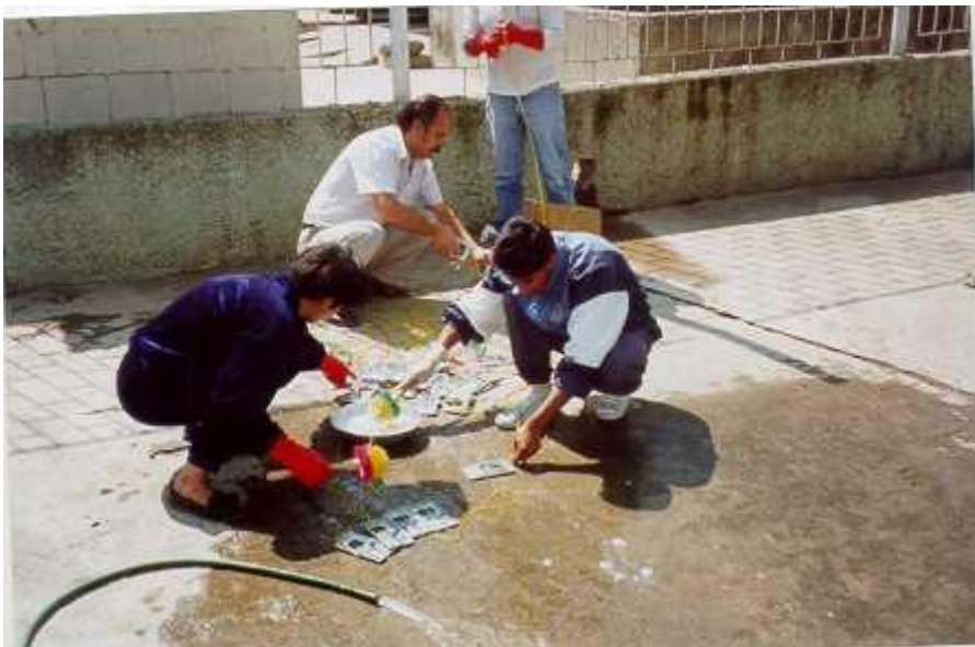
Lavado de trampas