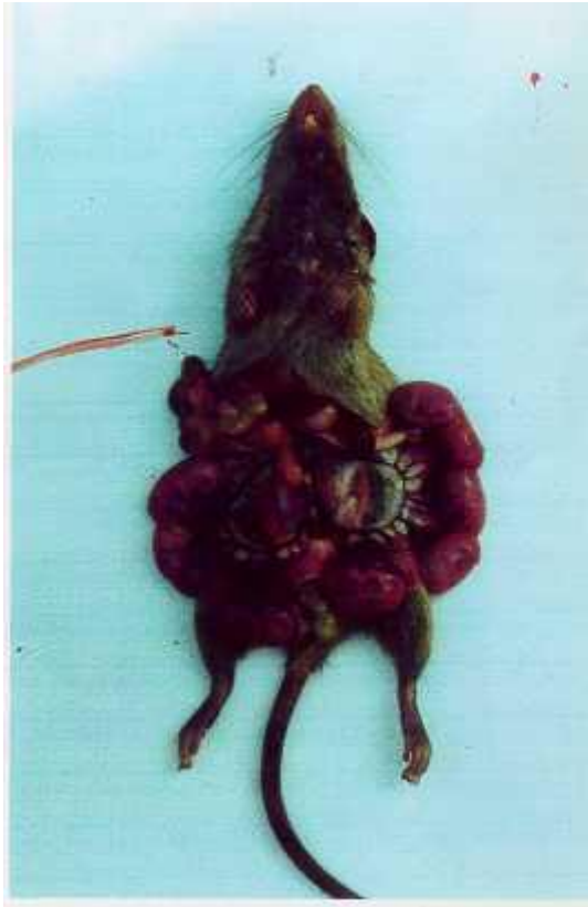
Necropsia de roedores