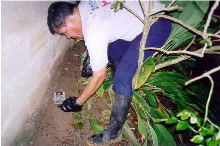
Colocación de trampas de guillotina