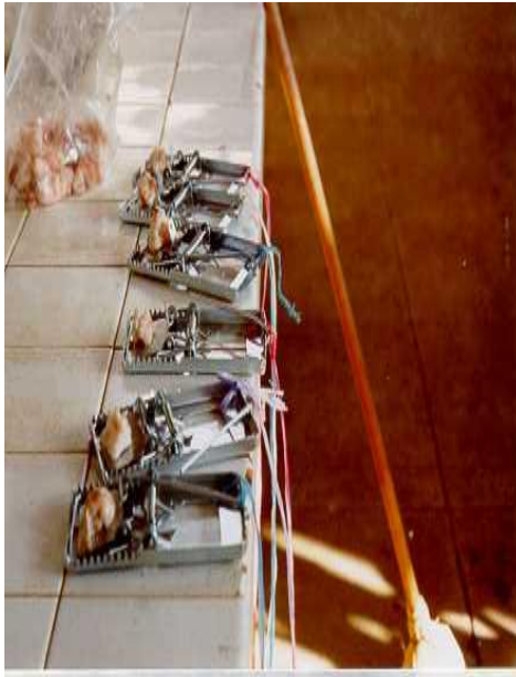
Trampas con cebo