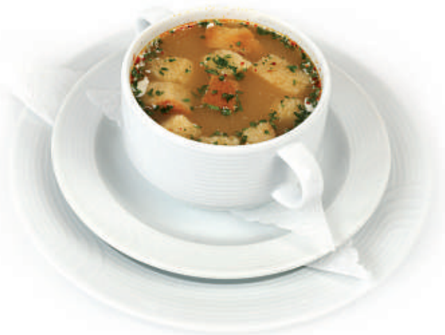
154 Sopa Criolla 13.50 Pikante Bouillon mit Fleischeinlage