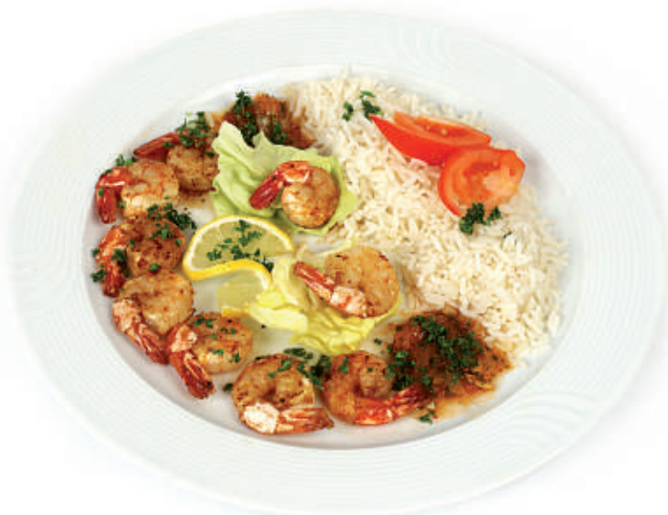
159 Riesencrevetten Chorrillana 42.50 gedämpft in Weisswein an rassisger Indio-Sauce aus grob geschnittenen Zwiebeln und Tomaten, serviert mit Trockenreis