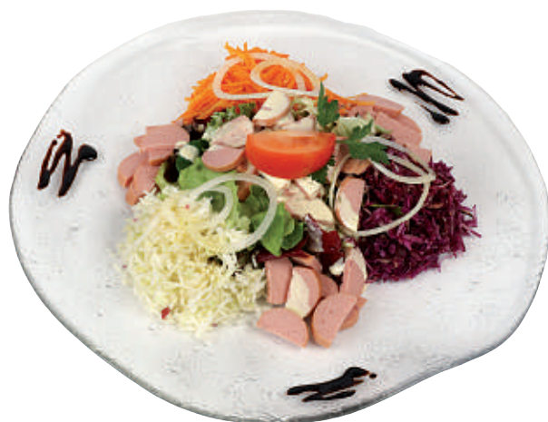
113 Wurst-Salat 24.50