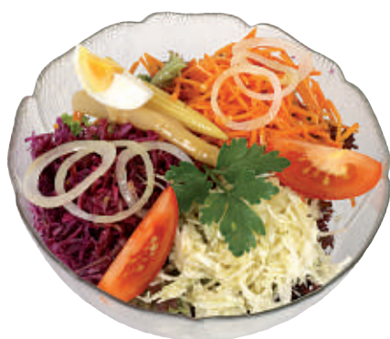
111 Gemischter Salat 10.50 aus der Schüssel