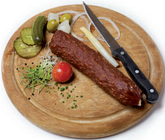
122 Hexenwurst 15.50 Rauchwurst garniert mit Brot