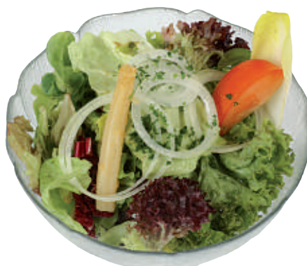
112 Grüner Salat 9.50 aus der Schüssel