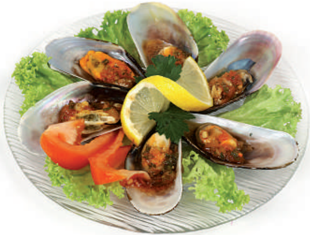
156 Chorros a la Criolla 16.50 6 Miesmuscheln in Schale, kalt serviert und gefüllt mit rassisger Vinaigrettesauce