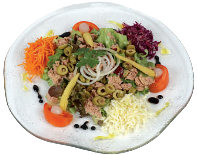
121 Chefsalat 25.50 mit Thon und Oliven