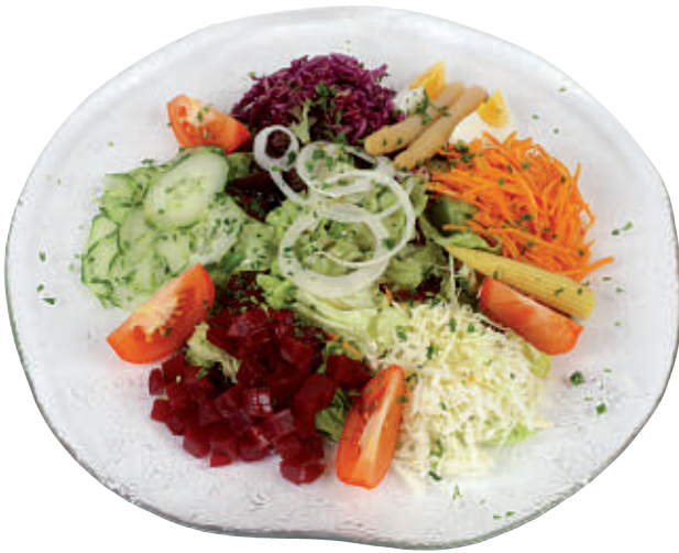
120 Salatteller 24.50