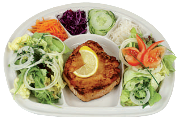
125 Fitness-Teller 31.50 grilliertes Schweins-Steak (160 gr) mit Salatgarnitur