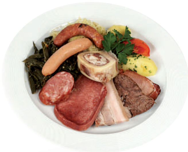
381 Berner Teller 32.50 Fünf Sorten Fleisch, Markbein, Sauerkraut, Dörrbohnen, Salzkartoffeln und Senf