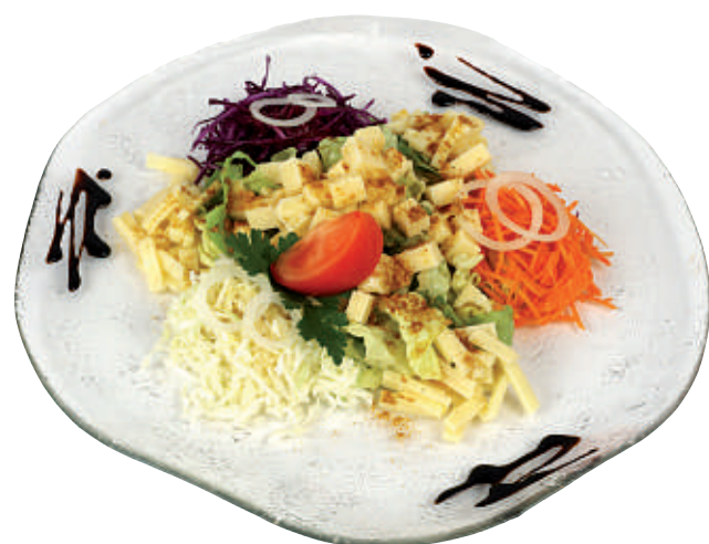
114 Käse-Salat 25.50 4 Sorten Käse