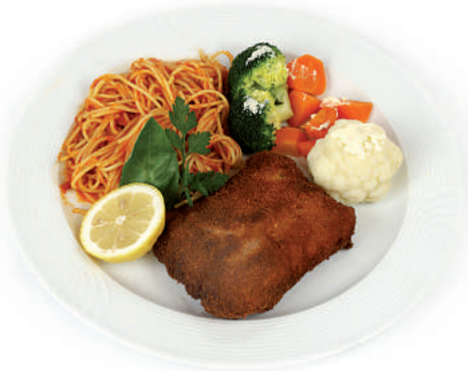
373 Schweins-Cordon-Bleu 33.50 mit drei Sorten Gemüse und Spaghetti Napoli