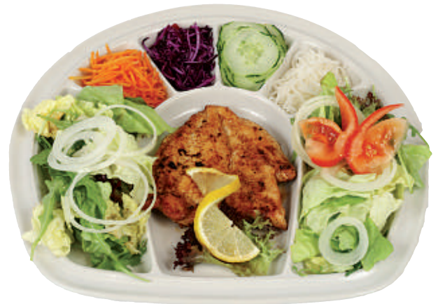
123 Fitness-Teller 29.50 grilliertes Pouletschnitzel mit Salatgarnitur