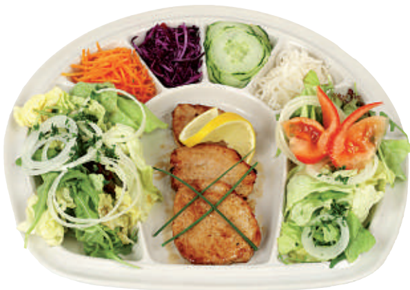
124 Fitness-Teller 33.50 grillierte Kalbsschnitzel (120 gr) mit Salatgarnitur