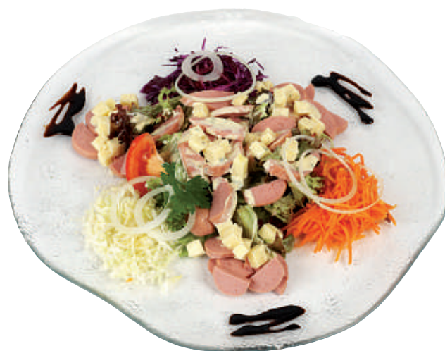
115 Wurst-Käse-Salat 26.50