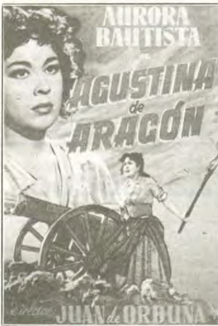
«Lo aragonés ha llegado a ser en los últimos lustros un mero epifenómeno de lo español.

Otro argumento, paradójico, que se esgrime es el de la «simpatía», cuando no el del franco «afecto» por las hablas del Alto Aragón que es compatible para algunos con la repugnancia en comparar bajo el mismo rasero de lenguas