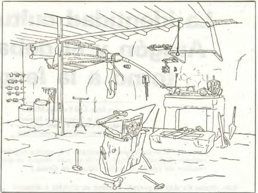
Dibujo de Julio Alvar.

Sin embargo, el cambio de las circunstancias políticas en España y, muy especialmente, el proceso de autogobierno y de autonomía política, han servido de espoleta para la conciencia lingüística y cultural de los habitantes del Alto Aragón. De la alienación se ha pasado a una euforia, bien palpable para el viajero menos atento, volviendo las ha-