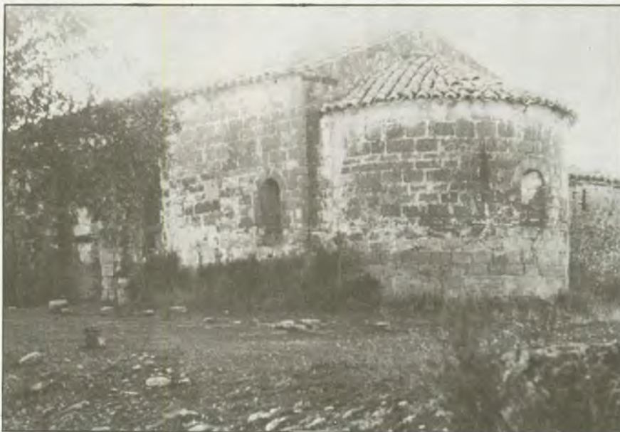
Ermita de Bascués, vista Este.

Las razones que nos han impulsado a elaborar la presente memoria no son otras que el anonimato en que sigue esta interesante, antigua y despoblada villa, y lo que es peor, el progresivo abandono que la invade. De tal forma que si no se produce ninguna actuación a corto plazo, de Bascués no nos va a quedar más que un topónimo y algunos datos testimoniales. Esto ha ocurrido ya con un gran número de pueblos altoaragoneses que lo fueron y de los que apenas guardamos memoria un grupo de locos interesados por nuestro pasado.