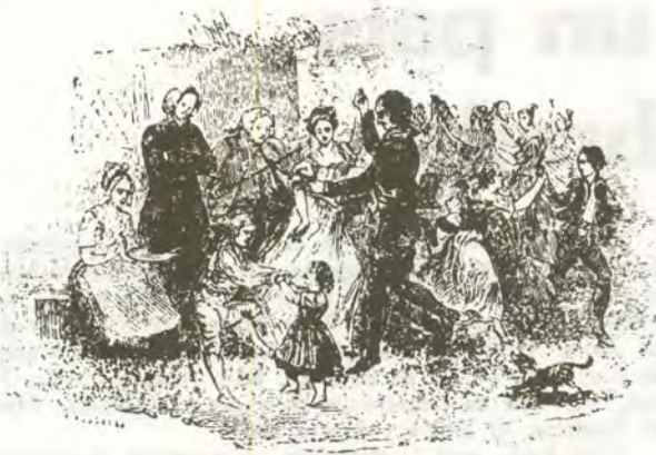
...los viejos no pegaban ojo imaginando bacanales...

pero la gota que colmó el vaso no vino de las nuevas inquilinas, sino del señor Matías, de su inoportuna lascivia, de su Lola celosa, de su imprevisión. la Lola venía de lavarse con las zapatillas en la mano cuando vio, a través de la ventana de su dormitorio, cómo en la ventana iluminada de enfrente, una joven se sacaba una camiseta por la cabeza dejando al aire una hermosa espalda sin sostén. la Lola venía de lavarse con las zapatillas en la mano cuando vio, a este lado de la ventana de su dormitorio, cómo Matías, emboscado entre los visillos, examinaba a conciencia la hermosa espalda sin sostén. la espalda de la Lola era una curva mullida cargada de hijos, excesos de pan y trabajos serviles, situación que descartaba cualquier conato de competición física y la obligaba a lucir sus aptitudes de estrategia moro.