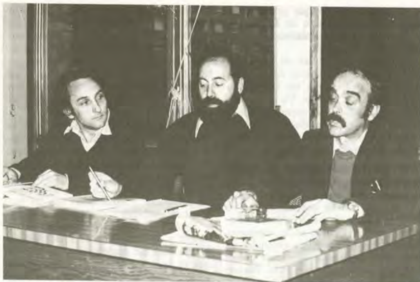
Con Vicente Cazarra y José Antonio Labordeta presentando su libro «El hombre amigo mundo».

Hay otras reuniones como las que celebran en Zaragoza los «Ciudadanos Hartos», que son verdaderamente interesantes. Además, da gusto saber que acude a ellas mucha más gente que la que se reúne en la mayor sesión convocada por un partido político, aunque se trate de partidos que estén repartiéndose puestos o que estén en el poder. Y en esas reuniones se hacen declaraciones como la de considerar «zona catastrófica» el despacho del alcalde de Zaragoza, y otras igual de relevantes que pueden ser de impacto para que la gente se dé cuenta de las cosas y diga: «algo está pasando aquí». Porque se está actuando muchas veces dentro de la democracia como si estuviésemos en una dictadura, igual que en los países latinoamericanos, que son dictaduras con elecciones. Hay señores que han entrado democráticamente en el poder pero que hacen de él uso y abuso: ésta es la dictadura democrática, en la cual los ciudadanos no importan.