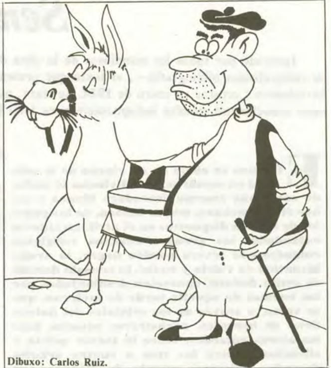
Dibuxo: Carlos Ruiz.

Reping3ndose un poqu3r y con boz de l'atro mundo l'espeta: