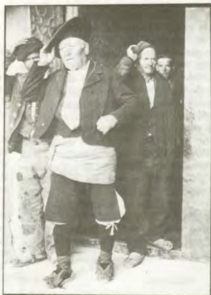
Boleya. Saliendo de misa. 1935.

El caso de las hablas aragonesas de los altos valles pirenaicos, del Prepirineo y de los somontanos de Huesca y de Barbastro son un buen ejemplo de la capacidad de persistencia de la cultura popular aragonesa. Si ello ha sido posible, a lo largo de siglos, es porque en unas zonas eminentemente rurales la tradición se transmitía por vía oral, siendo las propias hablas su vehículo casi exclusivo. Sin embargo, este proceso se transforma drásticamente en lo que va de siglo. El Alto Aragón, y muy especialmente la zona pirenaica y prepirenaica, sale de su secular aislamien-