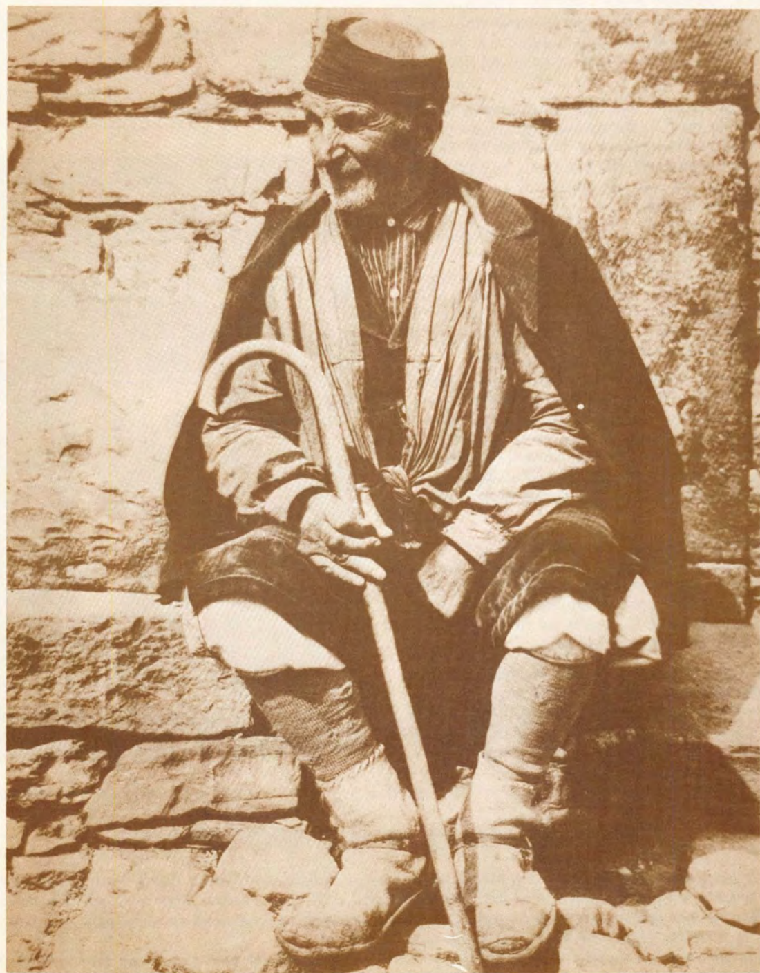
Torla. El más viejo. Foto: Ricardo Compairé Escartín (1936).

Año noveno — Número 31-32 — Octubre-Diciembre 1985 — 150 ptas.