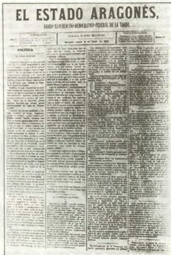
«El Estado Aragonés» asumió posiciones anticantoniales.