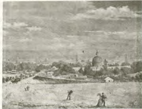
Vista de Zaragoza desde el Puente de América. 1877.

Nuestro conocimiento del cantón aragonés es todavía muy insuficiente. Hasta ahora, casi ignorado por la historiografía, será necesario en lo sucesivo profundizar en su estudio, en la ideología de quienes lo proclamaron y en las causas sociales que permitieron su surgimiento.