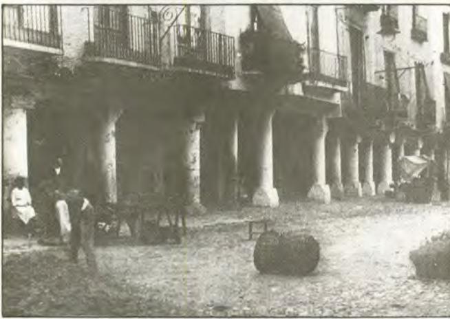
Barbastro en 1920.

Disponemos de algunas noticias sueltas sobre la proclamación del cantón en otros puntos de Aragón. A fines de agosto ondeaba en Aniñón la bandera republicana federal, blanca y roja (28). En el Bajo Aragón, según afirmación de J. R. Villanueva, «el cantonalismo bajoaragonés parece que también se levantó contra el gobierno central, ya que recientes datos aparecidos nos indican que los cantonales (republicanos intransigentes) intentaron hacerse con la ciudad de Alcañiz en el mes de julio, a la vez que en la zona de Andorra se levanta alguna partida federal» (29). Hemos recogido también la afirmación de un intento de constituir el cantón en Ateca y el alzamiento efectivo de Monzón (30).