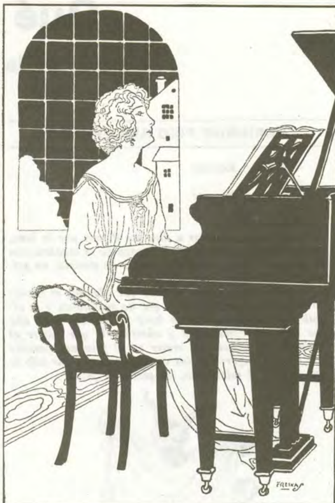
«Dejándose suavemente acariciar por las sombras, no quiso encender la luz.»

Siguió tocando. Terminó el adagio con una frase sombría, una frase cualquiera indesifrable: el dolor sufriendose a sí mismo en la obscuridad sin cielos ni horizontes de un corazón. Después vino el alegreto: «Una flor entre dos abismos», que dijo Listz.