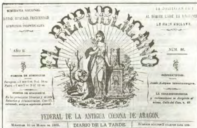
«El Republicano», dirigido por López Montenegro.

Habíamos dicho que al otorgar su confianza al Gobierno, la Asamblea Constituyente, todo lo previsto para la proclamación de la República Federal se fue abajo. Los miembros de «La Autonomía de Zaragoza» quedaron descontentos con el nuevo curso de los acontecimientos y se dispusieron a proclamar la República Federal, aunque no contasen para ello con el apoyo del Partido Republicano Democrático Federal.