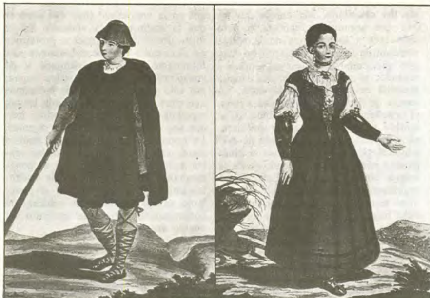
Cheso sobre 1722.