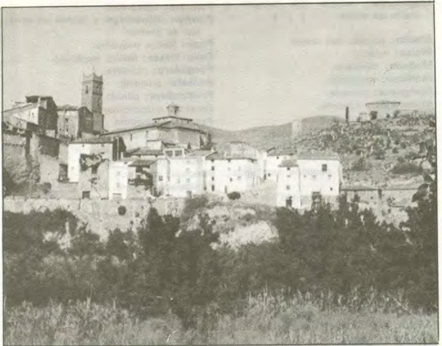
Obón, vista parcial.

Escarrar: acción de abrirse de piernas. Escaparrar: a escaparrar significa a freír churros, mandar a. Escape: a escape, enseguida, a toda velocidad. Escarriñar: escarbar en las brasas. Escarrizar: quitar las hojas de las panochas del maíz. Escomida: desgastada. Escond cucas: juego infantil. Escoscao: limpio. Escorquitar: desgranar las judías, las cebollas, las nueces, etc. Escoscar: quitar la piel verde de las nueces o almendras. También: limpiar. Esculla: escudilla. Esfollinar: desfollinar. Esgarrar: desgarrar. Esglafar: romper los huevos. Esgellufar: quitar las primeras hojas de la flor del azafrán. Esgatiñar: se va a, se va a reventar de llorar. Eslavada: lavada. Eslizón: resbalón. Espadil: parte del cerdo o en general de todo animal. Espedregar: despedregar. Espendolao: corriendo alocado. Espinayes: espinacas. Espirigallo: planta, el pipirigallo. Espolsar: sacudir. Esquiciar: desquiciar. Estabillar: desgranar. Estajar: dividir un rebaño. Estalentao: alocado. Estozolarse: pegarse un tozolón, un buen golpe. Estraciar: trocear. Estral, estraleta: hacha. Estraudes: estrudes, trébedes. Entrecolao: desaparecido. Estrenochar: trasnochar. Estrepuñar: lavar a puño.