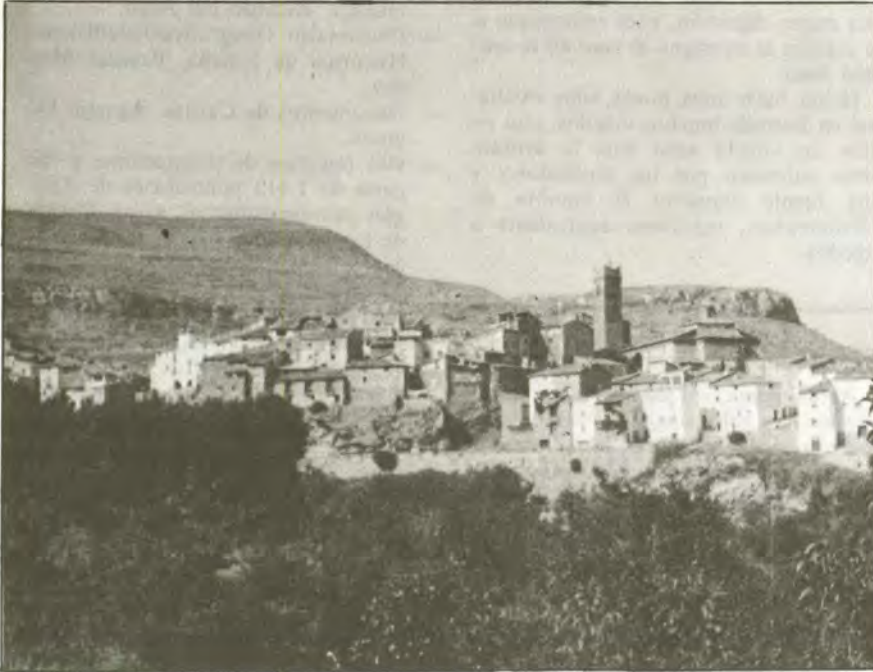
Obón, vista general.

La publicación en números anteriores de ROLDE de trabajos sobre el aragonés residual de Bello (Teruel), Baltorres (Zaragoza), Naval y La Puebla de Fantova (Huesca), me anima a dar a conocer aquí una colección de voces, hoy en uso, recogidas en la localidad de Obón (Teruel) situada en la cuenca media del río Martín, entre Oliete y Montalbán. En su día también se publicaron unos estudios sobre las localidades de Las Cuevas de Cañart (Teruel) y Moyuela (Zaragoza) (Archivo de Filología Aragonesa, 3 y 18/19). Curiosamente, si trazáramos una línea que uniera estos dos pueblos, esta línea pasaría por el término de Obón, situado equidistante. Al dar a conocer estas voces peculiares de Obón pensamos que ayudamos a rellenar el mapa del aragonés parlante de una nueva comarca turolense, mientras preparamos para un próximo trabajo las voces de Estercuel, Alcorisa y Alloza.