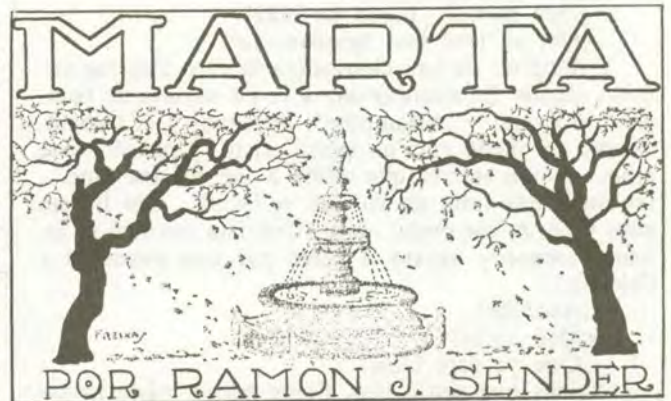
Cabecera del cuento en el original.

El piano, que ahora daba la impresión escalofriante de un monstruo acechando con sonrisa sádica en el misterio de la sala, era el alma de la casa, un espíritu paradójico que animaba el vetusto edificio encalado, de gran portal y panzudos balcones, y expandía por la pequeña plazuela provinciana tan pronto un perfume de religiosidad impregnada de morbosos misticismos como la blasfemia lírica de un bailable sensual hediendo a pecado. Todas las fibras sentimentales de la varia gama del corazón encontraban en él fidelísimo intérprete. A veces la liviandad rayaba en sadismo, y eran tan claros los matices, tan pronunciada la torpe expresión de sus impurezas, que el líquen de la fuente y los árboles secos de la plaza sentían como un estremecimiento y recordaban, melancólicos, las dulces nupcias de la última primavera. Entonces las campanas de la próxima catedral dejaban caer sus recriminaciones sobre la plazuela gris, recordaban las excelsas voluptuosidades de la virtud y asfixiaban, bajo una lluvia de flores de bronce, las guirnaldas paganas que tejera el alma neurótica del piano.