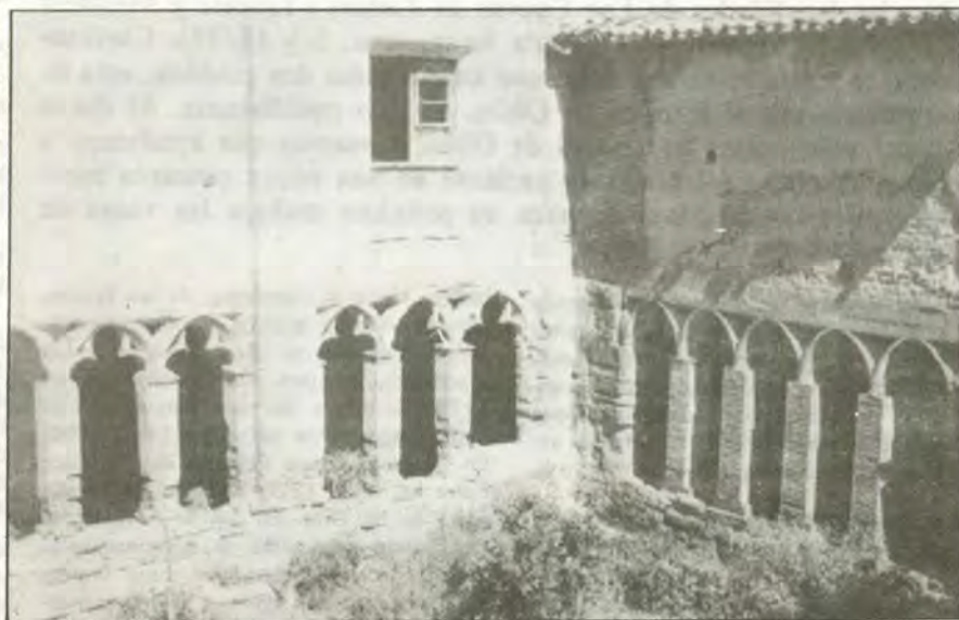
Monasterio de Casbas.