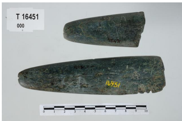
Figur 1 Støpeform av grønnstein funnet ved Vekterlia. Støpeformen er brukt til å støpe tveegget dolkeblad eller spydspiss av bronse eller kopper. Det er funnet lignende støpeformer i nordlige deler av Sverige og Finland og i Karelen og sentral-Russland. Støpeforma knyttes til Ananinkulturen som levde ved Kamaelva i Tartarstan i Russland. Støpeforma befinner seg i samlingene til Vitenskapsmuseet i Trondheim.