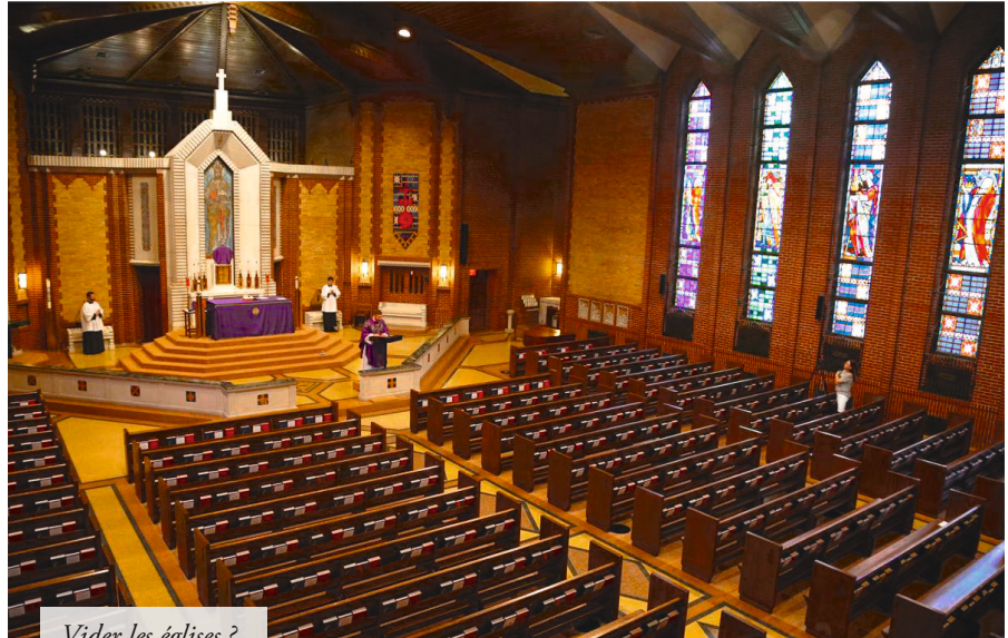
Vider les églises ?

Résumons-nous. Les catholiques français ont le droit de faire leurs courses alimentaires dans d'immenses complexes commerciaux, de se fournir en perceuses, scies sauteuses et autres instruments de bricolage, produits essentiels s'il en est, ils peuvent se rendre à l'usine et y travailler en commun, ils peuvent même consulter un psychologue et aller dans des salles d'attente où il est à craindre qu'ils soient plus de 6, mais il leur est interdit d'entrer dans