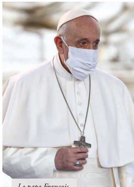
Le pape François

justes comme par les pécheurs, par les fidèles comme par les infidèles. Lorsque François écrit que Dieu donne la charité, on se prend à espérer qu'il va rappeler l'objet essentiel de la charité : Dieu aimé surnaturellement. Il n'en est rien. Le pape ne semble connaître qu'un seul objet de charité : l'homme, et qu'un effet de cette vertu : le dynamisme des vertus naturelles [91 et 93]. Jamais n'apparaît non plus la dimension surnaturelle de l'amour