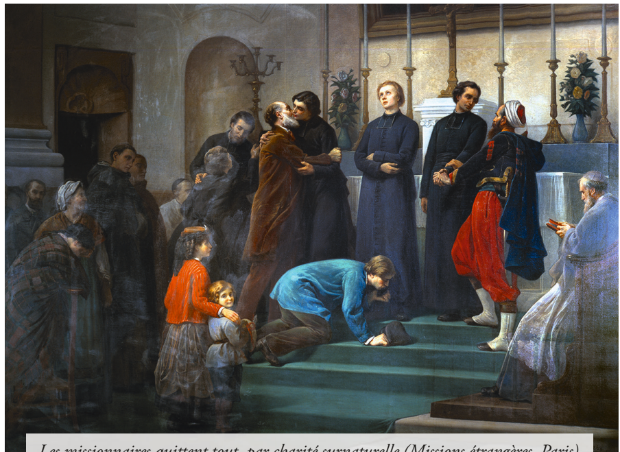
Les missionnaires quittent tout, par charité surnaturelle (Missions étrangères, Paris)

Aujourd'hui, tout le monde est capable de parler de tout, mais personne n'est en mesure de donner de véritables définitions des mots ou concepts utilisés. Cela vaut éminemment pour la charité. Cette belle vertu a été galvaudée par le naturalisme ravageur qui sévit partout depuis plus de trois siècles.