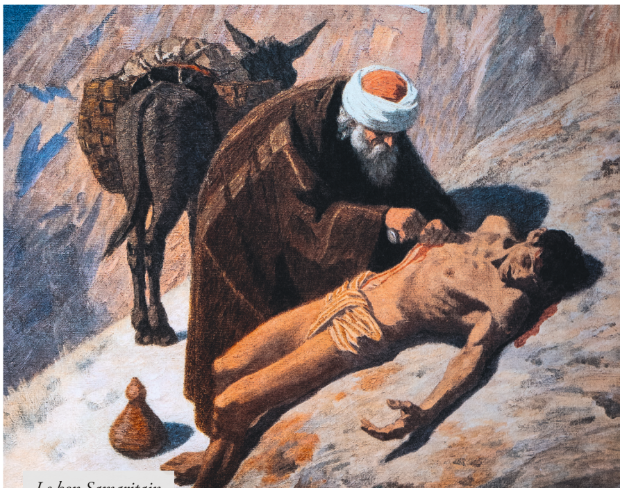
Le bon Samaritain

Une parabole évangélique est donc une histoire tirée de la vie ordinaire, apparemment banale mais essentiellement destinée à exposer une vérité d'ordre surnaturel. À ceux qui s'arrêteraient à l'histoire elle-même et n'iraient pas plus haut s'applique ce que dit le Sauveur : « Je leur parle en paraboles parce que voyant ils ne voient pas, et entendant ils n'entendent ni ne comprennent. » 3 Ainsi, en exposant la parabole des vierges folles, le Fils de Dieu n'avait pas pour but de faire prendre conscience à ces demoiselles qu'il leur faut acheter de l'huile en quantité suffisante : cela c'est la banalité du récit. Il voulait surtout nous rappeler l'importance d'être en état de grâce le jour de notre mort et l'impossibilité de recourir au prochain en ce terrible instant.