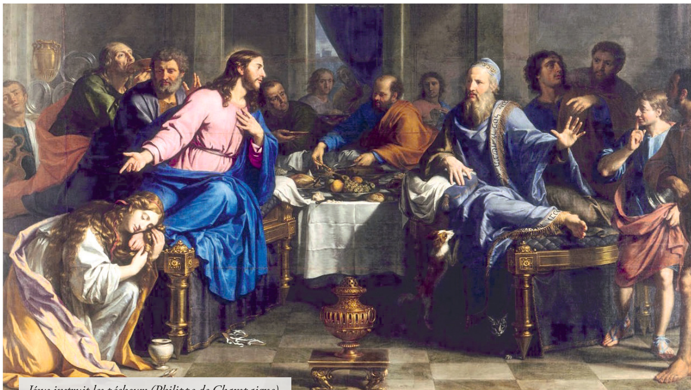
Jésus instruit les pécheurs (Philippe de Champaigne)

Qu'il est beau, cet ordre de la charité ! Dieu d'abord, que l'on aime par-dessus tout, par-dessus nous-même et par-dessus les autres hommes. Ce « par-dessus tout », du reste, peut aller loin. Dans une tragédie qui trouve de nos jours une pertinence particulière, Corneille faisait dire à Néarque, à l'adresse de Polyeucte encore hésitant :