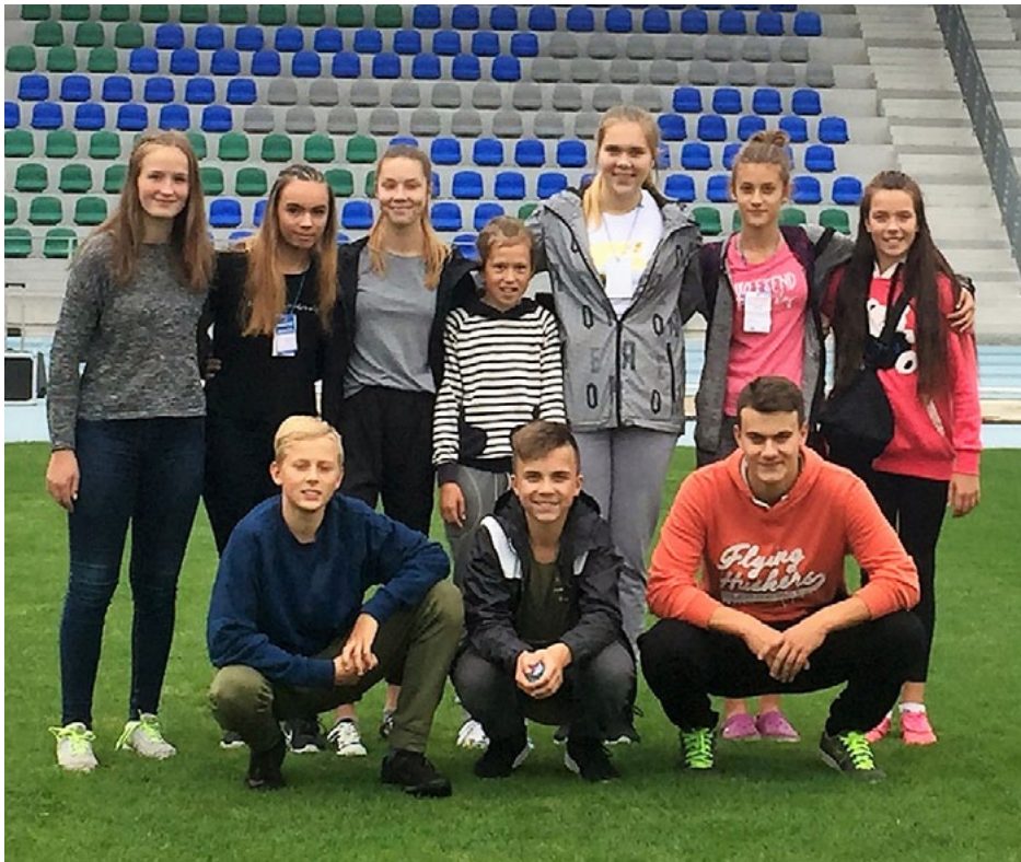
Salacgrīvas vieglatlēti Brno vieglatlētu sacensībās European Kids Athletics Games 2017

Septembra sākumā Salacgrīvas vieglatlēti devās uz Brno (Čehija), lai piedalītos tradicionālajās jauno vieglatlētu sacensībās European Kids Athletics Games 2017 . Sacensībās startēja piecu vecuma grupu (2002.—2006. g.dz.) sportisti no daudzām Eiropas valstīm. Dalībnieku skaits bija ievērojams – aptuveni 1300 sportistu. Līdz ar to dažās disciplīnās uz startu devās vairāk nekā 100 konkurenti.