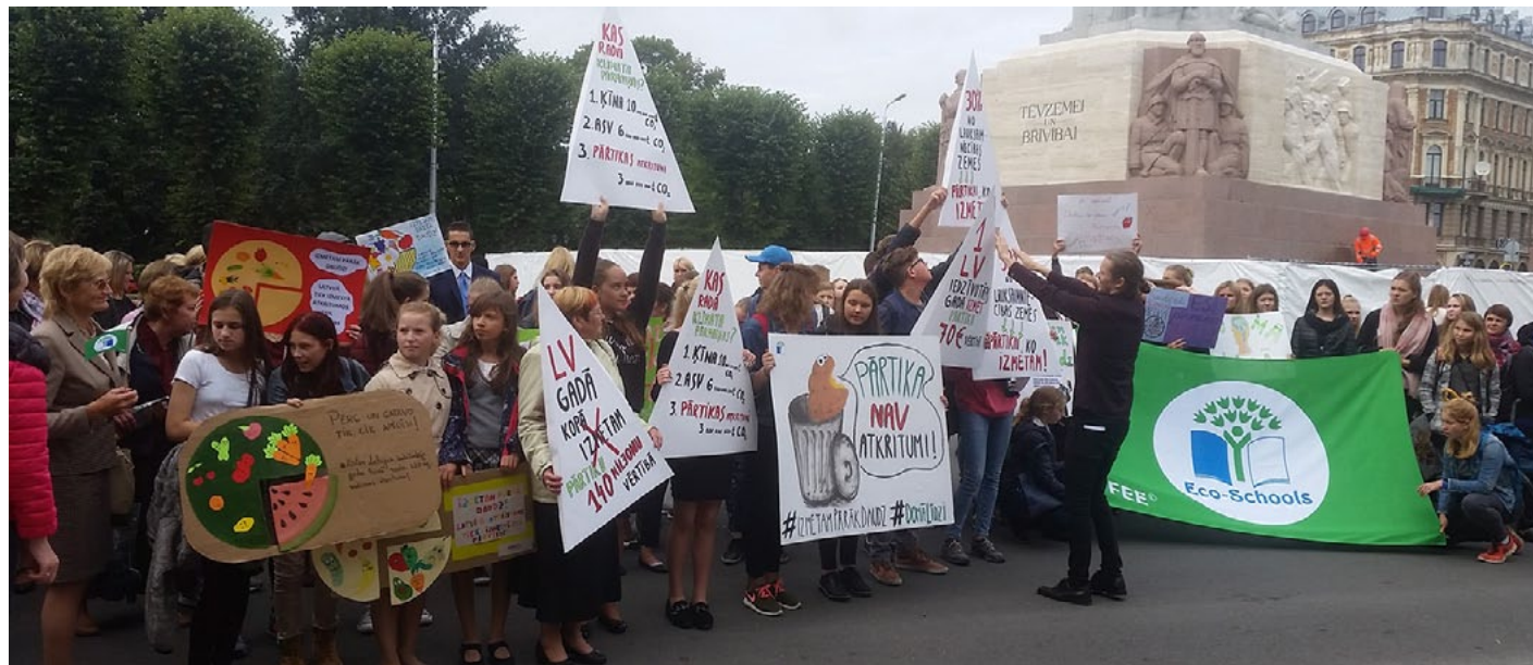
Piketā pie Brīvības pieminekļa arī Liepupes un Salacgrīvas vidusskolas audzēkņi un pedagogi