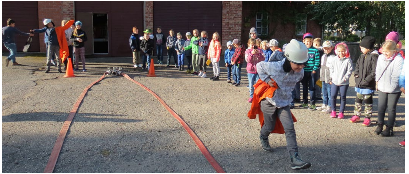
Jaunās paaudzes pirmās iemaņas ugunsdzēsībā tika pārbaudītas stafetēs

6. septembrī Ainažu ugunsdzēsības muzejs gaidīja ciemos savus vistuvākos draugus un atbalstītājus – Krišjāņa Valdemāra pamatskolas skolēnus, lai pārrunātu ugunsdrošības jautājumus. Lielākā daļa skolēnu muzeju ir apmeklējuši, jau ejot bērnudārzā, vien retais nav muzejā bijis ne reizi. Pirmie muzejā ieradās 1.—4. klašu skolēni. Tematiskajā ekskursijā sākumskolas audzēkņiem tika stāstīts, kas ir ugunsgrēks, kas to var izraisīt, kā rīkoties, ja tas izcēlies, par ugunsdrošību mājās, mežos un plāvās, negaisa laikā, sabiedriskajās iestādēs, ugunsdrošību svētku laikā. Arī 5.—9. klašu skolēniem stāstījām par ugunsdrošību, bet tas vairāk likās tāds ķeksīša pasākums, jo viņu zināšanas šajā jomā ir pietiekami labas un noturēt uzmanību ar vienkāršu stāstījumu ir grūti. Ceram, ka uz priekšdienām radīsim iespēju stāstījumu papildināt ar dokumentāliem materiāliem, fotogrāfijām, filmas fragmentu demonstrējumiem, taču tam pagaidām nav attiecīga aprīkojuma. Skolēnu zināšanas ugunsdrošības jautājumos labi