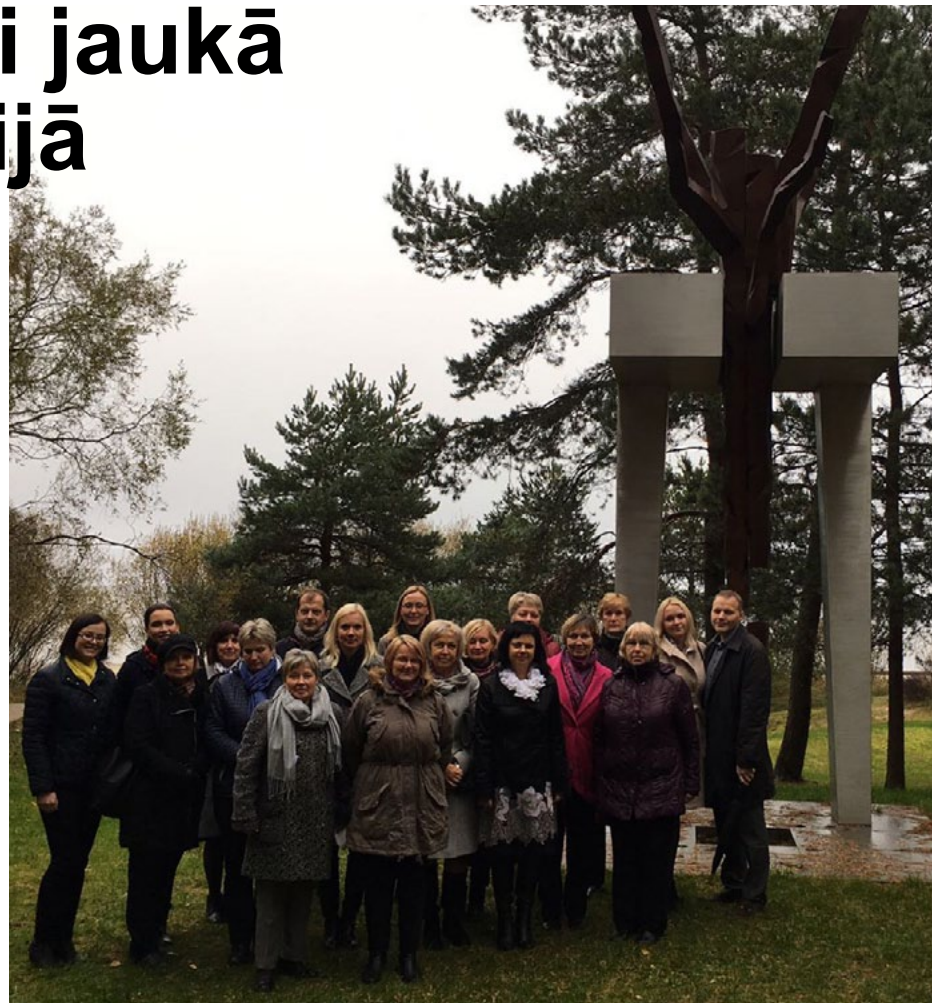
Dzejnieka Raiņa iecienītā atpūtas vietā tapa Salacgrīvas vidusskolas skolotāju kopīgā fotogrāfija