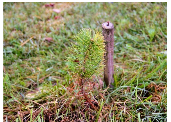
Tāda nu paaugusies pavasarī stādītā priedīte

Ko devusi šāda akcija? Vispirms atziņu, ka ceļš no stāda līdz lietaskokam ir turpat 100 gadu garumā. Gluži kā Latvijas valsts