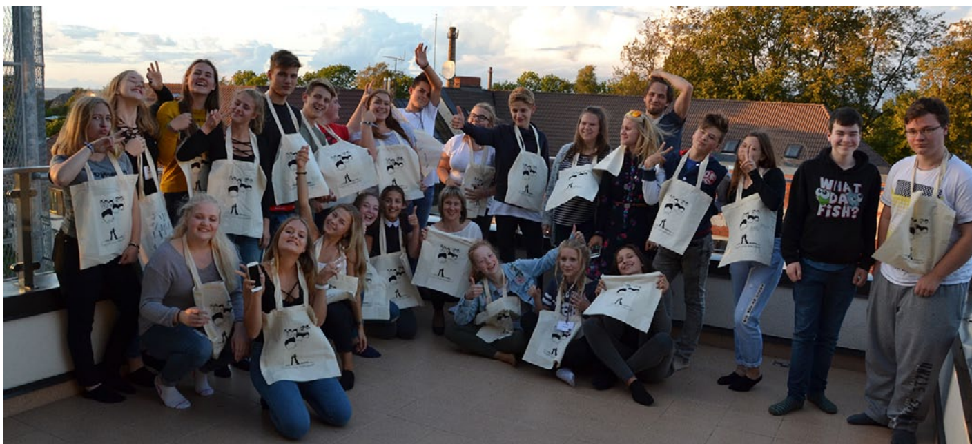
Handevitas un Salacgrīvas skolēni JIC Bāka