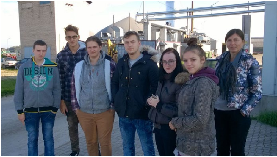
Liepupieši SIA Gravas biogāzes ražotnē Grow Energy

Liepupes vidusskolas seši 12. klases skolēni šajā mācību gadā iesaistījušies vides izglītības projektā Jaunie vides līderi , ko vada biedrība Daibes ilgtspējas centrs sadarbībā ar SIA ZAAO un ar Latvijas Vides aizsardzības fonda finansiālu atbalstu.