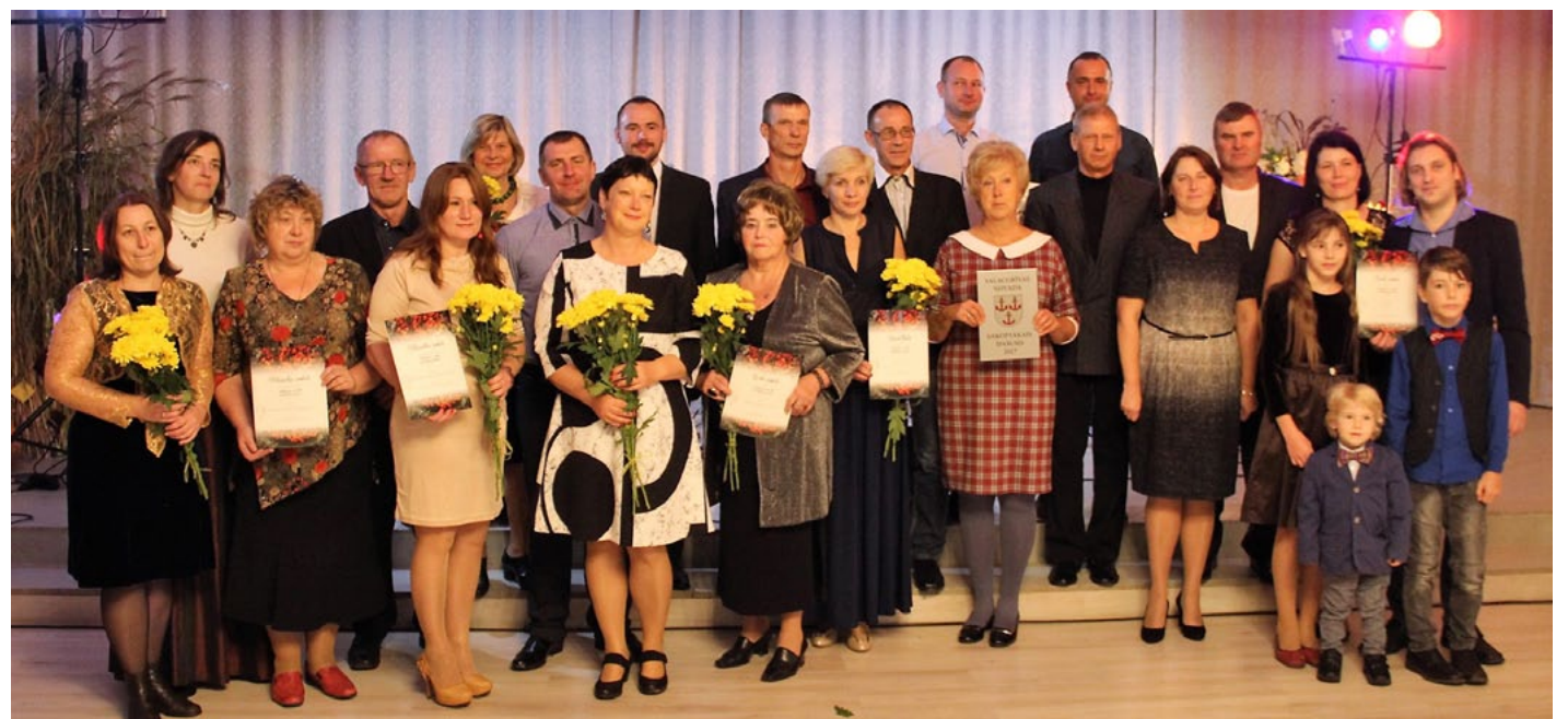
Šī gada sakoptāko sētu nominantu kopbilde