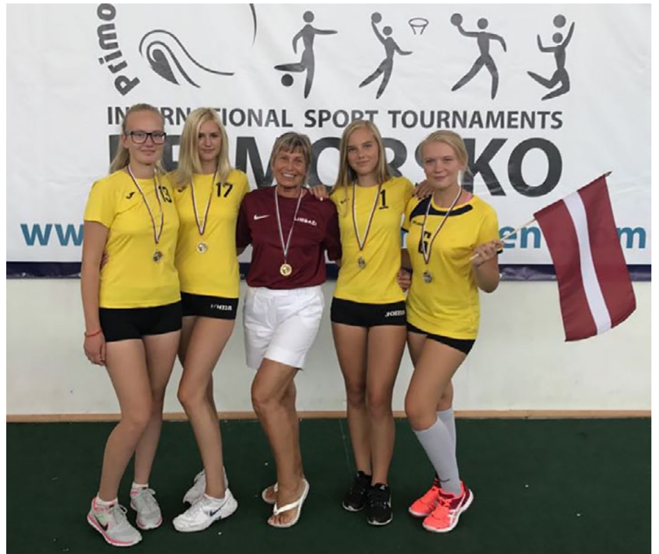
Liepupes volejbolistes ar treneri pēc uzvaras savā vecuma grupā

Laikā no 19. līdz 25. augustam Bulgārijas kūrortpilsētiņā Primorskā norisinājās starptautisks jauniešu volejbola turnīrs Černo more 2017 . Pēc divu gadu pārtraukuma šajā turnīrā piedalījās arī Limbažu un Salacgrīvas novada sporta skolas jaunas volejbolistes.