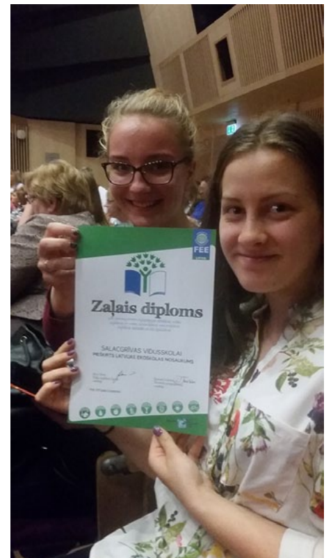
Salacgrīvas vidusskola arī ir saņēmusi zaļo diplomu

Ekoskolu apbalvošanas svinību pasākums noritēja Latvijas Nacionālajā bibliotēkā (LNB). Pirmajā pasākuma daļā skolas saņēma apbalvojumus un varēja iepazīties ar labās prakses piemēriem no kolēģu darba. Apbalvoto skolu un pirmsskolas iestāžu rindās ir gan tās izglītības iestādes, kas Ekoskolu programmā iesaistījās pirmo gadu, gan tās, kuras šo programmu īsteno jau ilgi – pat 15 gadu.