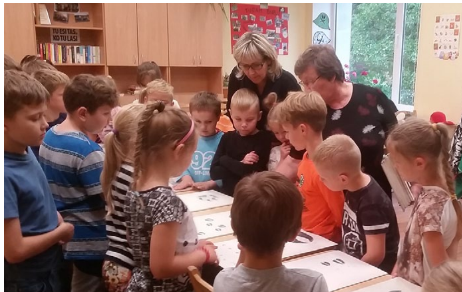
Nodarbību laikā skolēni varēja iepazīties ar putnu un dzīvnieku paradumiem, pataustīt zvēru ādas un pārbaudīt savas zināšanas, nosakot zvēru pēdas

18. septembrī, kad aiz loga vējš lieca koku zarus un lietus nemitējās, skolā pēc pedagogu uzaicinājuma ar izglītojošām nodarbībām ciemojās apmācības centrs Pa-