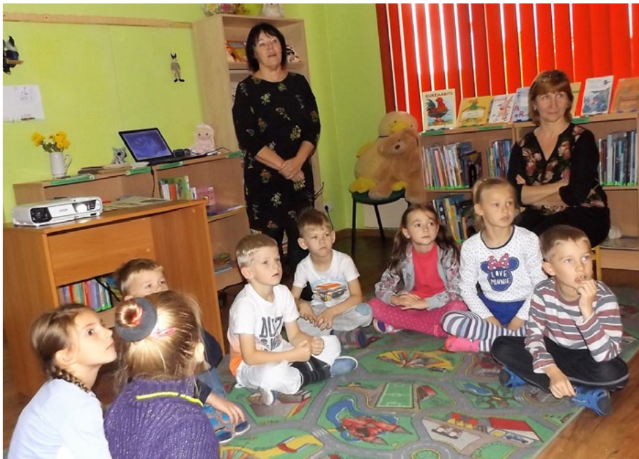
Rīta stunda Svētciema bibliotēkā