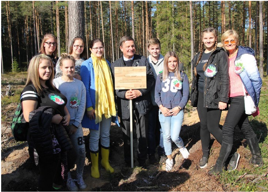
Kopā ar Liepupes skolēniem un skolotāju – Norvēģijas karalistes ārkārtējais un pilnvarotais vēstnieks Latvijā Steinars Ēgils Hāgens

29. septembrī Vides aizsardzības un reģionālās attīstības ministrija (VARAM) sadarbībā ar AS Latvijas Valsts meži , Dabas aizsardzības pārvaldi un ekoskolām no visas Latvijas devās izglītojošā ekspedīcijā mežā, lai mācītos par klimata pārmaiņām un oglekļa mazietilpīgu attīstību (OMA), kā arī iestādītu OMAs mežu.