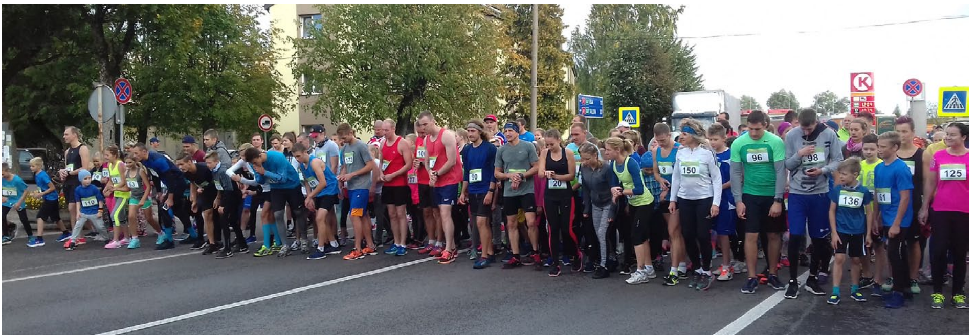
Šogad uz starta liels dalībnieku skaits – 182