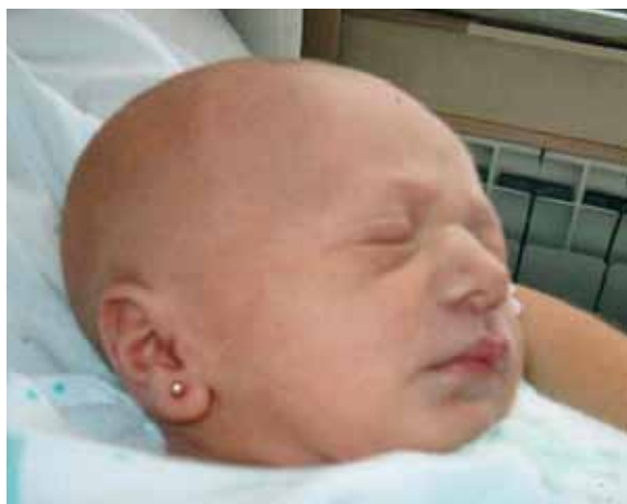
FIGURA 1. Recién nacida, con alopecia de cuero cabelludo y cejas. Eritema facial y periauricular