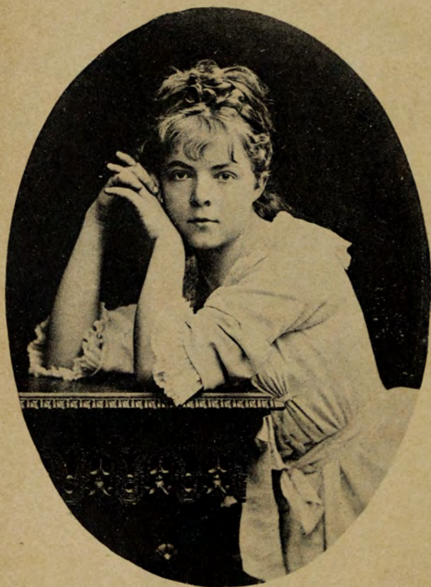
D'après la photog. Walery.