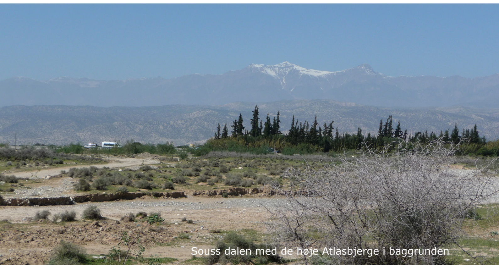
Souss dalen med de høje Atlasbjerge i baggrunden

Valget af rejserute gør, at vi får mulighed for rige oplevelser i Marokkos smukke natur samt undervejs også et indtryk af folkeliv og byer, som ligger uden for det mest turistprægede. Vi vil møde levevis, som ikke synes at have ændret sig i århundreder, og samtidig andre steder, hvor det fuldt moderne er rykket ind. Det er fremmedartet, eksotisk og alligevel nemt at være turist - i mødet med en farverig, gæstfri og venlig befolkning af ikke mindst berberkultur. Men glem ikke, at fuglene vil være i absolut fokus!