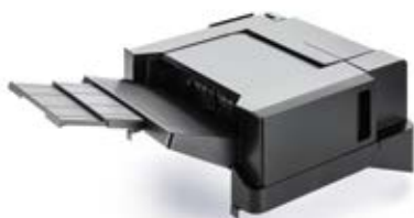
300-BLATT-FINISHER DF-5100 Ablagekapazität von bis zu 300 Blatt. Heftet bis zu 50 Blatt an 3 Positionen.