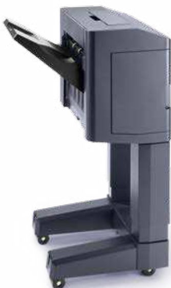
1.000-BLATT-FINISHER DF-5110 Externer Finisher für große Druckmengen. Heftet bis zu 50 Blatt an 3 Positionen; optionales Locher von Dokumenten.