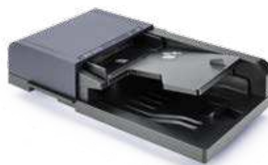
ORIGINALEINZUG MIT WENDUNG DP-5100 Der 75-Blatt-Originaleinzug scannt automatisch doppelseitige Dokumente in den Formaten A6 bis A4; Banner bis 1.900 mm.