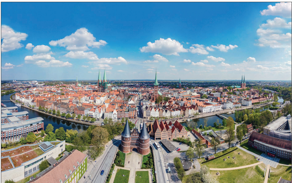
Die Hansestadt Lübeck (heute)

Aufgrund der besseren Lesbarkeit wird im Folgenden die männliche Form Schüler bzw. Lehrer verwendet. Gemeint sind damit jedoch sowohl die weiblichen als auch die männlichen Personen.