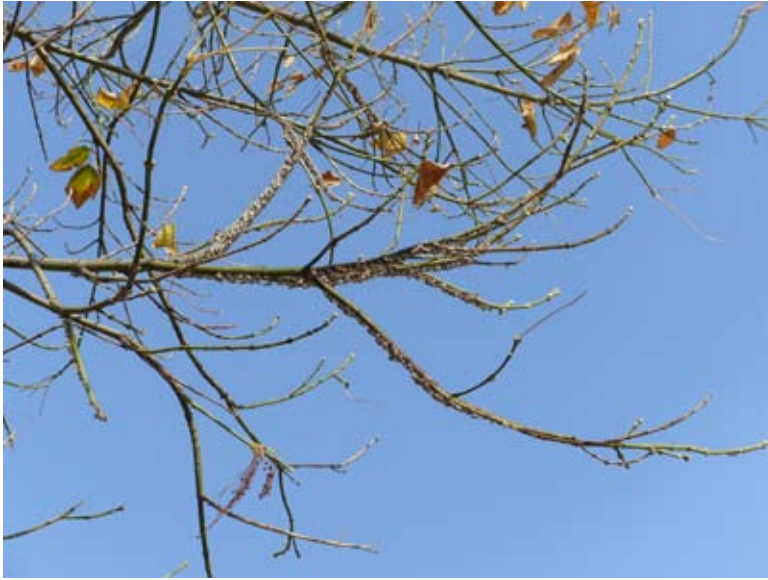
Figura 1a. Infestación de Metcalfiella monogramma (Germar) en su hospedero Acer negundo subsp. mexicanum (DC.) Wesm.