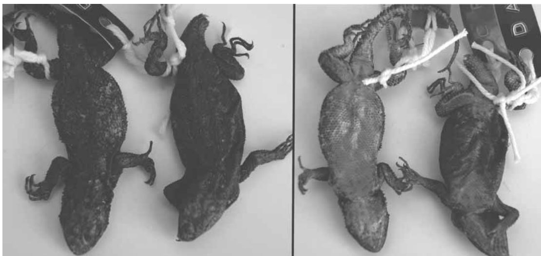
Figura 2. Vista dorsal y ventral de los ejemplares de S. heterolepis en la colección del CIIDIR-IPN-DGO. Izquierda CRD 317♀, Derecha CRD 249♂.

La distribución hasta ahora conocida de esta especie ha sido limitada por el valle del Río Santiago en Jalisco y se ha señalado que S. shannonorum reemplaza a S. heterolepis en la Sierra Madre Occidental (Smith et al. 2004, 2006). Con la designación de los dos ejemplares de la colección a S. heterolepis , se reporta por primera vez esta especie en los estados de Durango y Zacatecas en la porción sureste de la Sierra Madre Occidental ampliando el rango de distribución conocida para esta especie, aproximadamente 255 km NNO en línea recta desde la localidad más próxima en Tequila, Jalisco (Webb 1969).