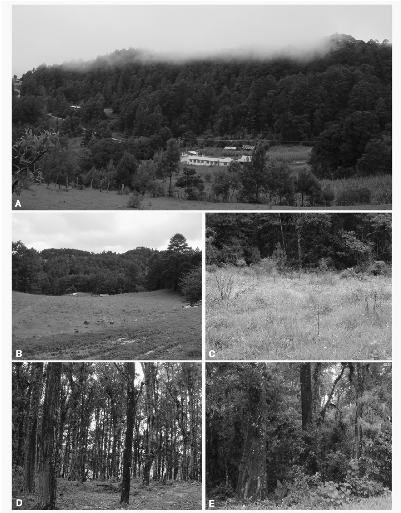
Figura 2. Tipos de vegetación de la comunidad de Bazom. A) bosque de pino-encino, B) campo abandonado, C) pastizal, D) bosque temprano, E) bosque maduro.