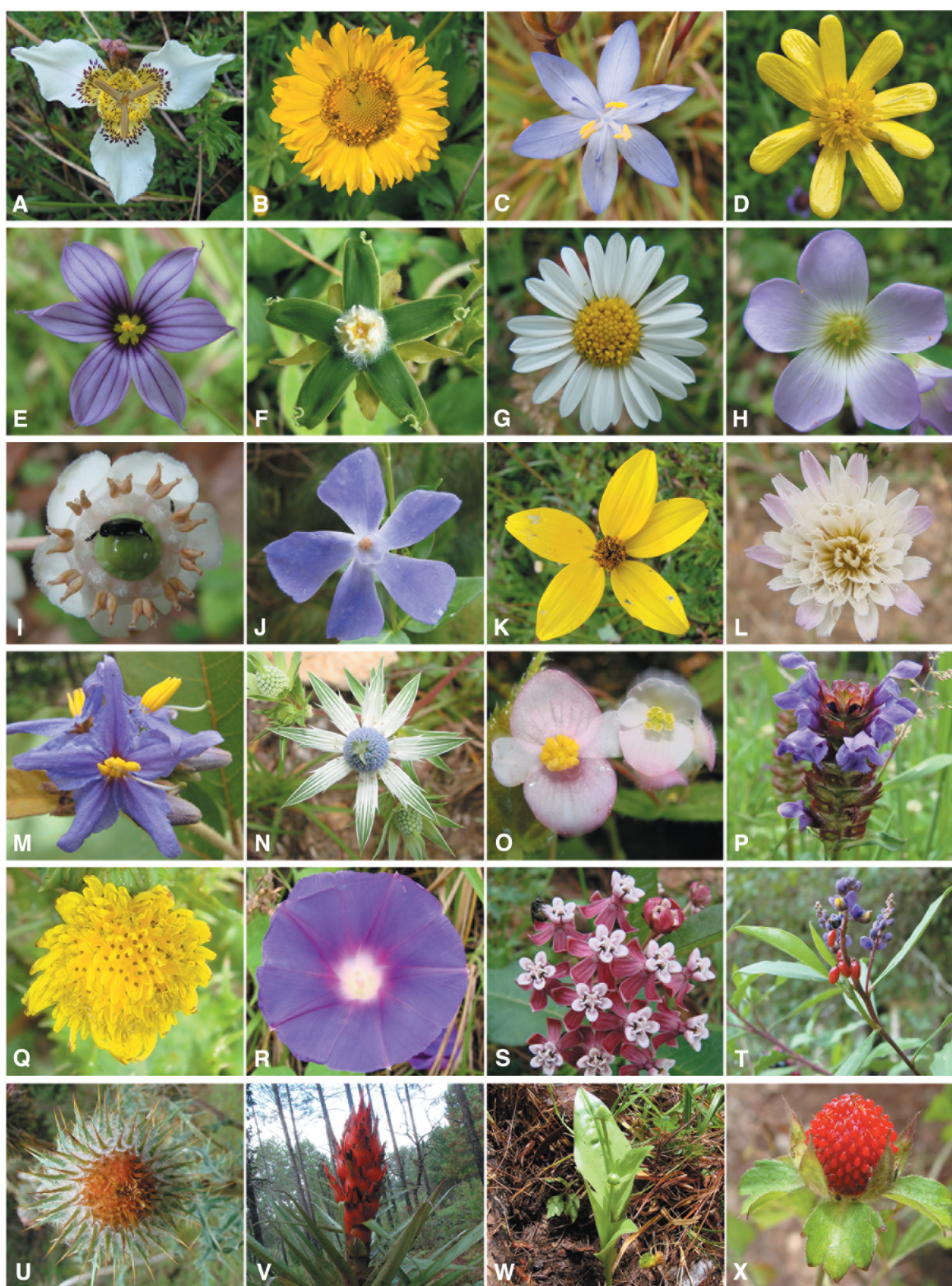
Figura 3. Representantes de la flora de la comunidad de Bazom. A) Tigridia chiapensis (endémica), B) Helenium scorzoneraefolium , C) Commelina diffusa , D) Ranunculus petiolaris , E) Sisyrinchium scabrum , F) Gonolobus stenosepalus , G) Symphyotrichum moranense , H) Oxalis alpina , I) Chimaphila maculata , J) Vinca major , K) Bidens triplinervia , L) Trifolium repens , M) Solanum lanceolatum , N) Eryngium scaposum , O) Begonia oaxacana , P) Prunella vulgaris , Q) Sonchus asper , R) Ipomoea purpurea , S) Asclepias similis , T) Monina xalapensis , U) Cirsium subcoriaceum , V) Tillandsia ponderosa , W) Malaxis brachyrrhynchos , X) Fragaria vesca .