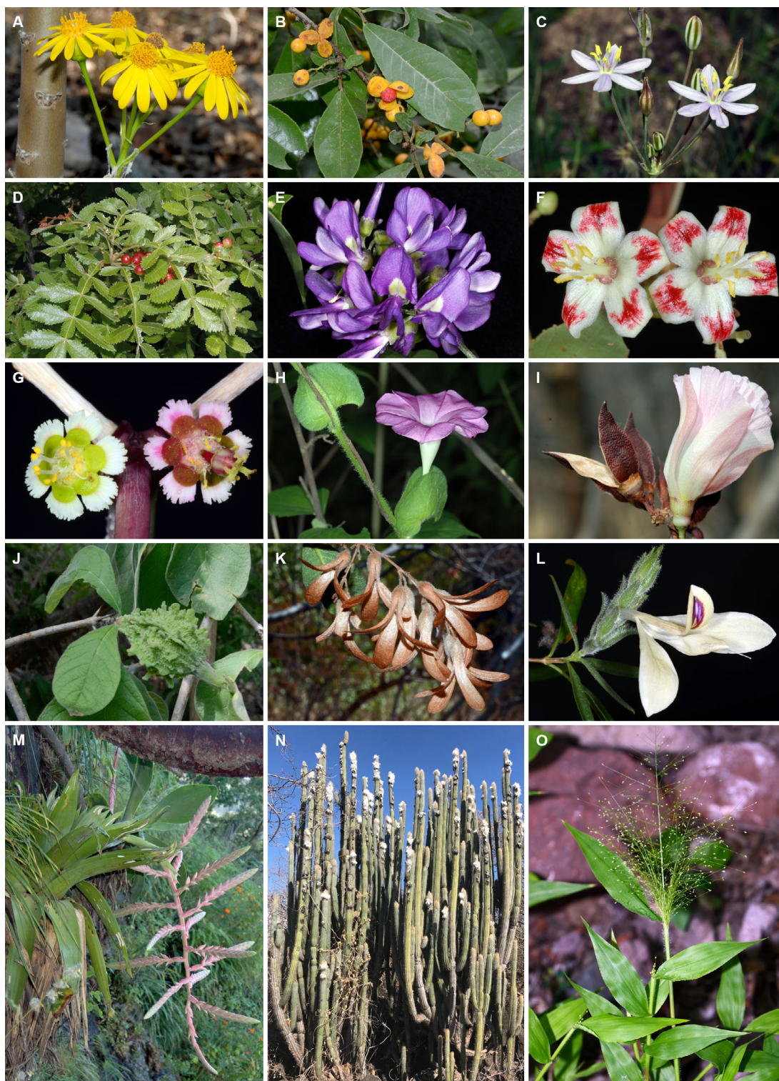
Figura 2. Algunas especies de la Reserva de la Biosfera Zicuirán Infiernillo: A) Pittocaulon bombycophole (Asteraceae); B) Casearia corymbosa (Salicaceae); C) Xochiquetzallia hannibalii (Asparagaceae); D) Bursera coyucensis (Burseraceae); E) Lonchocarpus huetamoensis subsp. huetamoensis (Fabaceae); F) Jatropha galvanii (Euphorbiaceae); G) Euphorbia arteagae (Euphorbiaceae); H) Ipomoea suffulta (Convolvulaceae); I) Gossypium schwendimanii (Malvaceae); J) Randia echinocarpa (Rubiaceae); K) Ruprechtia fusca (Polygonaceae); L) Tetramerium butterwickianum (Acanthaceae); M) Tillandsia trauneri (Bromeliaceae); N) Pilosocereus purpusii (Cactaceae); O) Panicum trichoides (Poaceae).