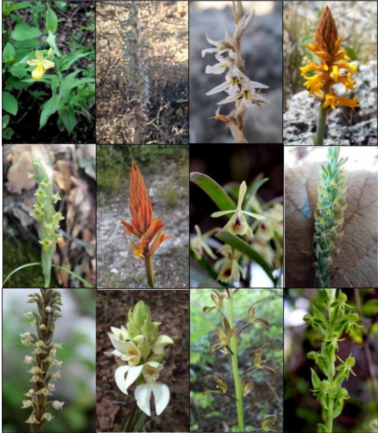
Fig. 4. A. Cyripedium molle , B. Deiregyne rhombilabia , C. Deiregyne tenorioi , D. Dichromanthus cinnabarinus subsp. galeottianum , E. Dichromanthus michuacanus , F. Dichromanthus yucundaa , G. Epidendrum lignosum , H. Galeoglossum tubulosum , I Goodyera striata , J. Govenia capitata , K. Govenia superba , L. Habenaria macvaughiana .