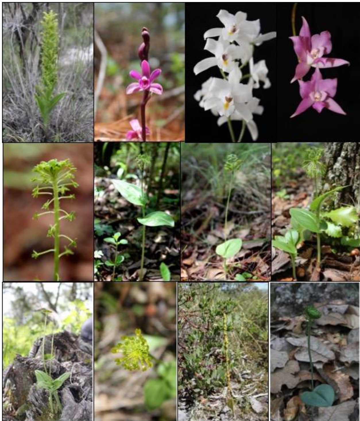
Fig. 5. A. Habenaria subauriculata , B. Hexalectris grandiflora , C. Laelia albida , D. Laelia furfuracea , E. Malaxis amplexicolumna , F. Malaxis brachyrrhynchos , G. Malaxis brachystachys , H. Malaxis fastigiata , I. Malaxis javesiae , J. Malaxis reichei , K. Malaxis soulei , L. Malaxis thlaspiiformis .