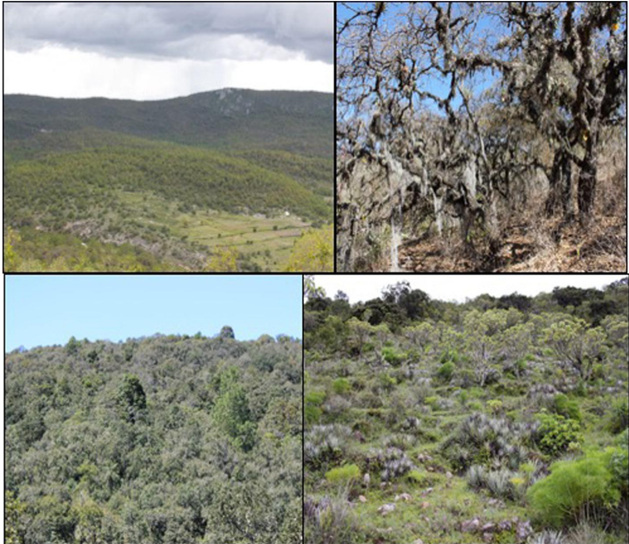
Fig. 2. Aspectos de la vegetación en la zona de estudio. A. bosque de Quercus en los alrededores de San Pedro y San Pablo Teposcolula, B. árboles de encino con epífitas en cerro Las Golondrinas, San Pedro y San Pablo Teposcolula, C. bosque de Quercus y Pinus en la agencia Tooxi, Santo Domingo Yanhuitlán, D. matorral xerófilo en San Pedro y San Pablo Teposcolula.