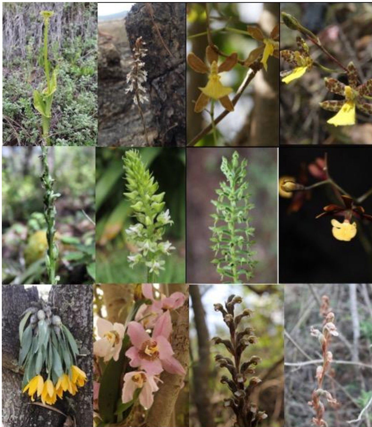
Fig. 6. A. Malaxis urbana , B. Mesadenus tenuissimus , C. Oncidium brachyandrum , D. Oncidium graminifolium , E. Platanthera brevifolia , F. Ponthieva mexicana , G. Ponthieva schaffneri , H. Prosthechea concolor , I. Prosthechea karwinskii , J. Rhynchostele cervantesii subsp. membranacea , K. Sarcoglottis sceptrodes , L. Sotoa confusa .