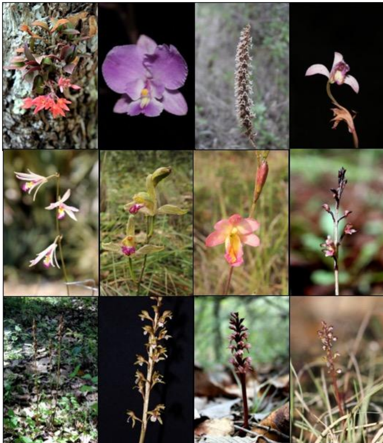
Fig. 3. A. Alamania punicea , B. Artorima erubescens , C. Aulosepalum pyramidale , D. Bletia lilacina , E. Bletia parkinsonii , F. Bletia reflexa , G. Bletia urbana , H. Corallorhiza bulbosa , I. Corallorhiza maculata var. mexicana , J. Corallorhiza odontorhiza var. pringlei , K. Corallorhiza striata var. involuta , L. Corallorhiza wisteriana .