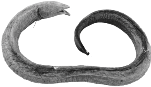
Figura 1. Pythonichthys asodes , CIAD 90-22, 622 mm LT. Los alfileres marcan el ángulo de la boca y la apertura branquial.