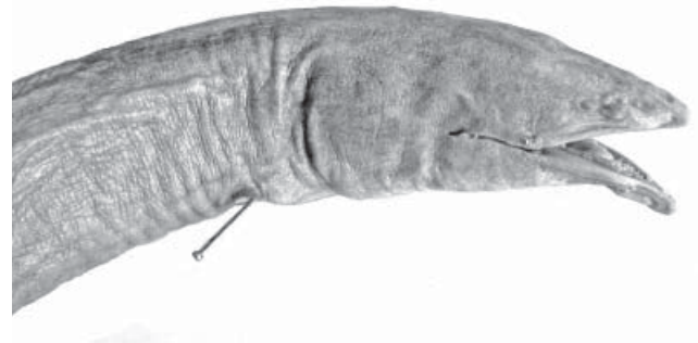
Figura 2. Cabeza de Pythonichthys asodes , CIAD 90-22, 64.5 mm LC. Los alfileres marcan el ángulo de la boca y la apertura branquial.

y merísticos de los individuos capturados en Sinaloa y 5 paratipos depositados en SIO, así como los datos del holotipo proporcionados en la descripción original de Pythonichthys asodes . Para la obtención de los datos se siguieron las especificaciones de Böhlke (1989). Con base en ellos, así como en los caracteres morfológicos, los tres ejemplares fueron identificados como P. asodes : dientes vomerianos continuos con los dientes intermaxilares, un par de pequeñas crestas dermales en el hocico, a ambos lados de la línea media dorsal, separadas por un surco somero, y el origen de la aleta dorsal ubicado delante de la cintura pectoral (solamente observable en las radiografías, Fig. 3).