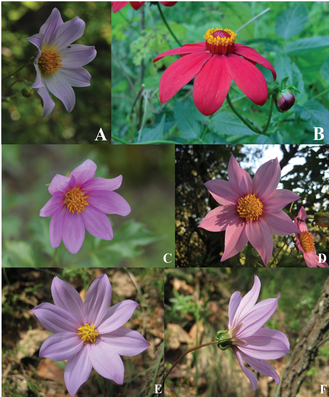
Figura 1. Las dalias del estado de Jalisco. A, Dahlia barkerae ; B, D. coccinea ; C, D. sherffii ; D, D. tenuicaulis ; E, D. pugana , vista frontal de la cabezuela; F, D. pugana , vista lateral y posición de las filarias.