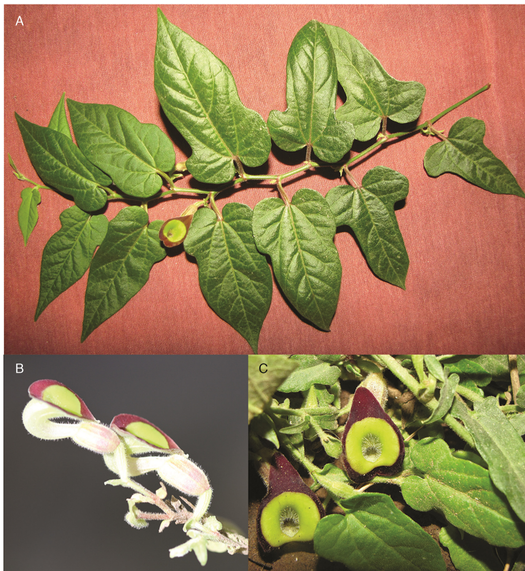
Figura 2. Aristolochia purhepecha Santana-Michel y Cuevas. A) Ramilla con hojas, estípulas, bractéolas y una flor; B) detalle de las flores en la que se observa el dobles del tubo y el limbo; C) limbo del cáliz con detalle del anillo, el color amarillo-limón concéntrico en la parte interna del limbo y lo piloso de la garganta.

Distribución y hábitat: bosque tropical subcaducifolio con Astronium graveolens Jacq., Brosimum alicastrum Sw., Enterolobium cyclocarpum (Jacq.) Griseb., Trichilia americana (Sessé y Moc.) T.D. Penn., y Sloanea terniflora (DC.) Standl.