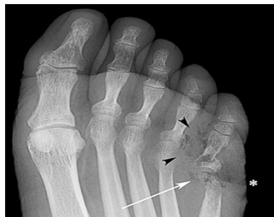
Fig. 2 Osteomielitis de pie .Radiografía de pie que demuestra aire en partes blandas en relación a 5° dedo (cabeza de flecha negra). También puede verse destrucción cortical de la cabeza del quinto metatarsiano (flecha blanca). Contornos irregulares de la piel suprayacente expresa la ulceración de partes blandas (asterisco).

Un tipo especial de osteomielitis debida a un foco contiguo ocurre en el marco de una enfermedad vascular periférica, en los pequeños huesos del pie del diabético (figura 2), la presencia de úlceras en miembros inferiores está fuertemente relacionada con presencia de osteomielitis hasta en un 60% de los casos. (Ugalde,2014).