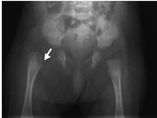
Fig. 1 Lesión osteolítica (osteomielitis) de fémur y artritis de cadera derecha por S. agalactiae en neonato de tres semanas.

La osteomielitis por continuidad se da secundaria a una artritis séptica y el comportamiento una vez instaurado el proceso es similar a la hematogena.