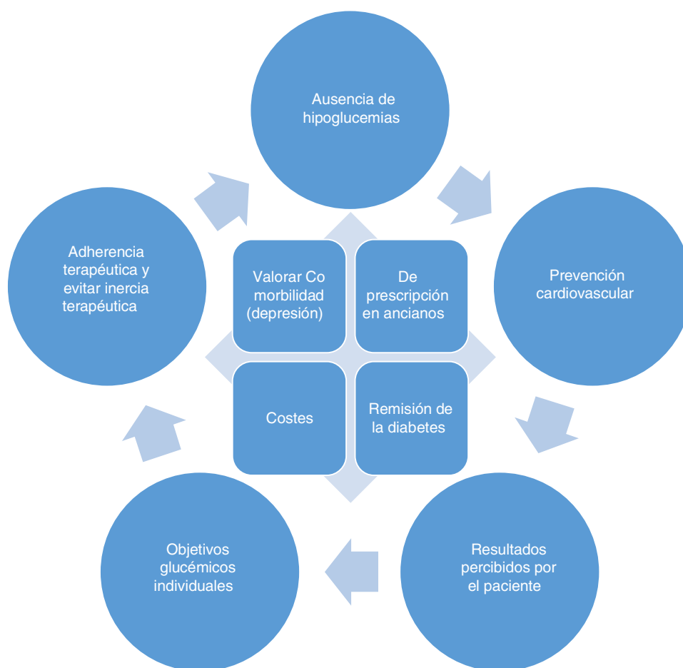
Figura 1 Principios generales para el tratamiento de la diabetes tipo 2.