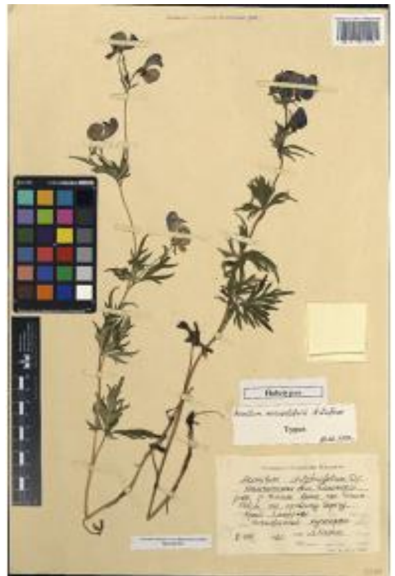
Рисунок 2 – Holotypus (голотип) Aconitum woroschilovii Lufarov