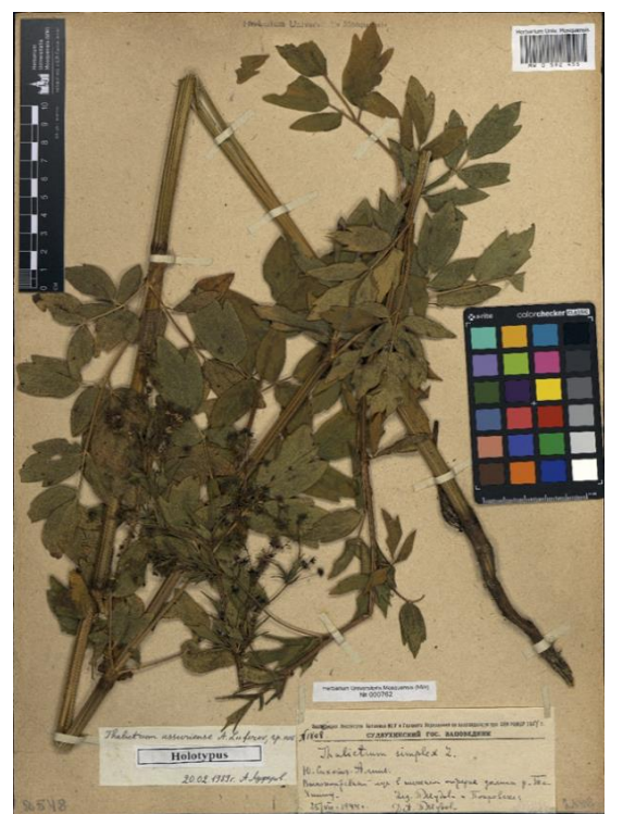
Рисунок 4 – Holotypus (голотип) Thalictrum ussuriense Lufarov