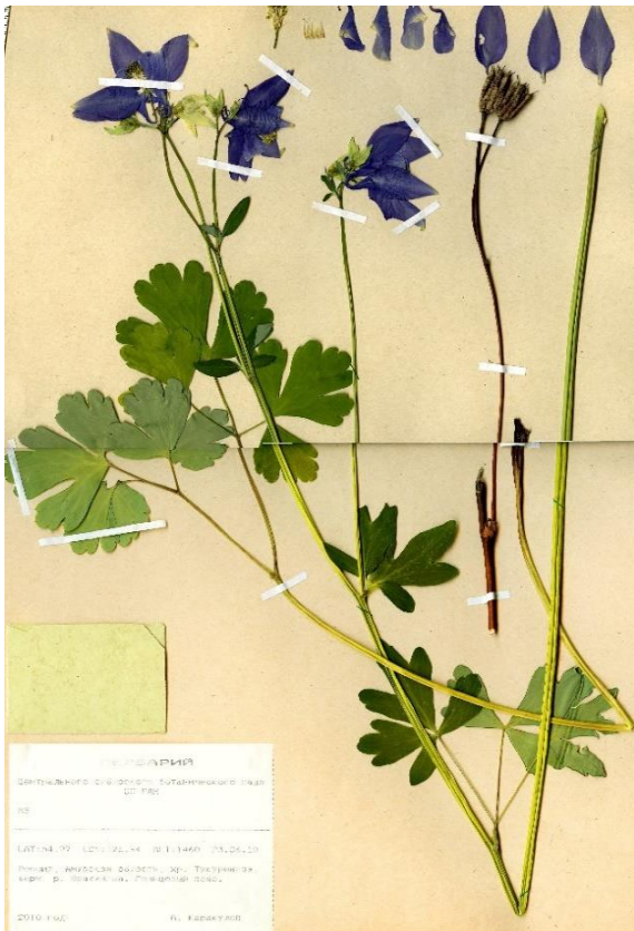
Рисунок 1 – Holotypus (голотип) Aquilegia barykinae A.Erst, Karakulov et Lufarov