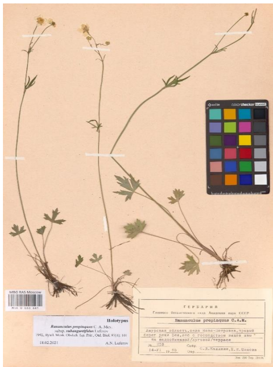
Рисунок 3 – Holotypus (голотип) Ranunculus subangustifidus (Lufarov) Lufarov