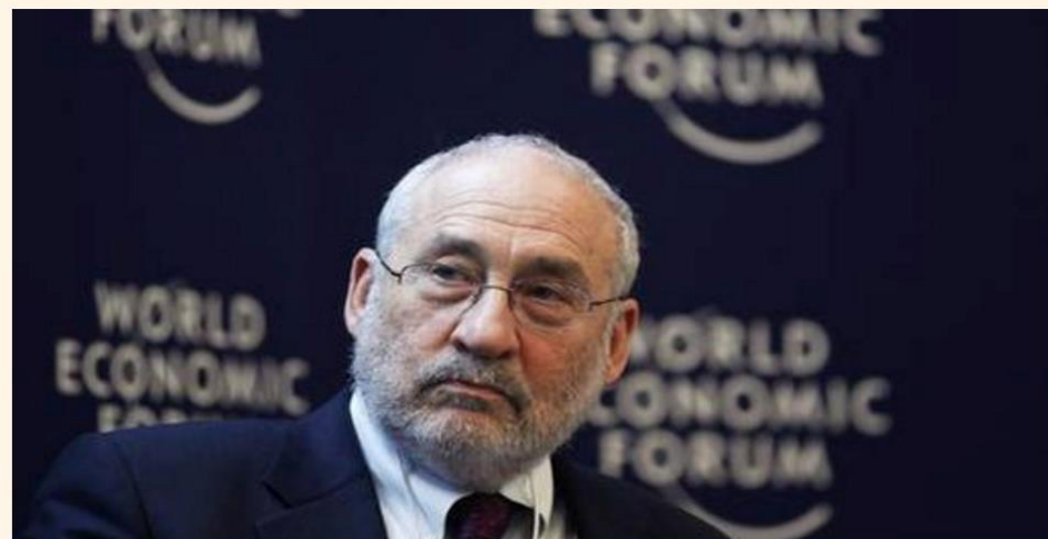
Joseph Stiglitz.

El premio nobel de Economía propuso a los chilenos alejarse del sistema previsional privado y contar con uno público.