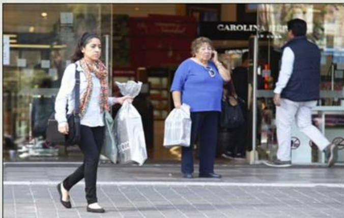
La OCDE propone reducir las pensiones de trabajadores que tienen opción de jubilarse con la Ley del Seguro Social de 1973.