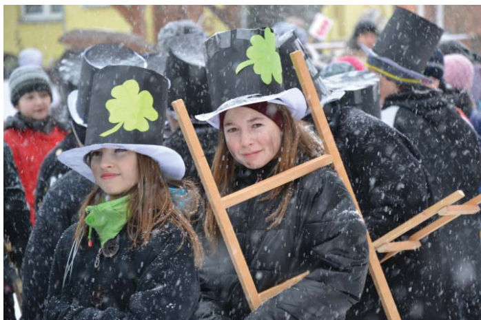
Celou fotogalerii z masopustu najdete na www.kulturamexus.cz