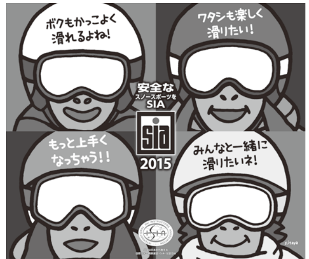
スキー・スノーボードレッスンはSIA公認校で