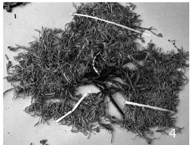
Рис. 3. Некоторые представители рода Eritrichium .

1. Eritrichium kamelinii (Республика Алтай), 2. E. kamtschaticum (Камчатка), 3. E. sajanense (хр. Байкальский), 4. E. ochotense (Магаданская обл.).