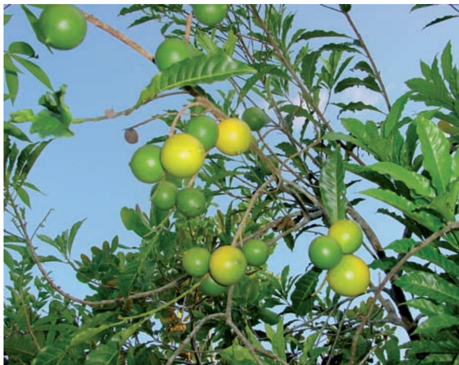
Foto 10. Frutos de Caimo Pouteria caimito

una clasificación en la que las especies de plantas se agrupan en géneros y los géneros en familias botánicas, para la comunidad de Wacurabá el inventario arrojó los siguientes resultados: