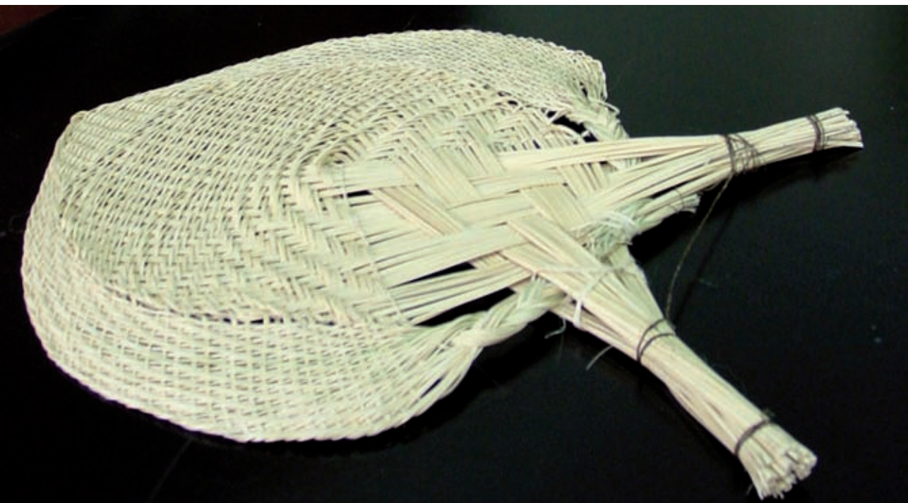
Foto 31. Ñucamba o soplador tradicional fabricado en cumare