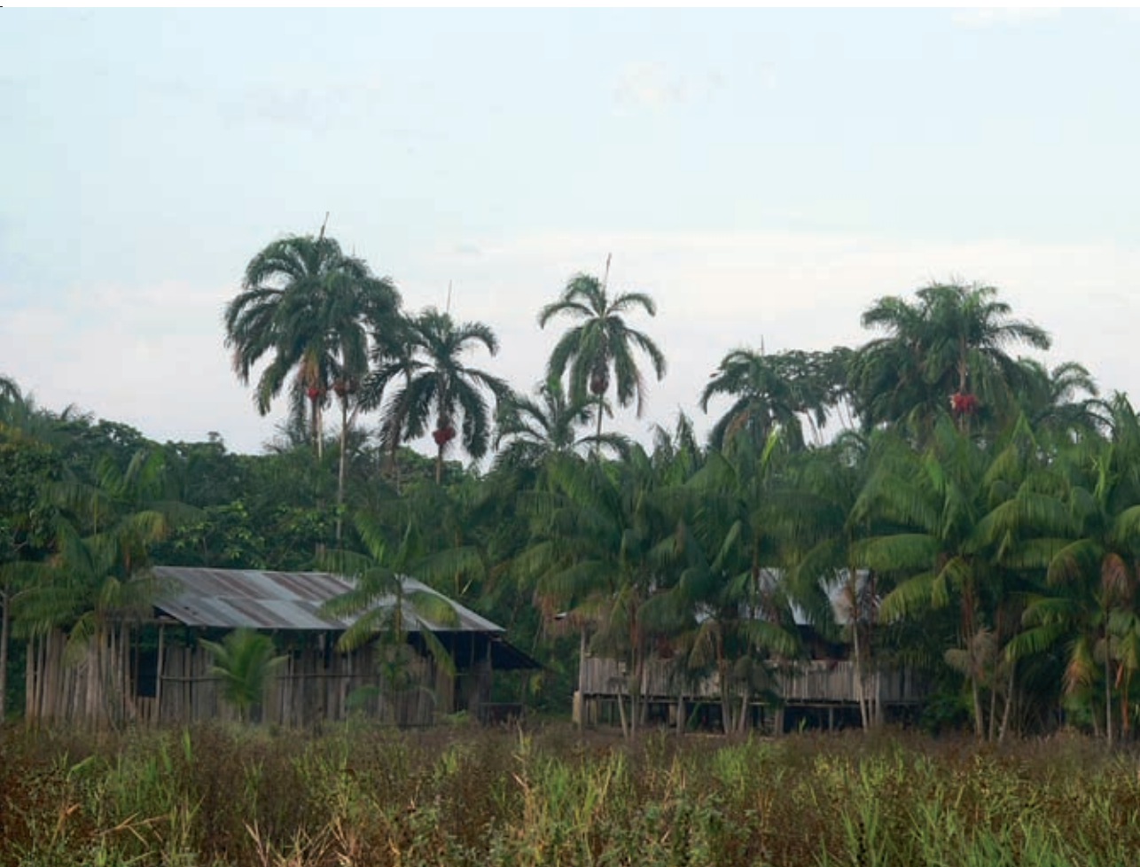
Foto 4. Área cercana a la comunidad

La jurisdicción de la comunidad de Wacurabá comprende zonas de sabanas sobre afloramientos rocosos, áreas de Sabanetas (bosques bajos hasta de 8 m sobre arenas blancas) ubicados en el extremo occidental del territorio; grandes extensiones de Miritizales (poblaciones de Mauritia flexuosa ), zonas de rebalse y bosques de tierra firme, donde se establecen las chagras y se encuentran los grandes rastrojos.