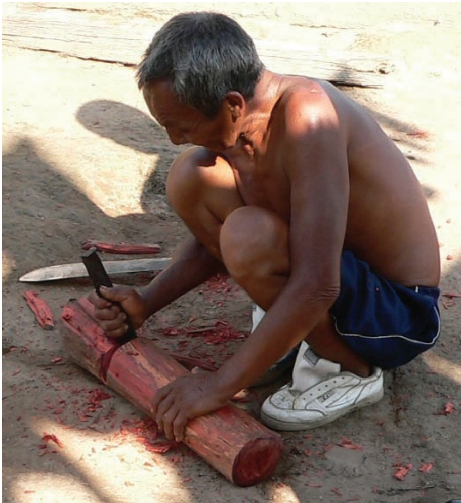
Foto 25. Artesano tallando un pilón de Mirapiranga

Oferta: Ya que su principal uso es para obtener madera con fines artesanales, el volumen de madera puede indicar qué tanto producto se puede obtener para la elaboración de artesanías. La mayoría de la madera de Mirapiranga que se utiliza proviene de las chagras en monte bravo, donde se pueden encontrar entre 3 y 10 palos.