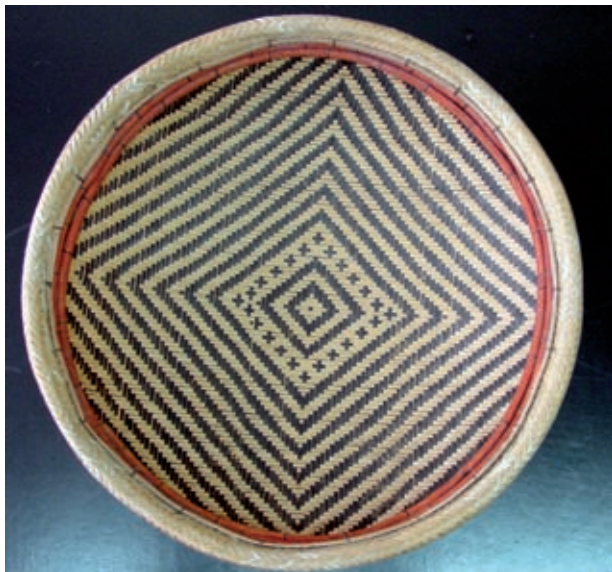
Foto 30. Balay fabricado en la comunidad

Esta estrategia comercial debe tener en cuenta los principales escenarios para