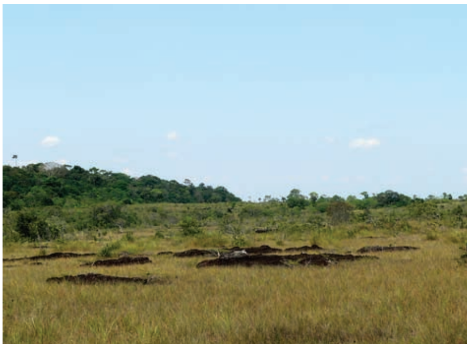
Foto 5, 5b. Sabana Yapobo sobre afloramientos rocosos