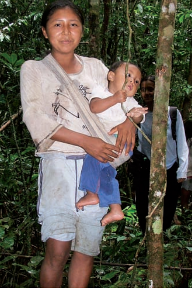
Foto 29. Habitantes de la comunidad, posibles beneficiarios de una futura comercialización artesanal

las materias primas son totalmente naturales; se elaboran con procesos tradicionales manuales; y tienen buenos acabados y excelentes materias primas.