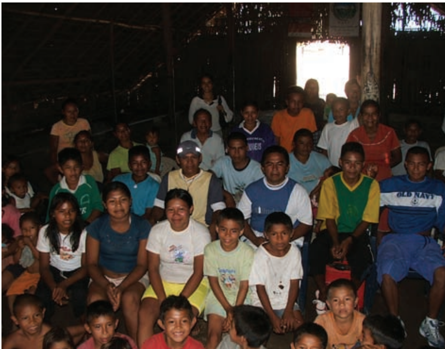
Foto 6. Habitantes de la comunidad reunidos en la Maloca

El primer paso fue la realización de un taller donde se concertó con la comunidad la realización del proyecto y cómo se produciría su participación a lo largo de los diferentes procesos. El taller en la comunidad de Wacurabá se efectuó entre el 13 y 18 de mayo de 2006; en éste se presentaron los antecedentes del proyecto y su relación con el Plan Integral de Vida Indígena. El taller se realizó con el acompañamiento de representantes de la Corporación para