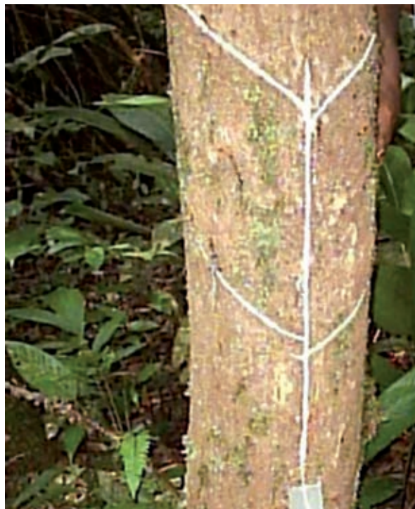
Foto 20. Extracción de látex de un árbol de Siringa

Extracción: El tronco se raya generalmente en forma de Y, donde el eje central sirve para la conducción del látex hasta una hoja de patabá o un pedazo de madera que dirige el exudado hacia una vasija formada con alguna hoja. Mientras se recoge el látex se buscan otros árboles para rayar hasta que la persona que hace la extracción considera que ha obtenido una cantidad suficiente.