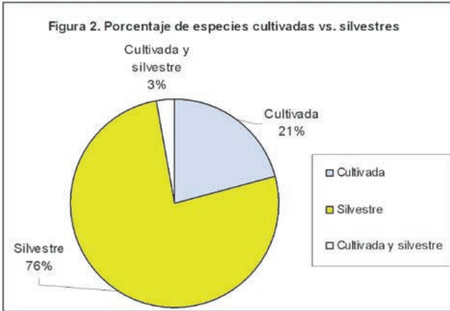
Figura 2. Porcentaje de especies cultivadas vs. silvestres

En lo referente a los productos o partes de las plantas que son utilizadas, el fruto es el más importante, 75 de las especies son aprovechadas por éste; seguidos de la hoja y el tallo con 47 y 45 especies respectivamente.