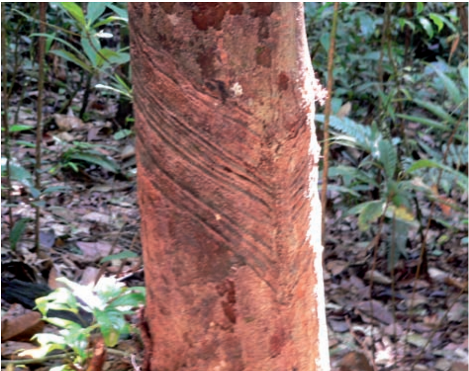
Foto 19. Siringa o Caucho con cicatrices de rayado

Usos: Las tres especies encontradas en la comunidad, Hevea benthamiana , H. guianensis y H. pauciflora , han sido usadas como fuente de látex (caucho), sin embargo históricamente en la región amazónica no han sido tan explotadas como Hevea brasiliensis , pues el látex de este último es el de mejor calidad y mayor producción de látex.