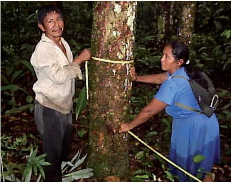
Foto 13. Habitantes de la comunidad durante el muestreo de Siringa

En total se recorrieron 6,5 Km en búsqueda de las especies, y se abarcó un área de muestreo de 21,2 Ha. Para cada especie, se tuvo la siguiente intensidad de muestreo (tabla 7).