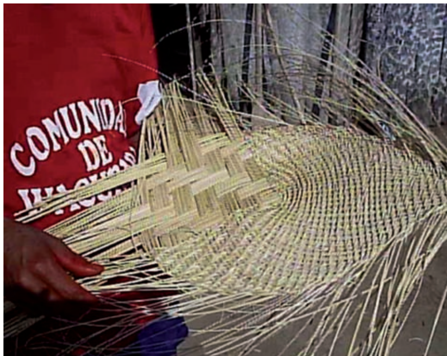
Foto 27. Soplador en proceso de elaboración

De acuerdo con la tabla anterior, si en la comunidad de Wacurabá se quisieran generar artesanías para comercializar además de las que se utilizan en los hogares y si todos los artesanos produjeran artículos, en un mes se podrían tener 42 balayes, 72 cernidores, 13 canastos y 62 sopladores para la venta.