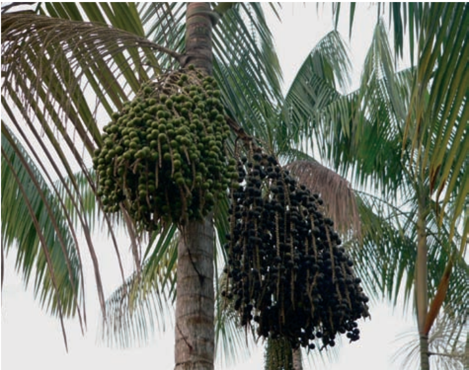
Foto 9. Frutos de Wasái ( Euterpe precatoria ), Familia Arecaceae

Las muestras botánicas colectadas sirvieron para identificar, nombrar y agrupar las plantas útiles. Así como los indígenas tienen una forma de conocer y clasificar las plantas, los no indígenas utilizan