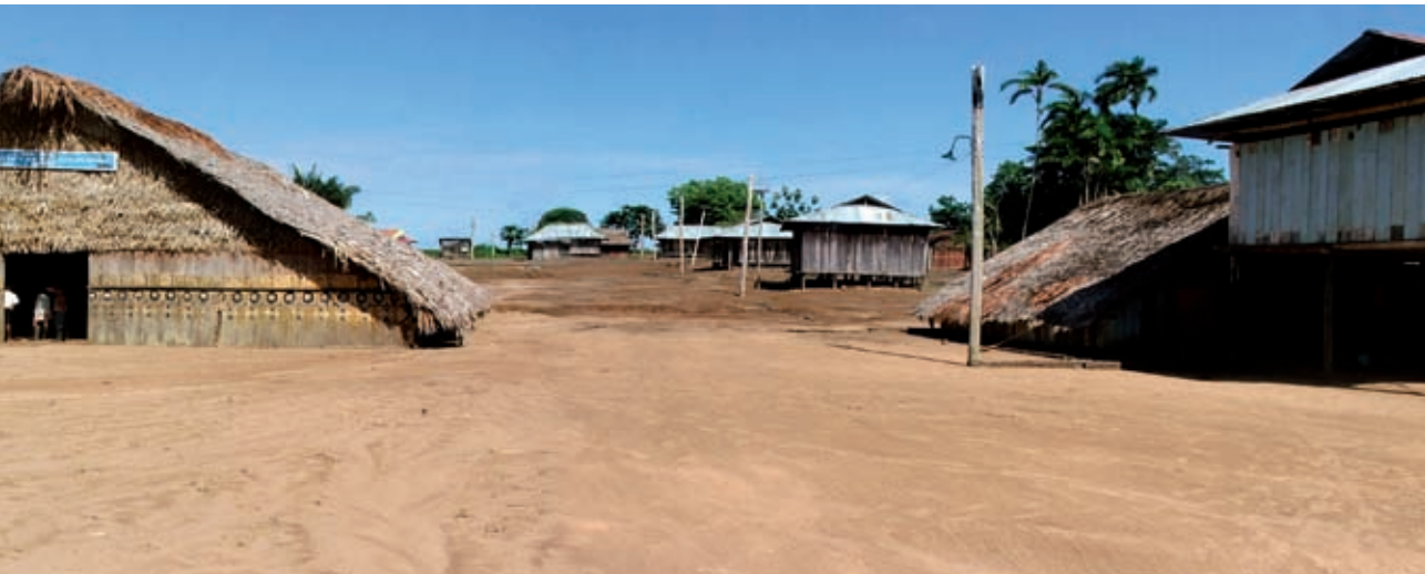
Foto 1. Maloca de la Comunidad de Wacurabá

Teniendo en cuenta el conocimiento de la zona obtenido en el desarrollo del Plan Integral de Vida Indígena de la zona UDIC, la Corporación CDA decidió enfocar sus esfuerzos hacia la Comunidad de Wacurabá.