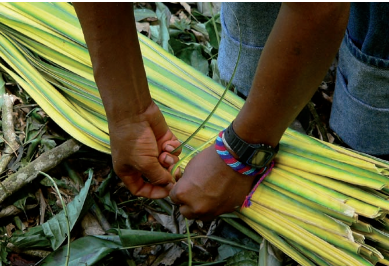
Foto 16. Extracción de Cumare

Extracción y preparación: Se utiliza el cogollo de la palma y las hojas que estén buenas (jechas); sin embargo, para otras regiones de la Amazonia, se ha encontrado que sólo se utilizan las hojas jóvenes. Las hojas son llevadas a la casa del artesano donde se extrae la fibra que puede ser trenzada para la elaboración de utensilios.