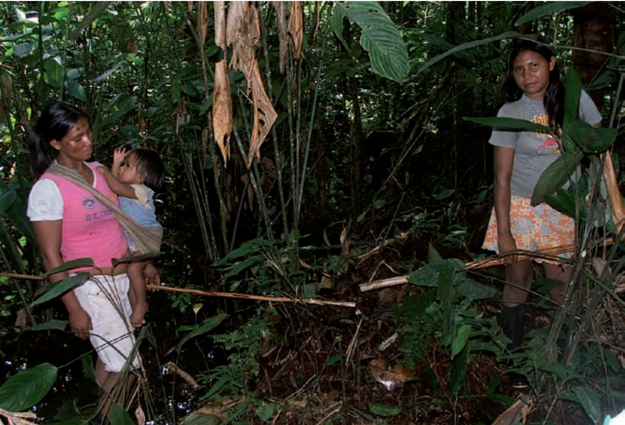
Foto 12. Mujeres de la comunidad en la cuantificación del Yarumo rojo ( Ischnosiphon obliquus )

Para decir qué tan promisorio es una especie y poder buscar alternativas de desarrollo económico, no es suficiente saber que la especie está en la región. Es necesario calcular qué tanta cantidad de