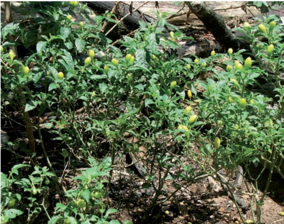
Foto 11. Ají cultivado en la chagra

De las 259 especies de plantas útiles encontradas en Wacurabá, 54 especies (21%) son cultivadas para su consumo, 198 de las especies (76%) crecen espontáneamente en condición silvestre, es decir que