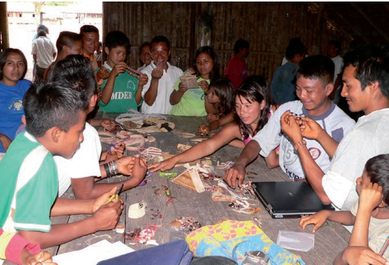
Foto 28. Participantes de los talleres

Se realizaron talleres participativos, en los cuales se abordaron seis temas previamente propuestos y concertados con los artesanos y la comunidad en general para conocer los aspectos importantes en torno a la producción artesanal del departamento. Los talleres iniciaron con una sensibilización y ambientación y trataron temas como conceptos básicos de artesanías, etapas en la elaboración y comercialización, visión empresarial, identificación y análisis de costos y pasos básicos para la creación de empresas artesanales. Los talleres constituyeron la base para definir los lineamientos sobre expectativas de la comunidad y estrategias de comercialización de los productos.