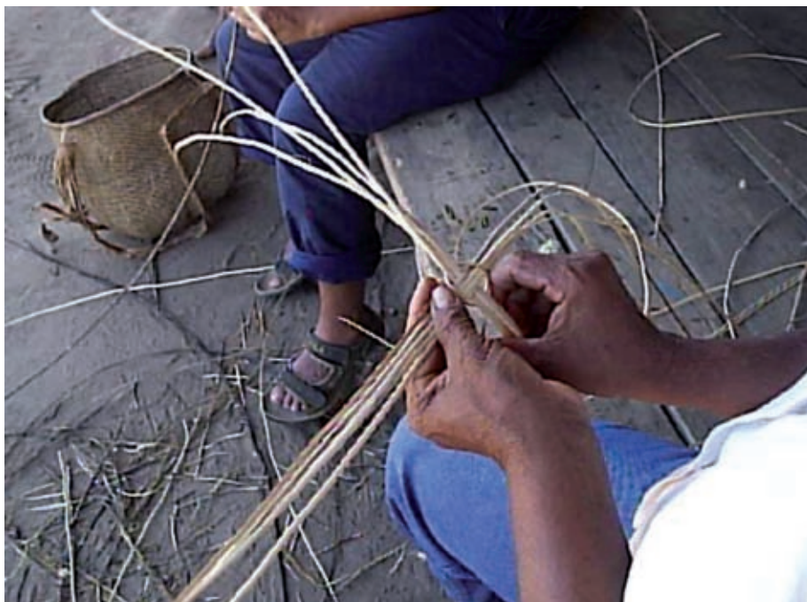
Foto 18. Artesana preparando las fibras de Bejuco Yaré Foto 18b. Artesana preparando las fibras de Bejuco Yaré