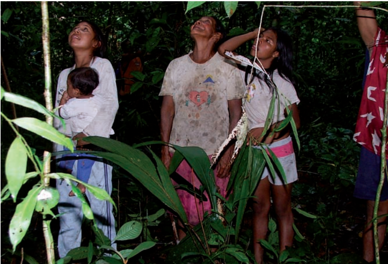
Foto 7. Grupo de miembros de la comunidad durante el muestreo

Inicialmente durante una reunión con amplia participación de la comunidad, se seleccionaron las áreas representativas donde la co-