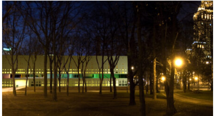
Sicht vom Park

Durch die Anordnung der kommerziellen Nutzungen auf dem Erdgeschoss- resp. Strassenniveau wird das Eingangsgeschoss des Museums auf einen Sockel angehoben, der von zwei Seiten her erschlossen wird. Auf diesem Lobbygeschoss sind alle öffentlich zugänglichen Nutzungen des Museums angeordnet. Die Obergeschosse beinhalten die Administration und die Galerieräume. Aussenräumlich werden die transparenten Sockelgeschosse des städtebaulich vorgegebenen Volumens durch eine vom Basler Künstler Jürg Stäubli gestaltete Fassade mit den introvertierten Obergeschossen zusammengebunden.