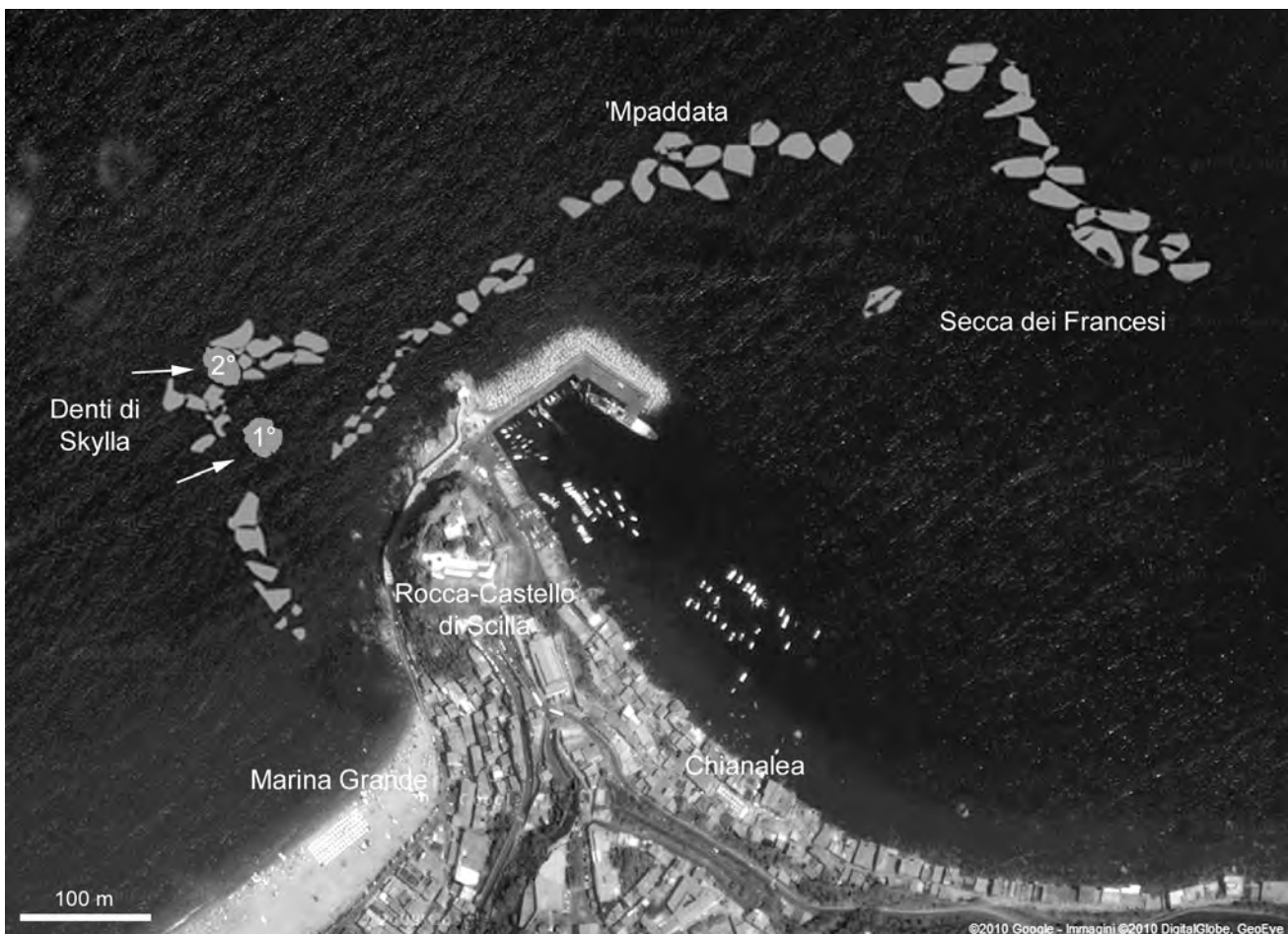
Fig. 2. Ortofoto della Rocca-Castello di Scilla e ubicazione degli scogli sommersi. Sono indicati i due scogli noti come "Denti di Skylla"

Neosimnia illyrica (Fig. 3I), non rara nell'area in studio, è stata di recente riabilitata da Fehse (2007), il quale ha fatto riferimento alle ricerche di Schiaparelli (2005) sulle relazioni filogenetiche negli Ovulidae basate su analisi molecolari. Schiaparelli differenzia Neosymnia spelta (Fig. 3H) in due ecofenotipi "morph a" e "morph b", sia su base genetica, sia sulla base di caratteri anatomici e conchigliari, oltre che sulla base della gorgonia ospitante. Fehse in Lorenz & Fehse (2009) attribuisce il "morph b" a Neosimnia illyrica Schilder, 1927. Neosimnia spelta è più frequentemente associata a gorgonacei del genere Eunicella , mentre N. illyrica è associata a Leptogorgia sarmentosa . Nell'area è presente anche Simnia nicaeensis ,