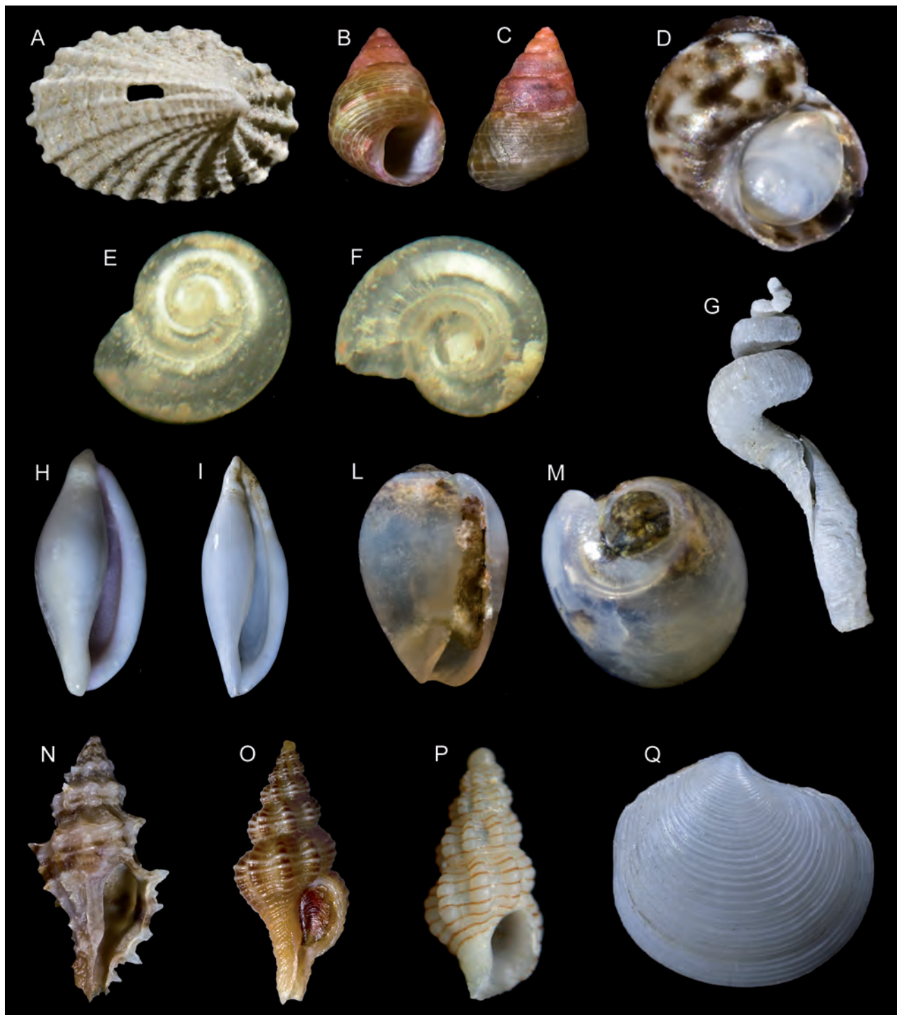
Fig. 3. A. Puncturella picciridda Palazzi & Villari, 2001, 2,5 mm. B, C. Jujubinus curinii Bogi & Campani, 2006, 4,0 mm. D. Tricolia landinii Bogi & Campani, 2007, 2,0 mm. E, F. Xylodiscula wareni Bogi & Bartolini, 2008, 1,5 mm. G. Petalopoma elisabettae Schiaparelli, 2002, 23 mm. H. Neosimnia spelta (Linnè, 1758) 9,0 mm. I. Neosimnia illyrica Schilder, 1927, 12,0 mm. L, M. Gibberula cristinae Tisselli, Agamennone & Giunchi, 2009, 2,7 mm (con mollusco). N. Murexsul cevikeri (Houart, 2000), 21 mm. O. Fusinus dimassai Buzzurro & Russo, 2007, 10 mm. P. Chauvetia giunchiorum Micali, 1999, 6,0 mm. Q. Lucinoma spelaum Palazzi & Villari, 2001, 11,0 mm.