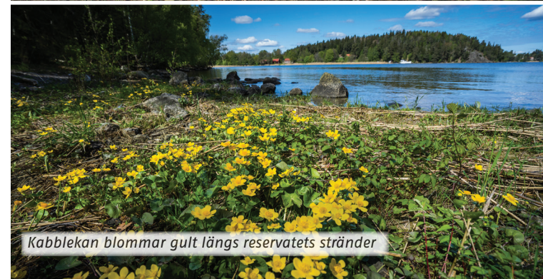
Kabblekan blommar gult längs reservatets stränder

Från hagmarkens östra del går en markerad stig upp till en utsiktsplats. Här har du en härlig vy över inloppet till Södertälje medan du njuter av picknickkorgen. Fortsätter du på stigen kan du även via den här vägen ta dig till Vargholmen, och sedan tillbaka till parkeringen.