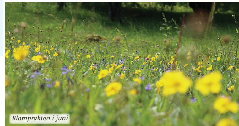
Blomprakten i juni