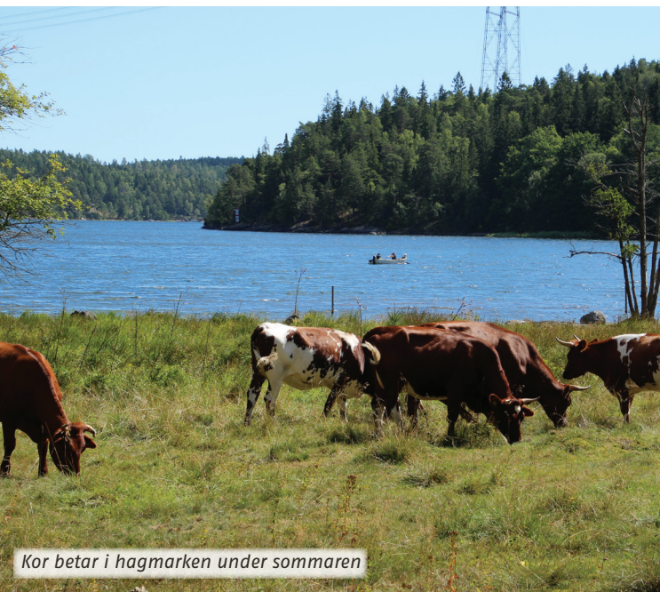
Kor betar i hagmarken under sommaren