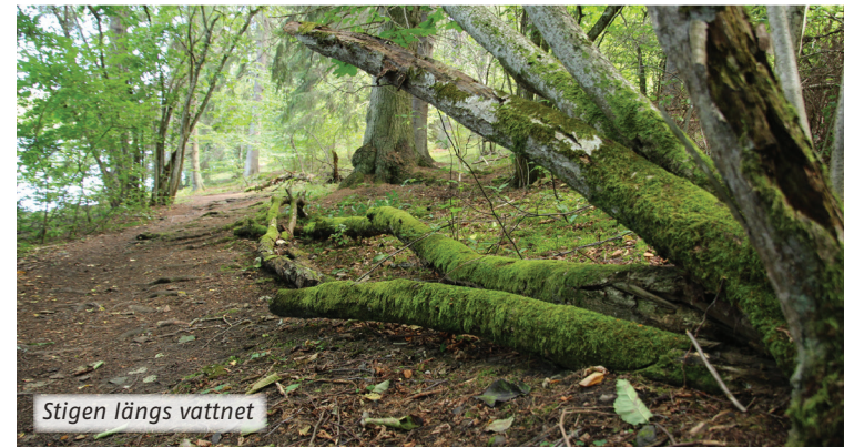
Stigen längs vattnet