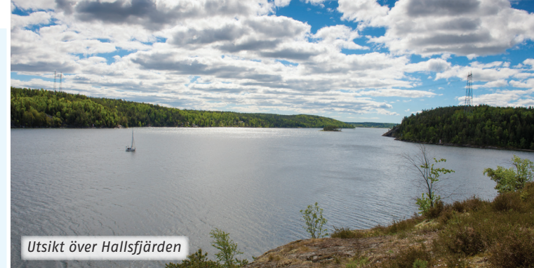
Utsikt över Hallsfjärden